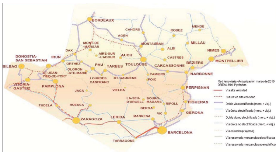
Comunicaciones ferroviarias en el área pirenaica. Direction Régionale de l'Environnement, de l'Aménagement et du Logement (DREAL)

Aragón es, desde el punto de vista geográfico, un territorio periférico en la Unión Europea, cuyo centro de gravedad se está desplazando progresivamente hacia el Este, por lo que las conexiones externas son vitales para su integración en el espacio central europeo.