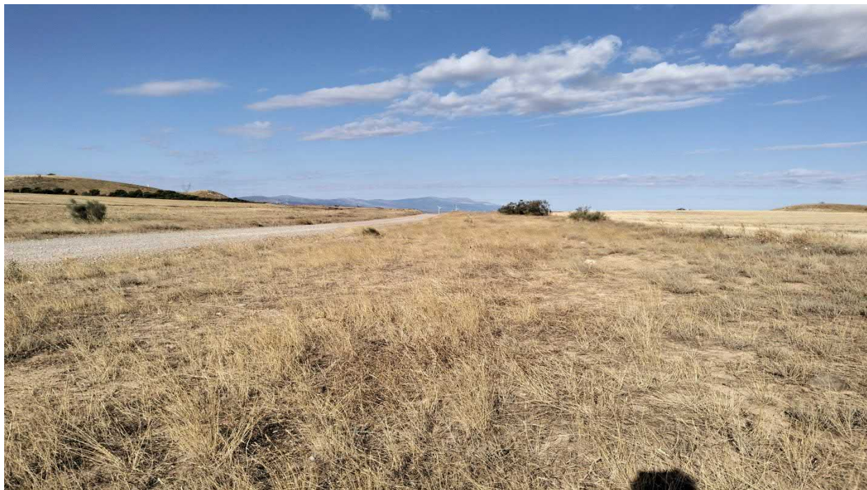
Figura. 7. Tramo del tercio inicial de la evacuación que atraviesa linde de camino con matorral halonitrófilo degradado de Artemisia herba-alba y pastizal de Plantago albicans [HIC 1430 Matorrales halonitrófilos ( Pegano-Salsoletea )].