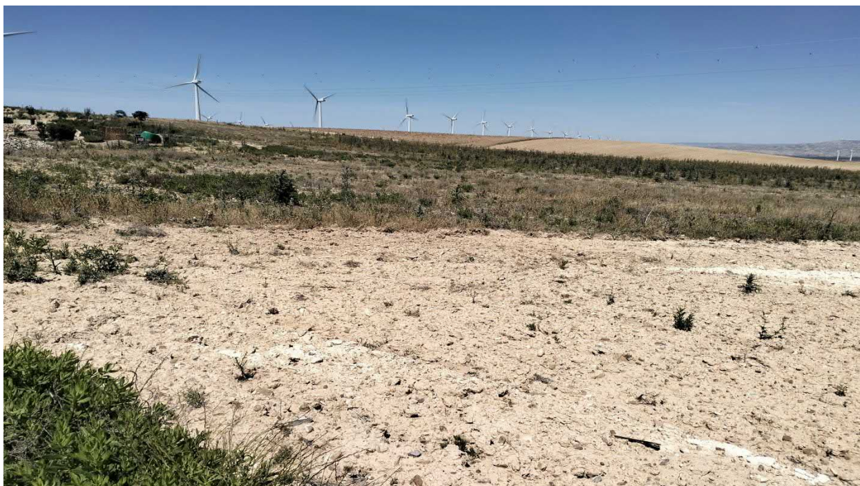
Figura. 2. Tramo inicial de la evacuación, entre cultivos herbáceos de secano y comunidades ruderales.