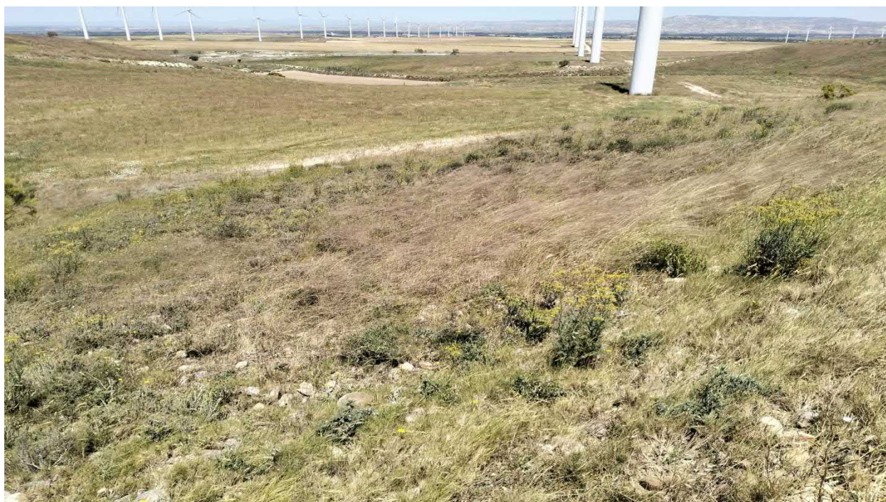
Figura. 4. Tramo inicial de la evacuación que discurre por loma con lastonar de Brachypodium retusum (HIC 6220* de tipo subestépica de gramíneas y anuales del Thero-Brachypodietea ).