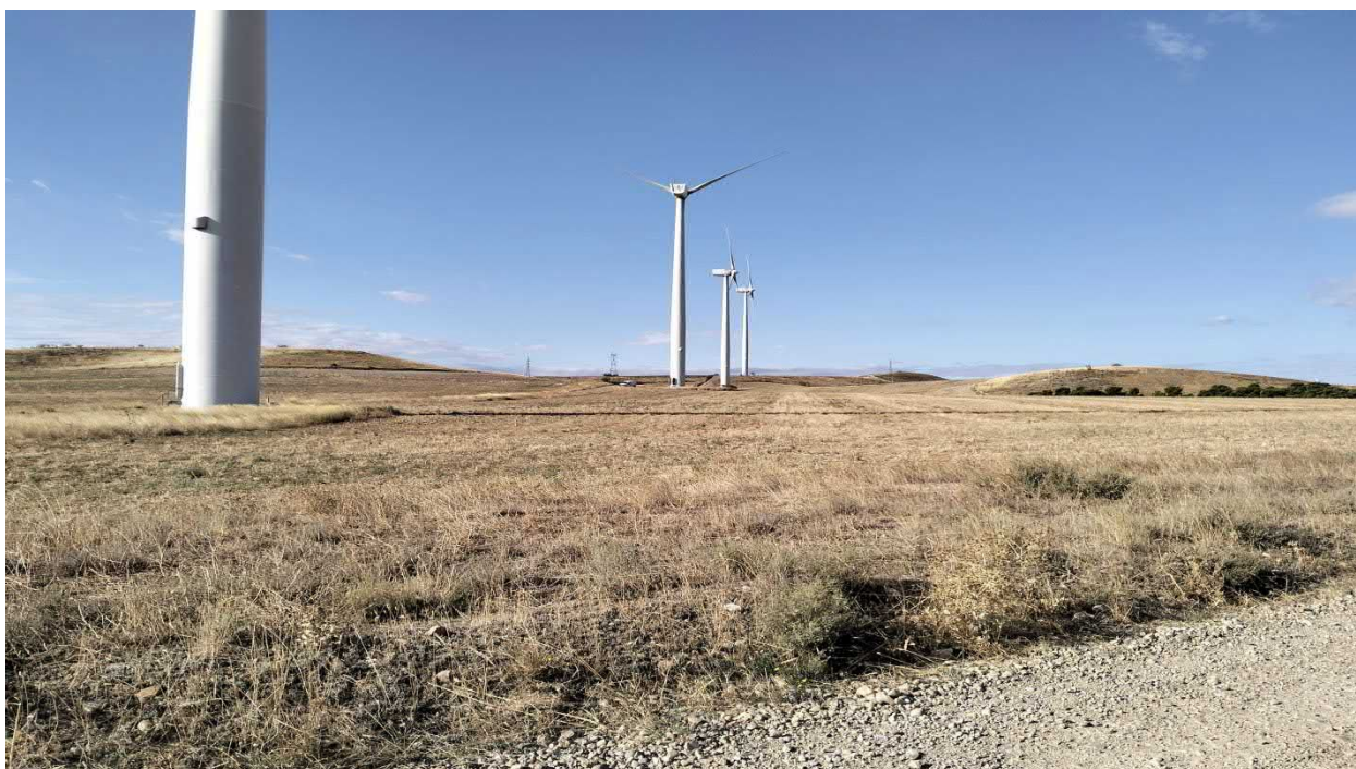
Figura. 6. Tramo del tercio inicial de la evacuación que discurre entre cultivos herbáceos de secano y linde de camino con matorral halonitrófilo degradado de Artemisia herba-alba [HIC 1430 Matorrales halonitrófilos ( Pegano-Salsotea )].