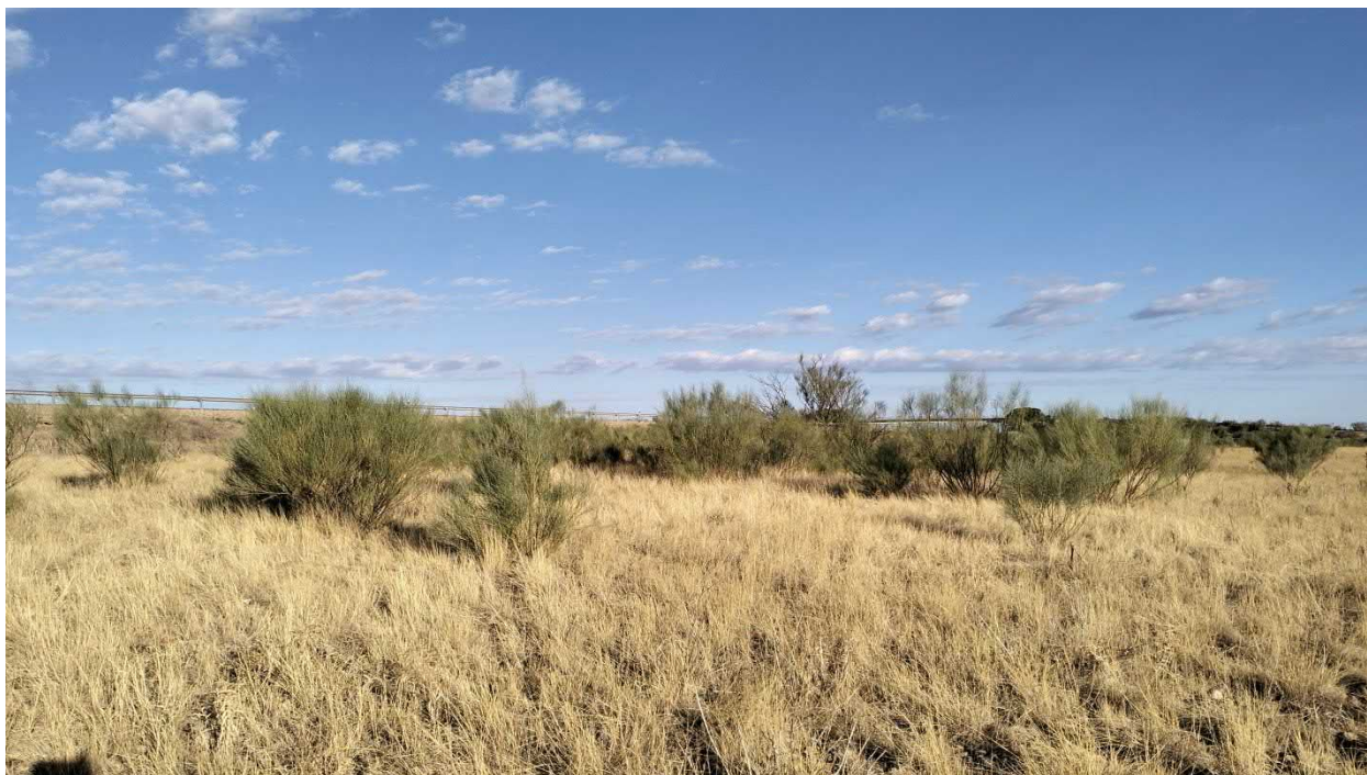
Figura. 14. Detalle de retamar en parcela de emplazamiento del Centro de Datos, por donde discurre la evacuación (HIC 5330 Matorrales termomediterráneos, matorrales suculentos canarios (Macaronésicos) dominados por euphorbias endémicas y nativas y tomillares semiáridos dominados por plumbagináceas y quenopodiáceas endémicas y nativas).