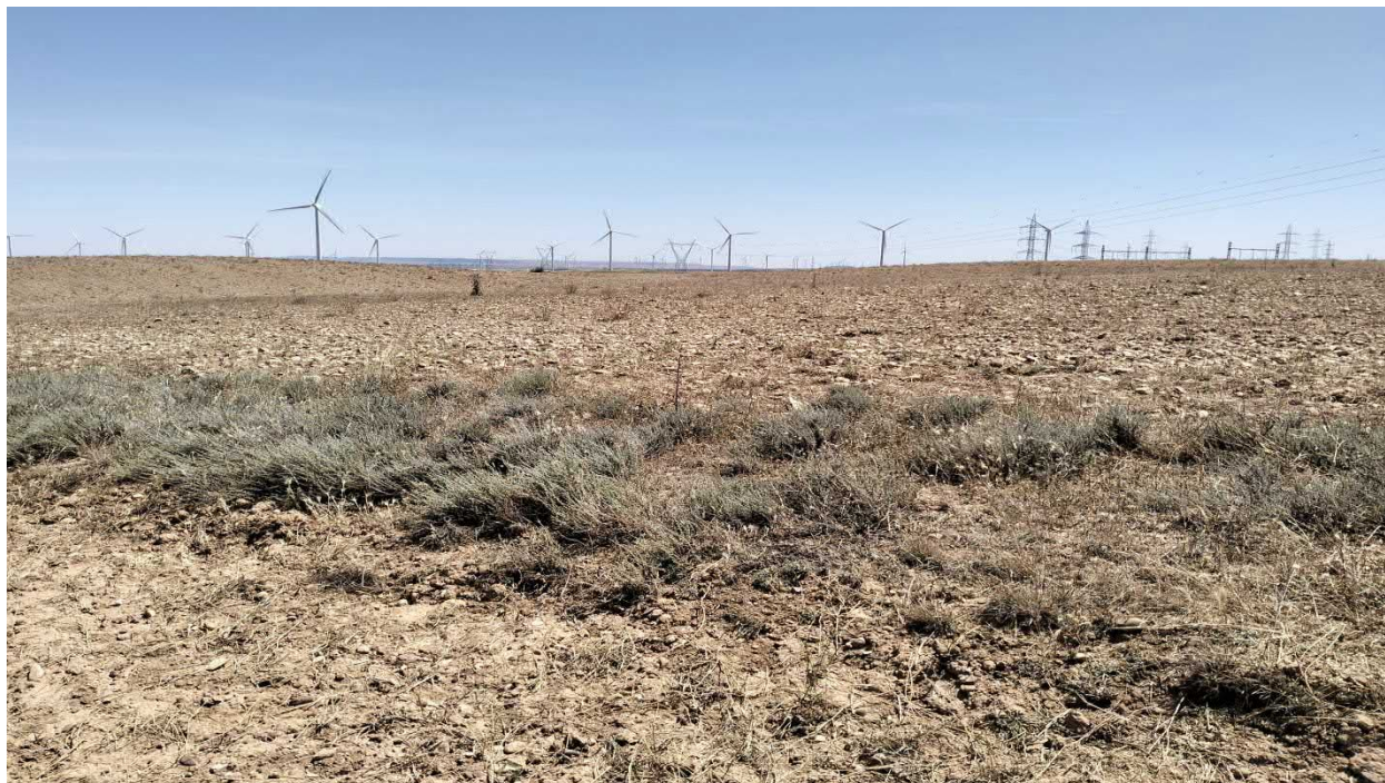
Figura. 3. Tramo del tercio inicial de la evacuación que discurre entre cultivos herbáceos de secano y linde de matorral halonitrófilo de Artemisia herba-alba [HIC 1430 Matorrales halonitrófilos ( Pegano-Salsoletea )].