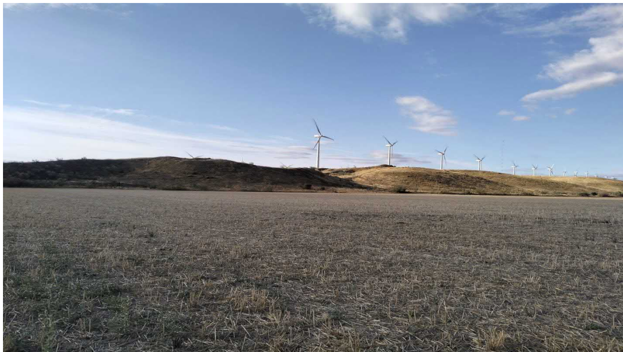
Figura. 11. Tramo del tercio final de la evacuación que discurre entre cultivos herbáceos de secano.