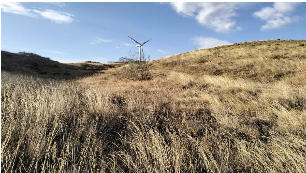
Figura. 10. Tramo del tercio final de la evacuación que discurre por loma con mosaico de espartal de Stipa parviflora y lastonar de Brachypodium retusum (HIC 6220* de tipo subestépica de gramíneas y anuales del Thero-Brachypodietea ).