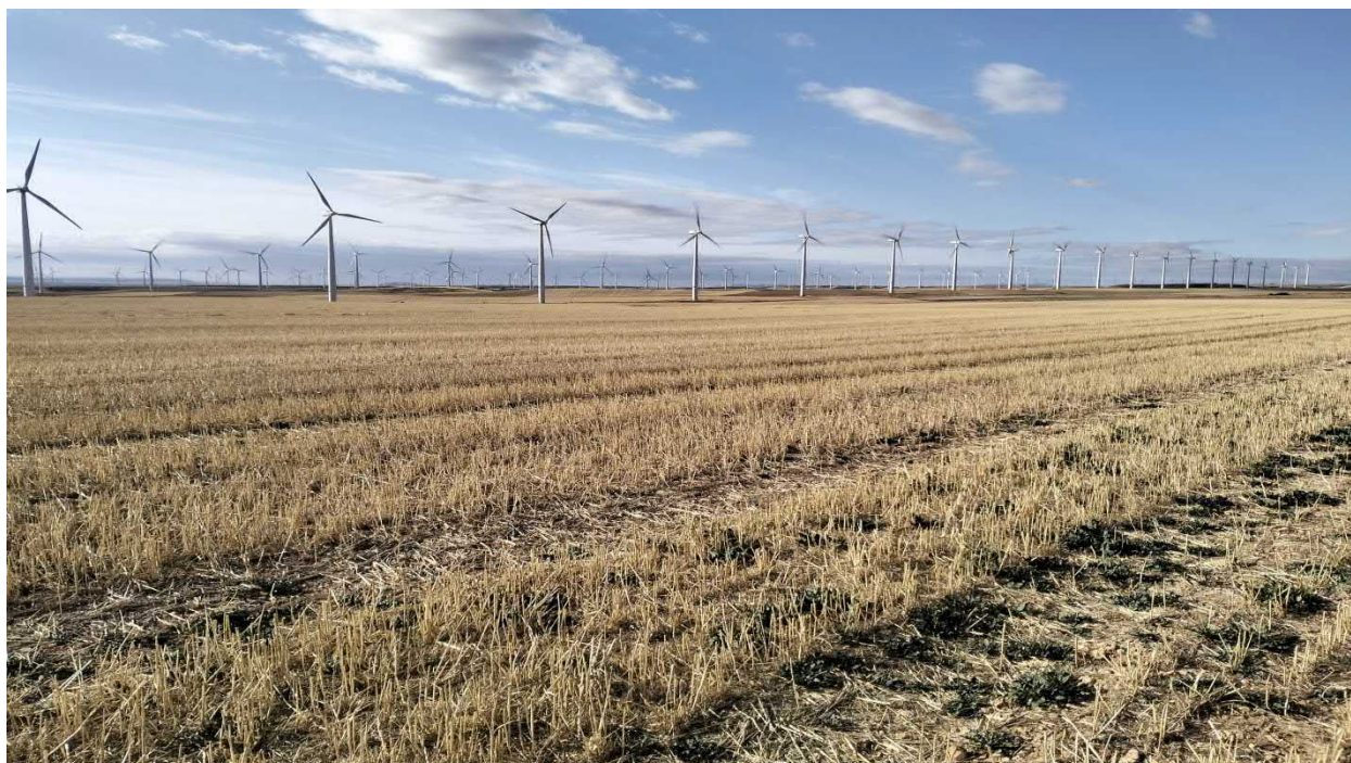
Figura. 8. Tramo medio de la evacuación que discurre entre cultivos herbáceos de secano.