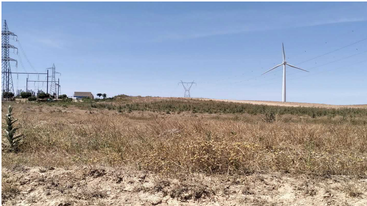
Figura. 1. SET actual El Bayo y tramo inicial de la evacuación, entre cultivos herbáceos de secano y comunidades ruderales.