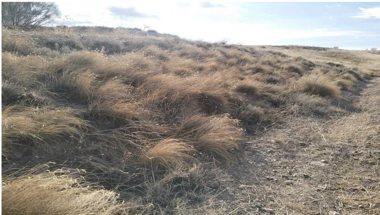
Figura. 5. Tramo del tercio inicial de la evacuación que discurre entre cultivos herbáceos de secano y linde de albardinar ( Lygeum spartum ; HIC 6220* de tipo subestépica de gramíneas y anuales del Thero-Brachypodietea ).