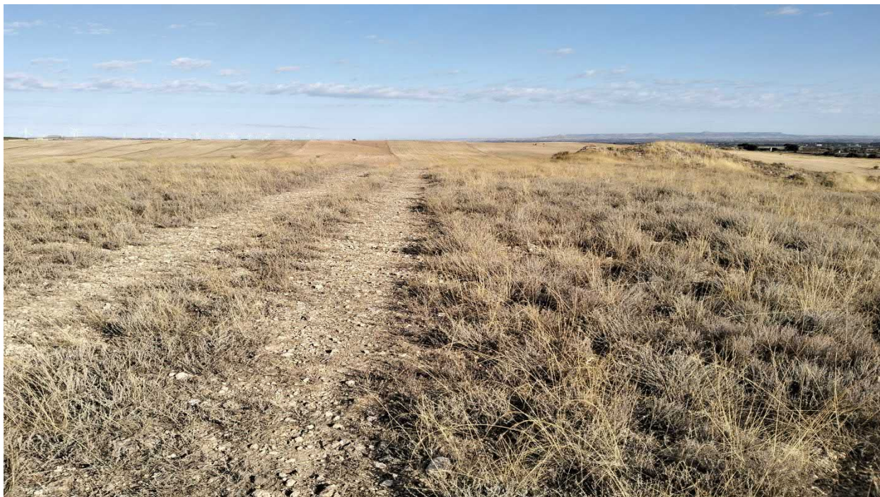
Figura. 9. Tramo del tercio final de la evacuación que discurre por vial entre mosaico de matorral halonitrófilo de Artemisia herba-alba y espartal de Stipa parviflora (HICs 1430 Matorrales halonitrófilos ( Pegano-Salsoletia ); 6220* de tipo subestépica de gramíneas y anuales del Thero-Brachypodietea ).