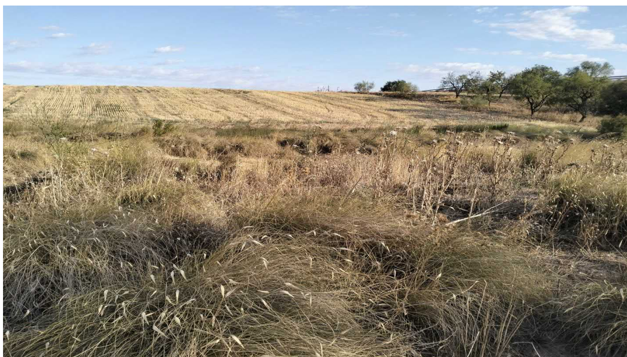
Figura. 12. Tramo final de la evacuación que discurre a través del barranco de El Bayo, con presencia de mosaico de albardinar ( Lygeum spartum ) y comunidades ruderales (HIC 6220* de tipo subestépica de gramíneas y anuales del Thero-Brachypodietea .).