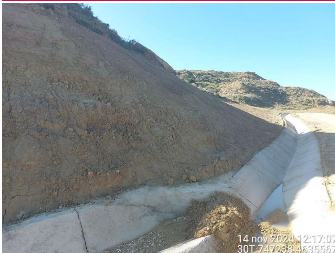
Imagen 1. Talud de la zanja RMT que se debe revegetar.