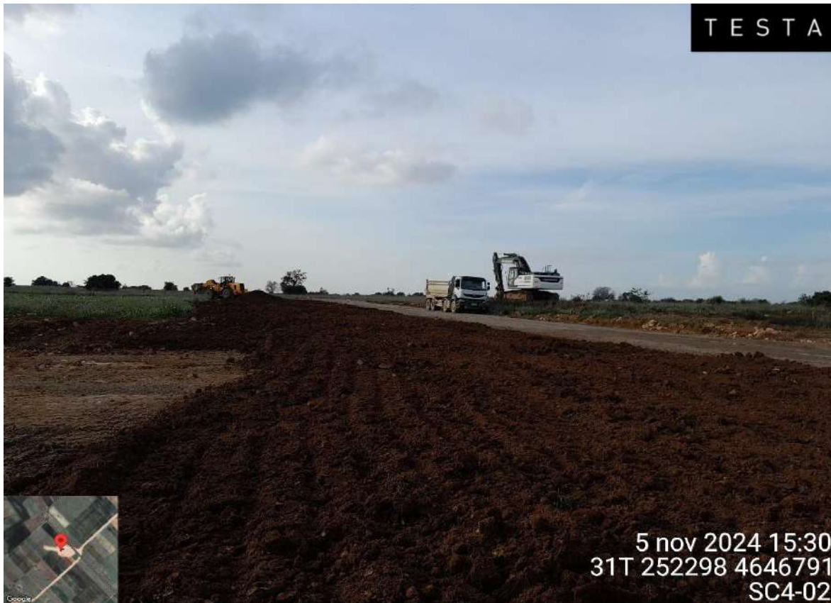
Imagen 2. Extendido de tierra vegetal durante los trabajos de restauración en la posición SC4-02