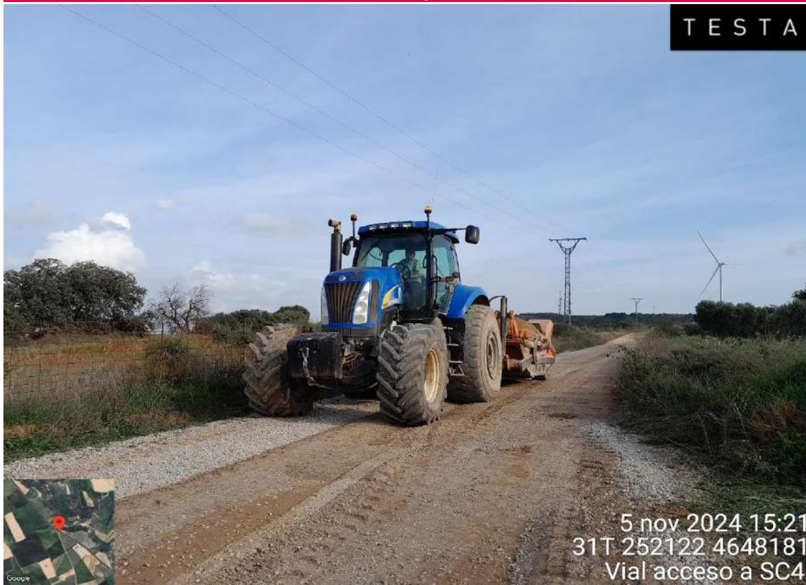
Imagen 1. Trabajos de restauración en el vial de acceso al PE SC4