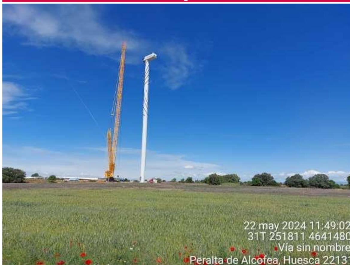
Imagen 1. Montaje del aerogenerador SC3-04.