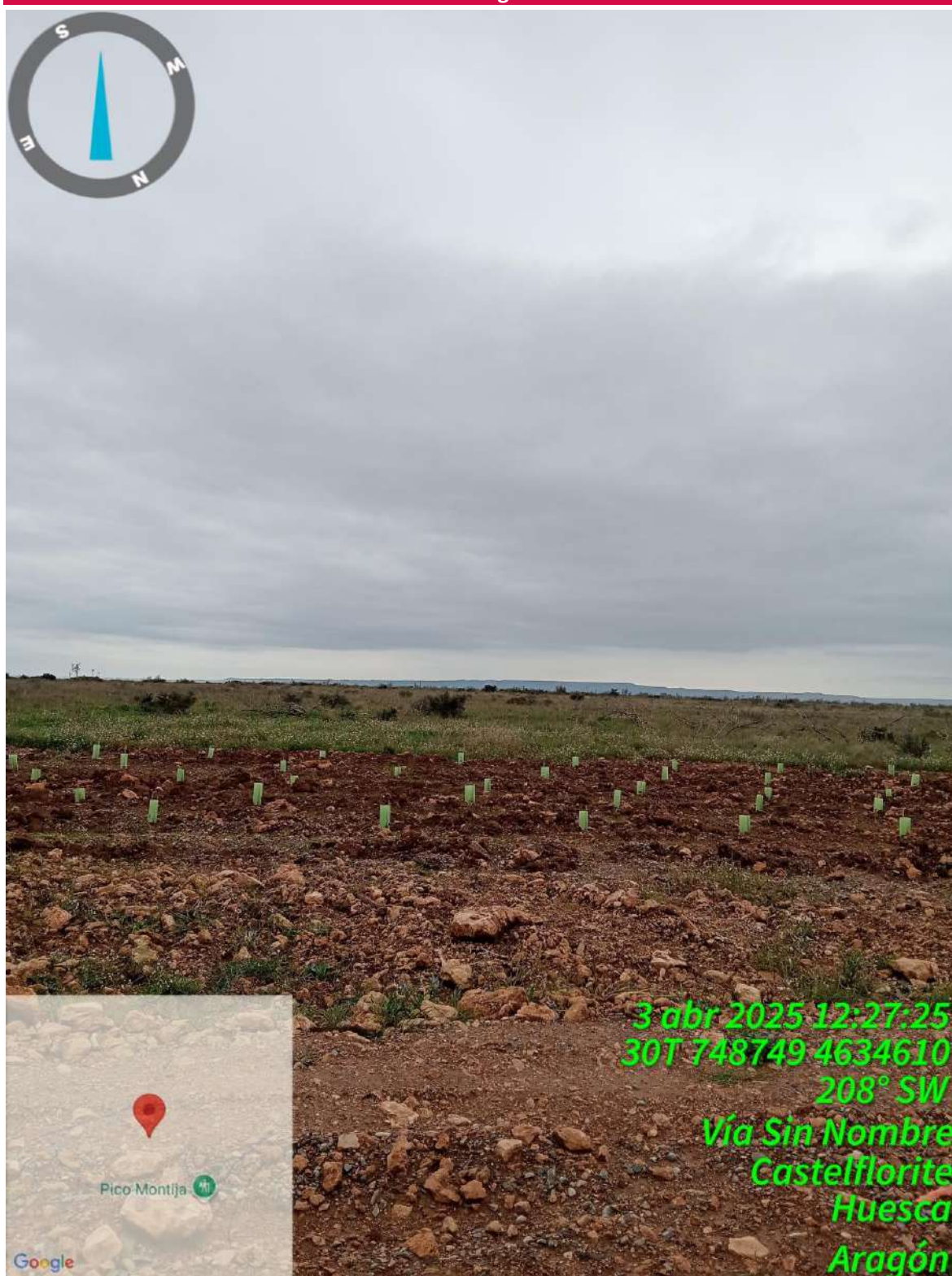
Imagen 1. Estado de la plantación en SC1.