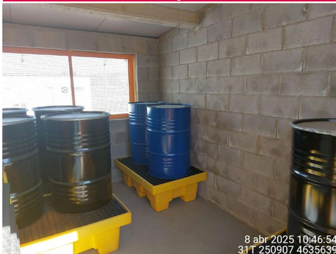
Imagen 1. Punto limpio SET SC1. Almacén residuo peligroso.