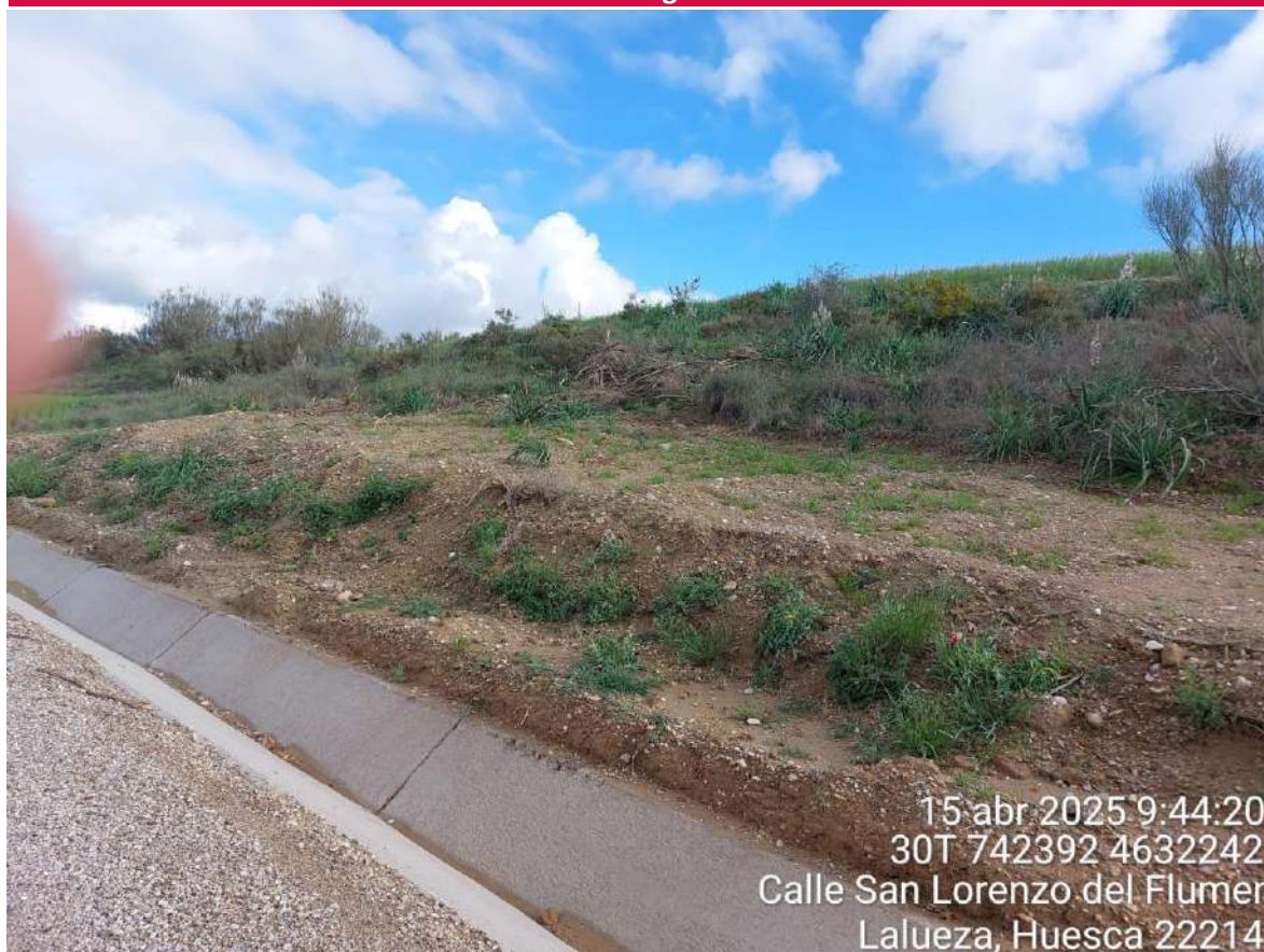
Imagen 1. Zona de zanja RMT con recolonización positiva.