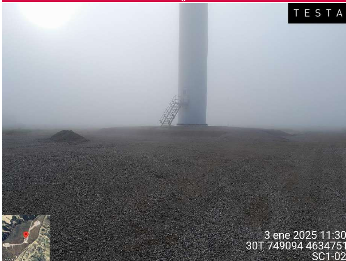
Imagen 1. Posición SC1-02