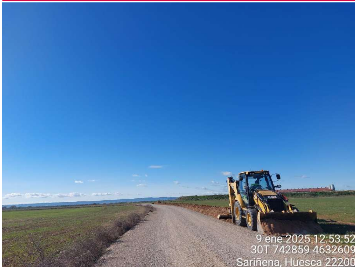
Imagen 1. Maquinaria realizando excavaciones para realización de cunetas en SCA.