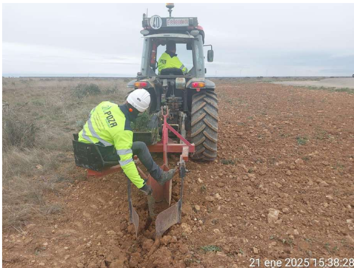
Imagen 1. Plantaciones en SC1 y en SET SC1.