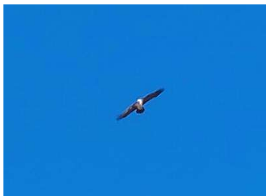
Imagen 2. Quebrantahuesos ( Gypaetus barbatus ) sobrevolando SCA.