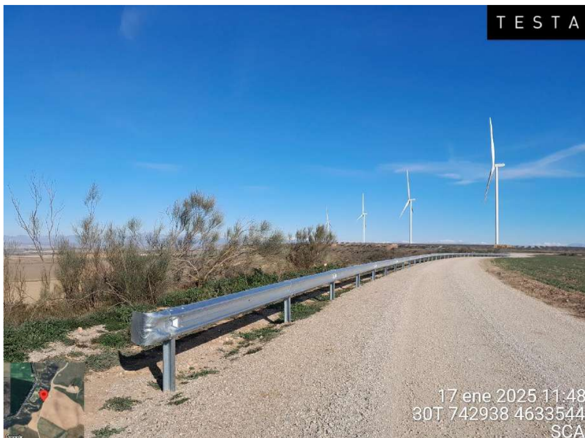
Imagen 2. Colocación de biondas en SCA