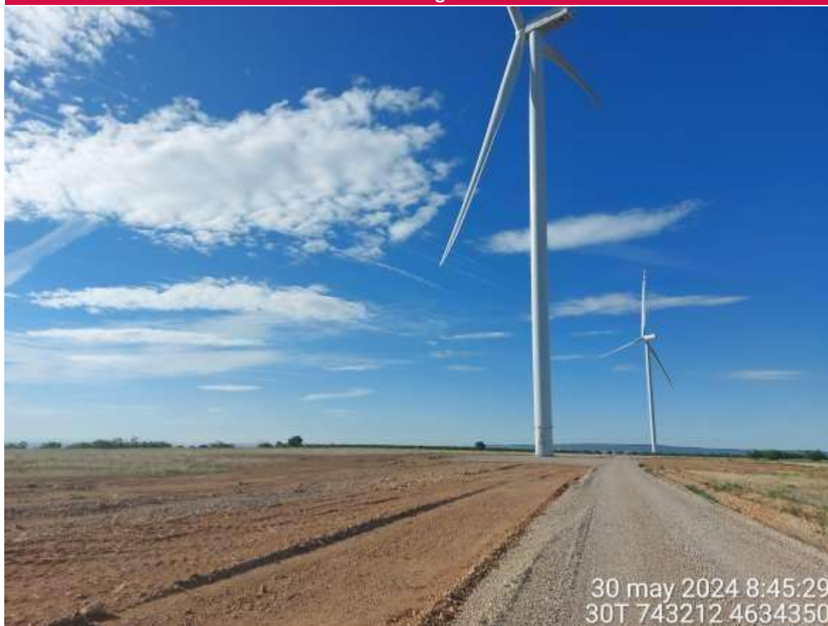
Imagen 1. Posición SCA-01 restaurada con SCA-02 al fondo.