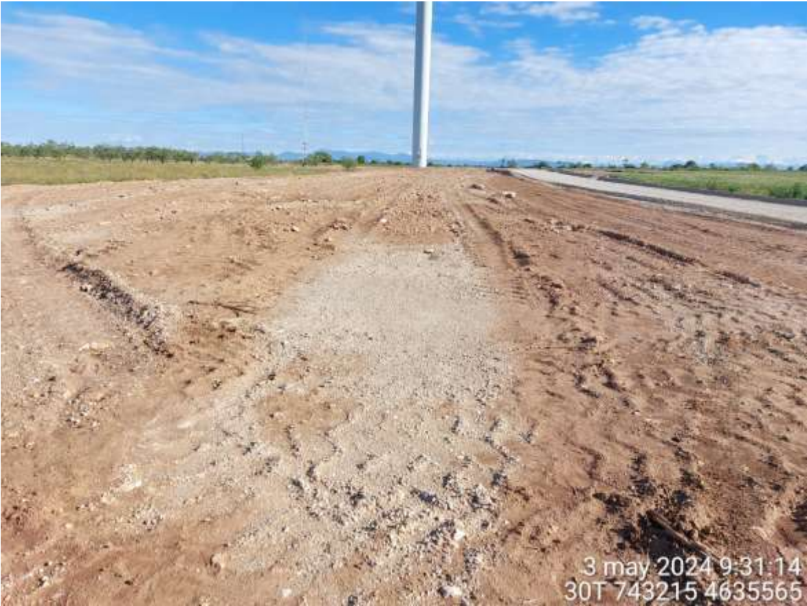
Imagen 1. Restauración ambiental en SC2 y SCA.