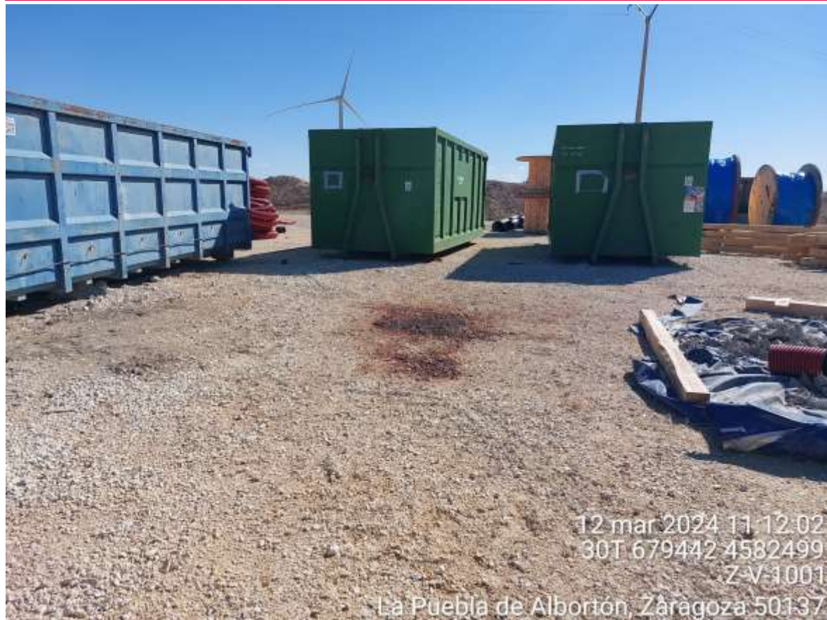
Imagen 1. Mancha en la campa que se retira tras aviso.