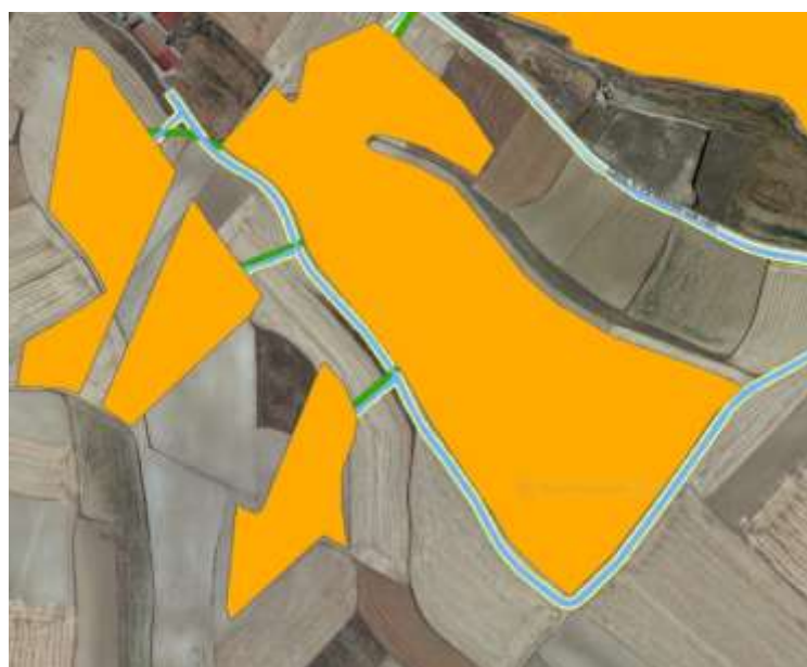
Imagen de Vial de parque (indicada en color Azul)