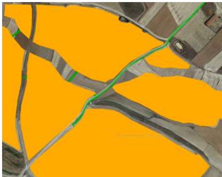
Imagen en planta de la Servidumbre de zanja (indicado en verde)