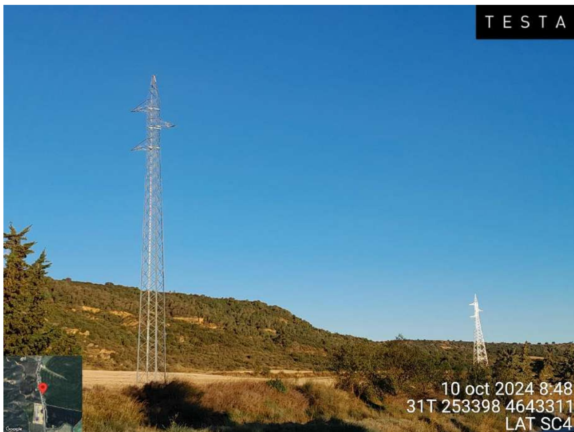
Imagen 1. Visual de los apoyos de la LAT SC4 esperando ser izados