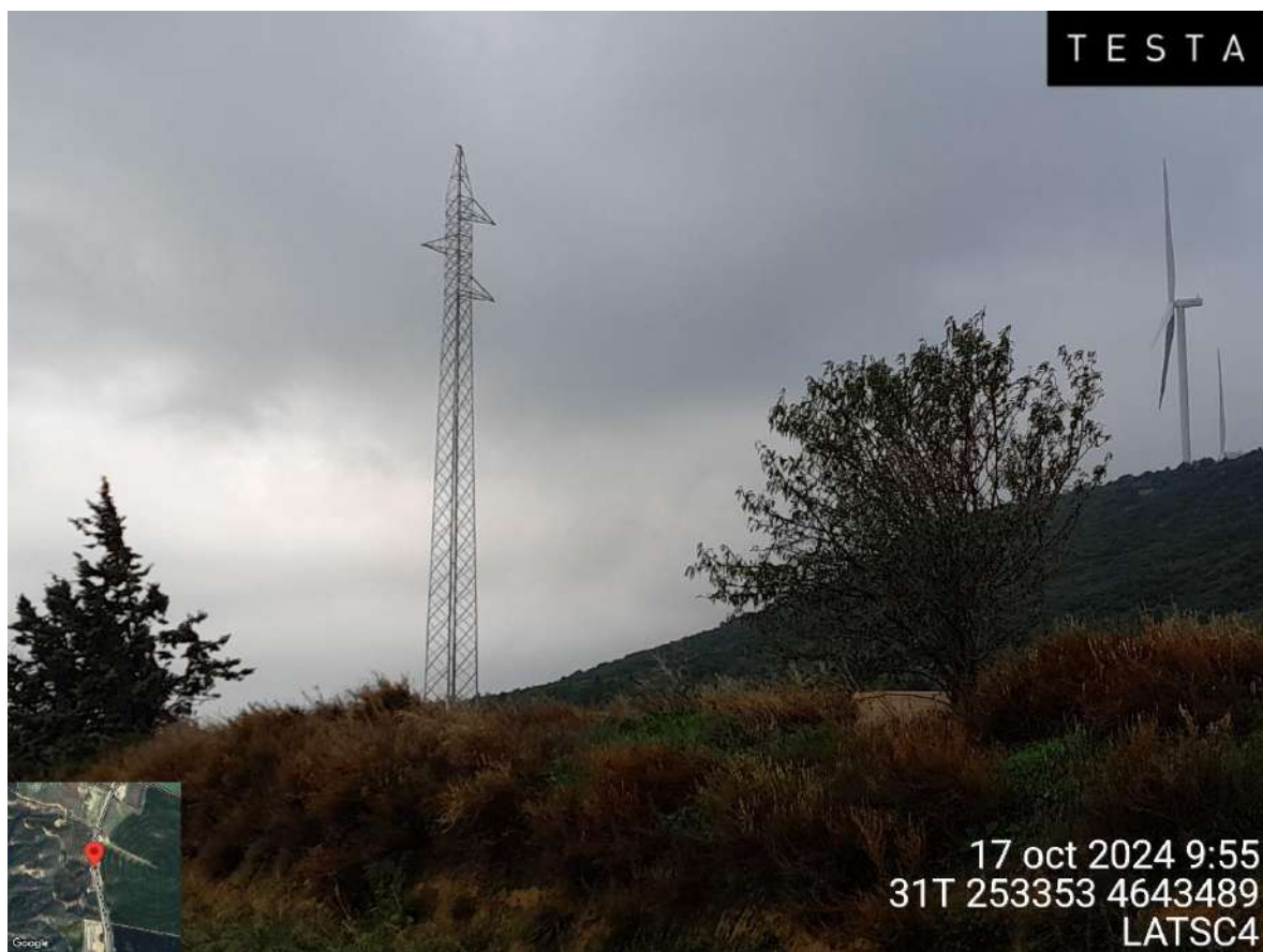
Imagen 1. Apoyo de la LAT SC4