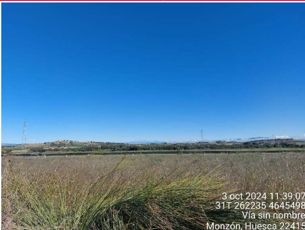
Imágen 1. Panorámica de los apoyos 18 y 19 de LAT SC4-Armentera montados a la espera de ser izados.