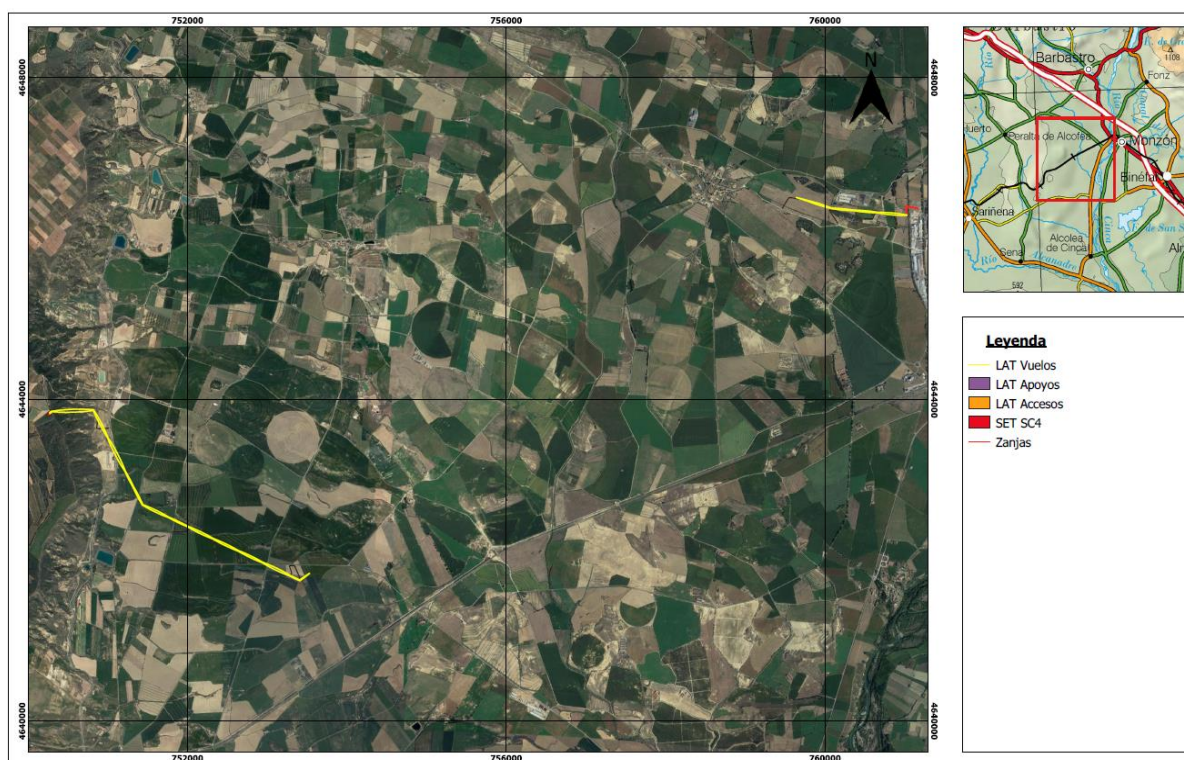
Ilustración 1. Localización LAT Set Santa Cruz IV - Set Armentera

La SET Santa Cruz 4 y línea de alta tensión “SET Santa Cruz 4-SET Armentera” se encuentra situado en los términos municipales de Peralta de Alcofea, Ilche y Monzón (Huesca), y dentro del denominado Complejo Eólico Cinca.