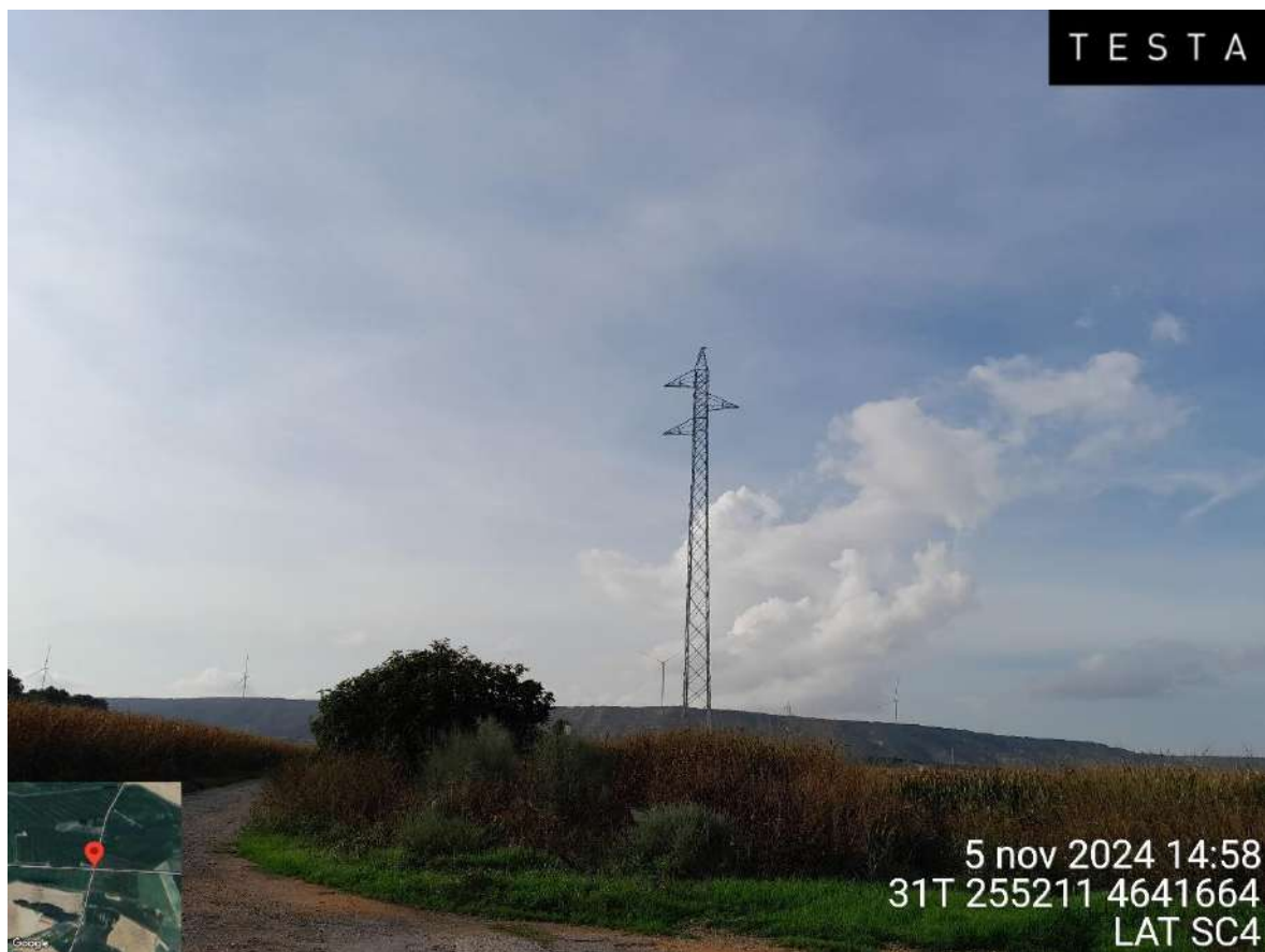
Imagen 1. Visual de uno de los apoyos de la LAT SC4