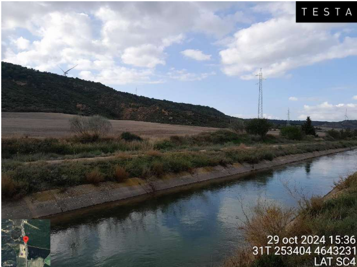
Imagen 1. Imagen panorámica de los apoyos de la LAT SC4