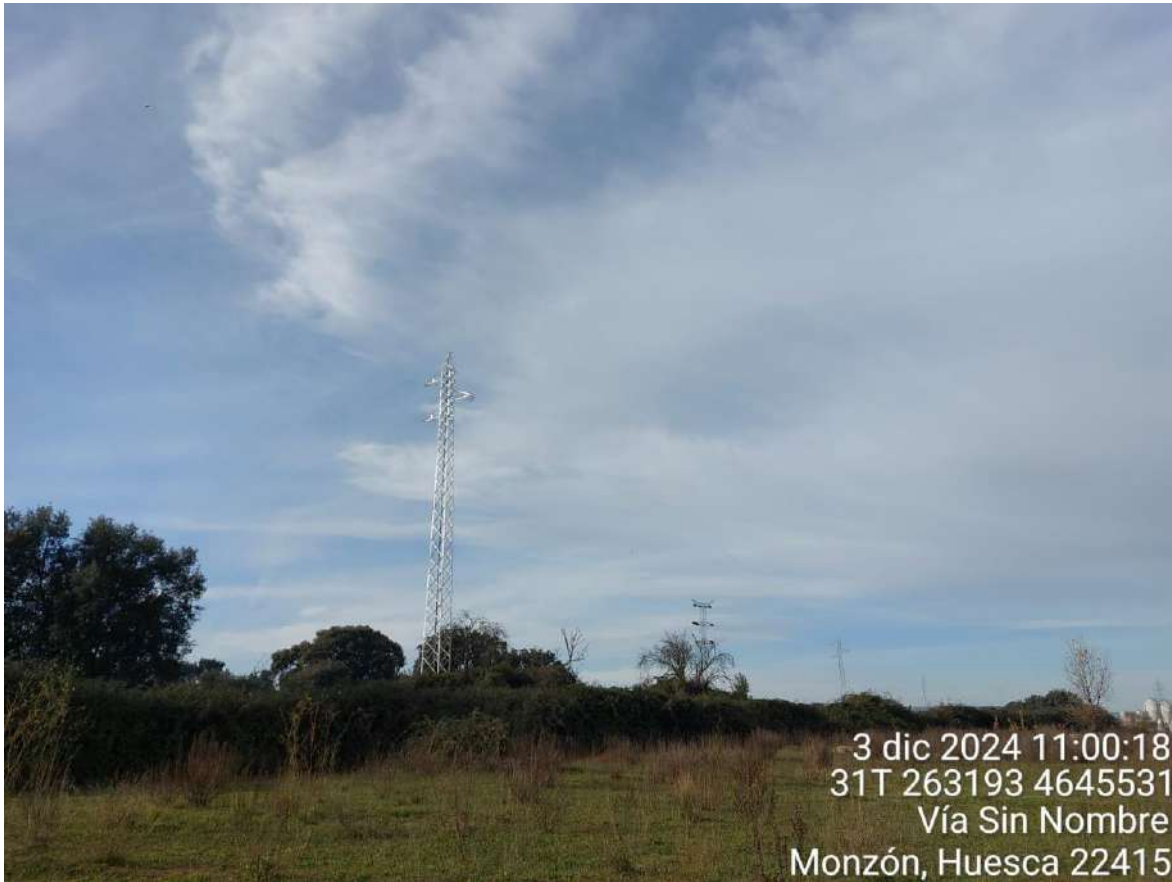
Imagen 1. Apoyo izado en el entorno de Armentera.