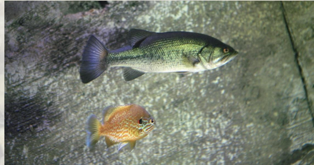
Foto: Black bass ( Micropterus salmoides ) y Pez Sol ( Lepomis gibbosus ) (J. Marco)

Pesca del cangrejo rojo americano: Se autoriza para la captura de esta especie el uso de reteles, lamparillas, arañas y artes similares. Se entienden por lamparillas o reteles las artes de pesca formadas por dos o más anillos de metal con una red en su interior que suelen tener forma de bolsa y donde los cangrejos son atrapados únicamente cuando se realiza la acción de recoger el aparato mediante una cuerda o una pértiga. Cada pescador ocupará con sus artes un tramo de aguas corrientes, o en su caso, orillas de aguas embalsadas, de una extensión máxima de cien (100) metros. El número máximo de reteles a utilizar será de ocho (8). Se prohíben las nasas para la pesca del cangrejo rojo. Se recomienda la manipulación de los cangrejos rojos con guantes con el fin de disminuir las posibilidades de que las personas que los manipulen se contagien con determinadas zoonosis como la tularemia.