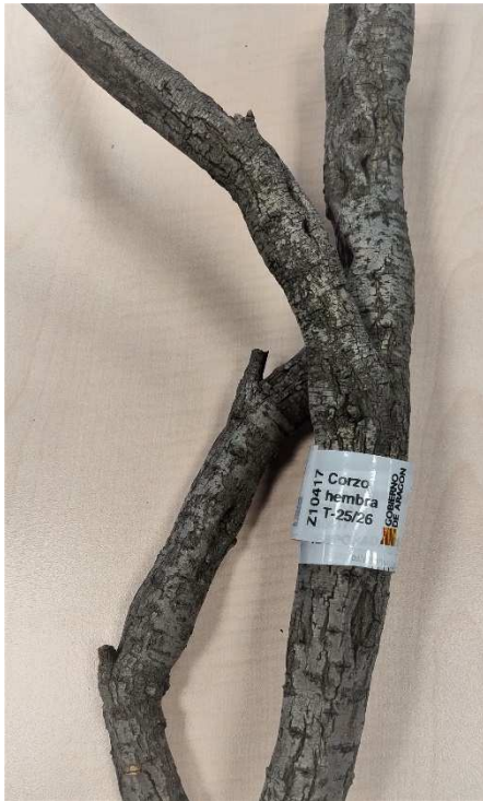
Precinto (modo pulsera)