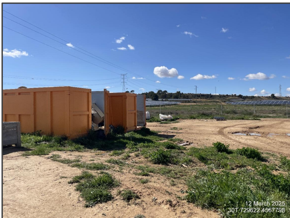
Fotografía 25. Zona de acopio de placas solares deterioradas.