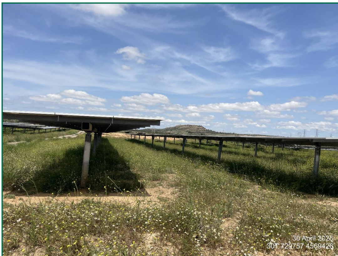
Fotografía 2. Vegetación entre placas actualmente.

Se ha realizado un seguimiento de la evolución de las revegetaciones realizadas durante los meses de invierno de 2020. Estas plantas se desarrollan, aunque se ha observado la desaparición de ejemplares. Durante la primavera se produce un desarrollo de la vegetación espontánea de la zona, que en ocasiones compite con la vegetación plantada. En todo caso esta proliferación vegetal contribuye a evitar la erosión.