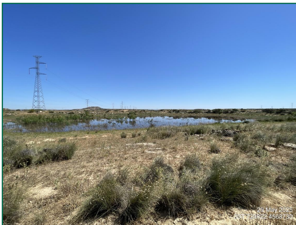
Fotografía 7. Laguna en el interior.

Destacar la presencia de aves acuáticas en una pequeña laguna que se ha formado en el interior de la planta solar, donde se han visto ánades, zampullines y limícolas, y coincide con la zona de mayor densidad de la figura.