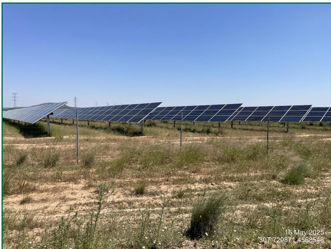
Fotografía 4. Zona revegetada.