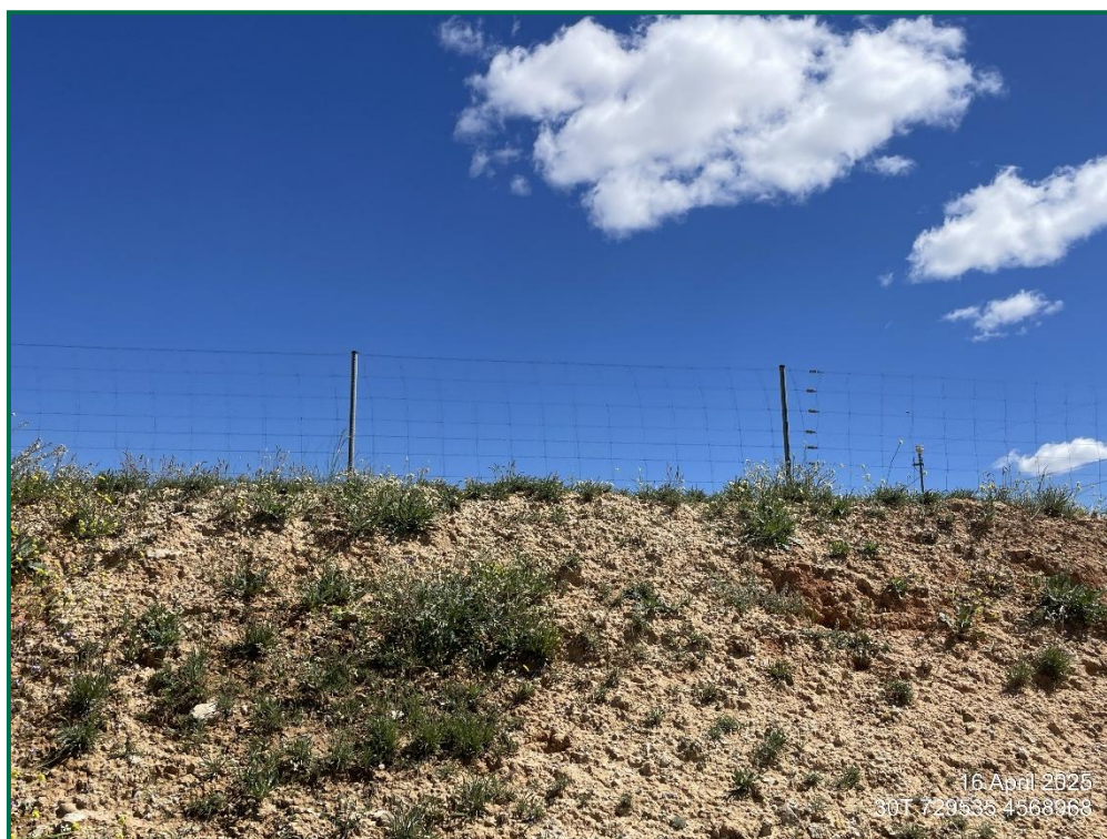
Fotografía 5. Vallado perimetral.

Respecto al vallado perimetral, se ha utilizado en todas las plantas malla cinegética que permite el paso de fauna de pequeño tamaño. Este vallado mide 2 metros de altura total y está formado por una serie de alambres verticales y horizontales, con una separación entre los verticales de 30cm, y entre los horizontales de mínimo 15cm en la línea inferior. Este vallado no presenta elementos cortantes ni punzantes.