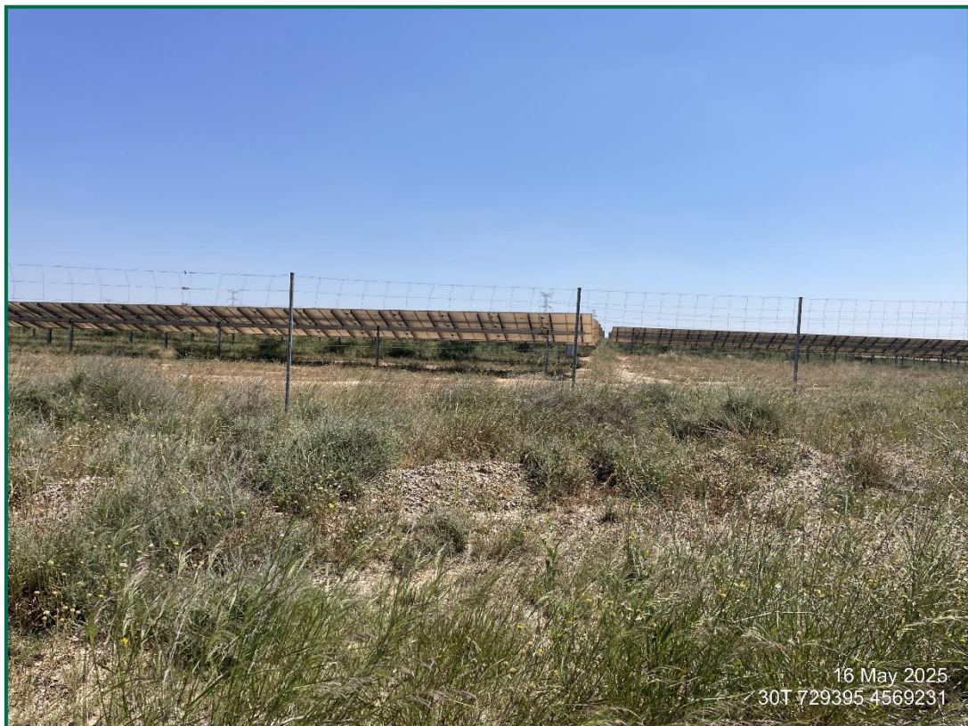
Fotografía 3. Zona revegetada.