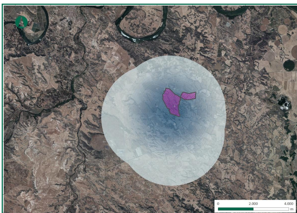
Figura 3. Uso del espacio por rapaces y aves de mayor envergadura.

Los resultados se pueden ver en la siguiente figura: