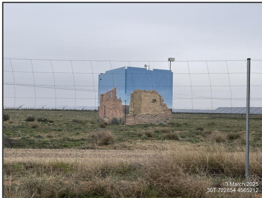
Fotografía 10. Exterior del primillar, pintado.