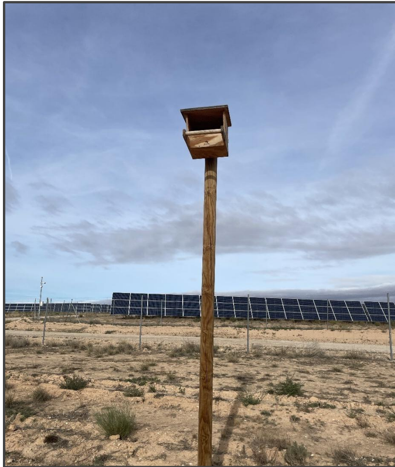
Fotografía 13. Caja para rapaces, sobre poste.