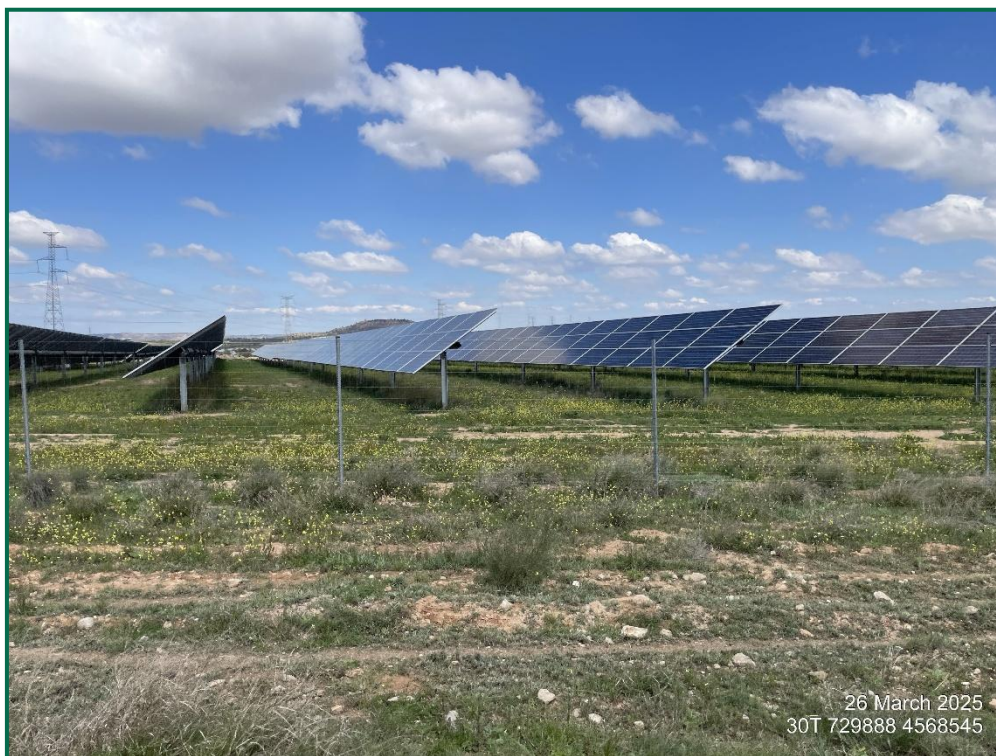
Fotografía 6. Vallado perimetral.

Con objeto de realizar un seguimiento de fauna se han realizado las siguientes acciones: