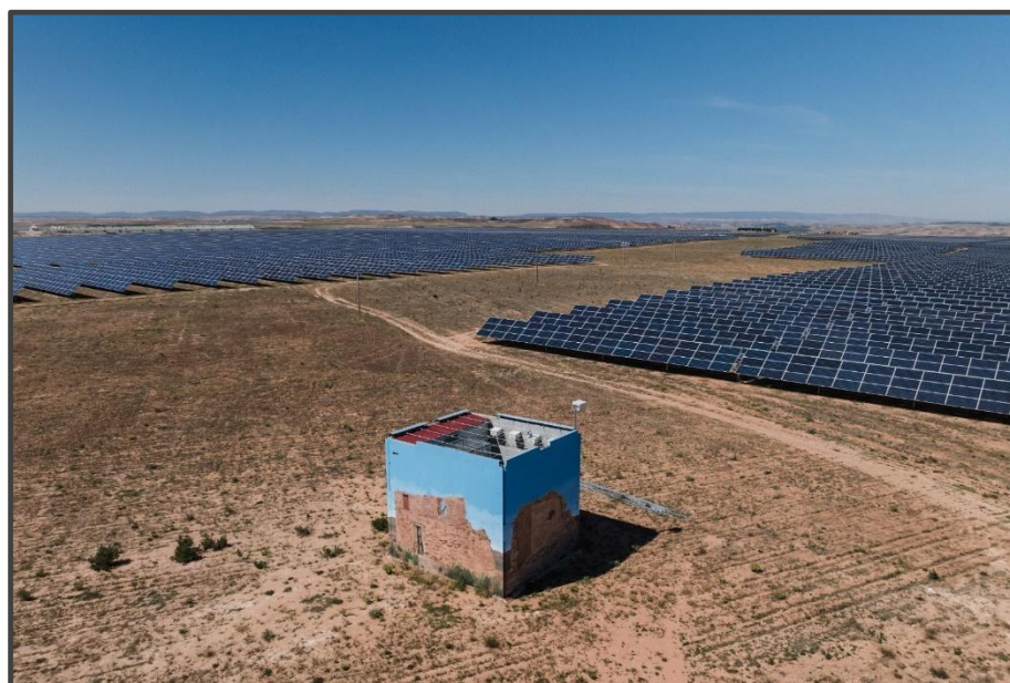
Fotografía 11. Exterior del primillar, pintado.