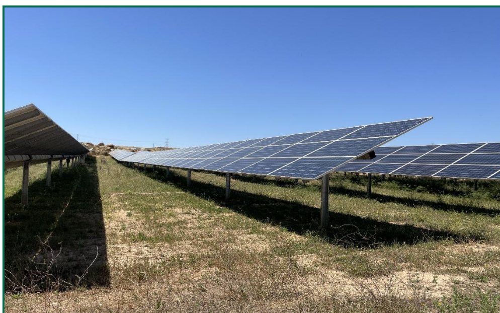
Fotografía 1. Vegetación entre placas actualmente.

En el periodo que abarca este informe se ha introducido ganado ovino en todas las plantas solares con objeto de recortar esta vegetación, a la vez que aportan nutrientes al suelo. No se han utilizado herbicidas.