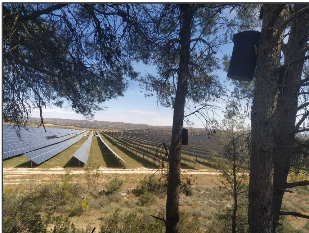
Fotografía 19. Cajas para quirópteros.