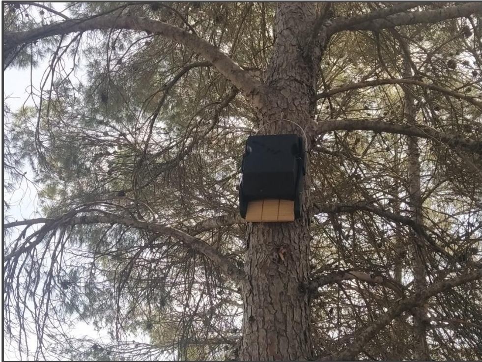
Fotografía 20. Caja para colonia de quirópteros.