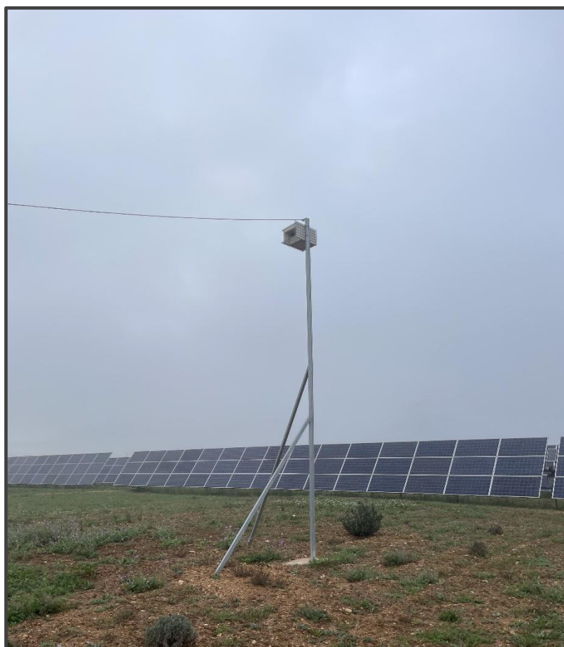
Fotografía 11. Caja para cernícalo primilla, sobre poste.

También se ha contado con la colaboración de la Fundación Internacional para la restauración de ecosistemas (FIRE) para la colocación de cajas nido y la renaturalización de diferentes zonas en el interior de las fotovoltaicas, las especies objetivo son lechuza, cernícalo, carraca y quirópteros. En el mes de abril se colocaron estas cajas nido repartidas por los hábitats considerados más adecuados para cada una de ellas, instalando en total de 21 cajas de madera para rapaces, la mayor parte de ellas colocadas en construcciones ya existentes en el interior de las plantas solares, y 5 de ellas sobre postes de nueva colocación. Estas cajas para rapaces pueden ser utilizadas especialmente por lechuza y por cernícalo vulgar. También se han instalado 9 cajas para quirópteros, adecuadas para albergar colonias y agrupadas en tres zonas con presencia de pinos y 4 cajas para carraca europea, una de ellas sobre árbol y 3 sobre poste.