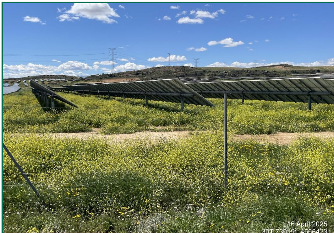
Fotografía 1. Vegetación entre placas actualmente.