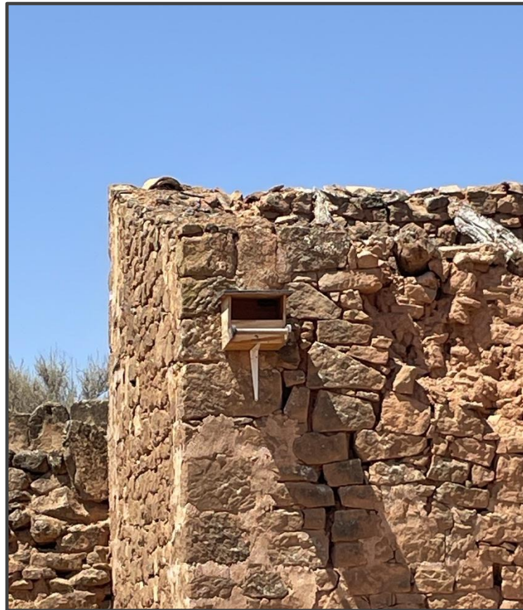
Fotografía 13. Caja para rapaz sobre construcción.