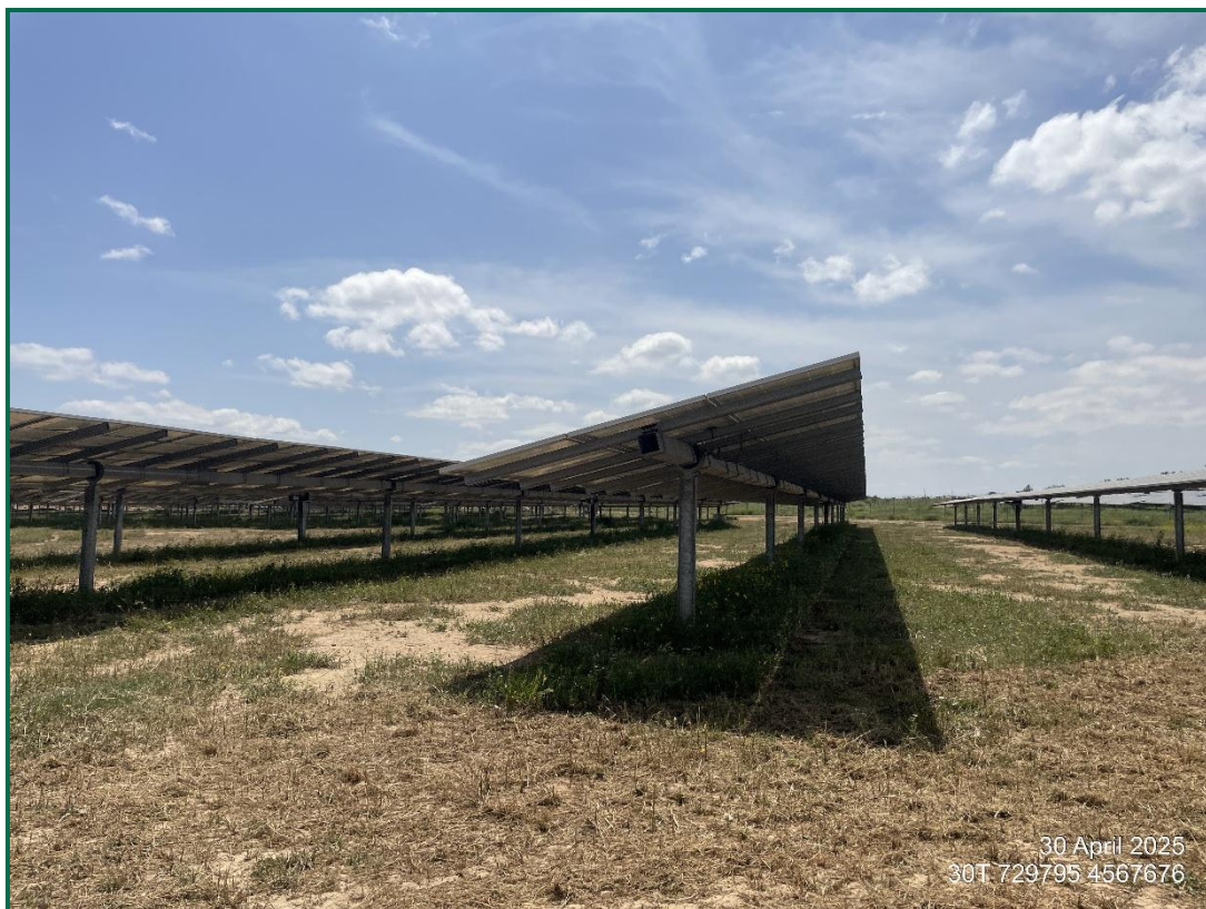
Fotografía 2. Vegetación entre placas actualmente.