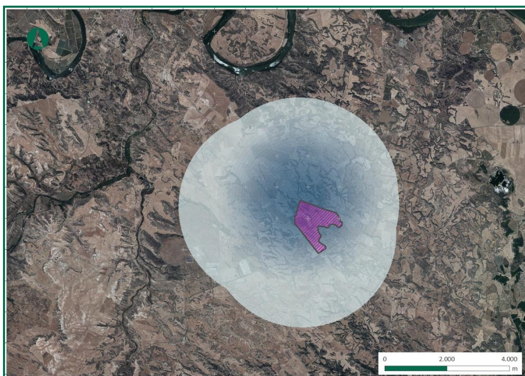
Figura 3. Uso del espacio por rapaces y aves de mayor envergadura.

Los resultados se pueden ver en la siguiente figura: