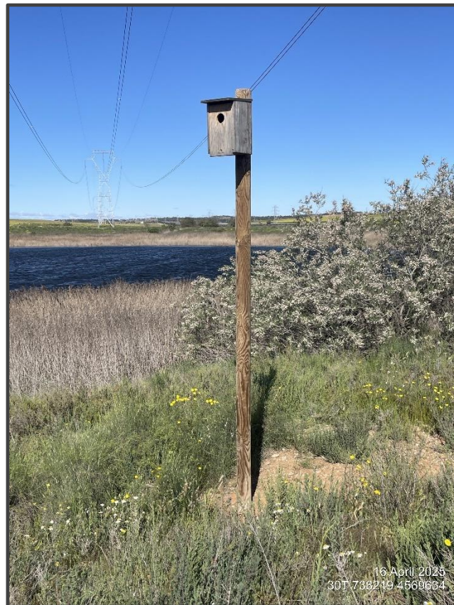
Fotografía 17. Caja para carraca junto a Hoya de Blase.