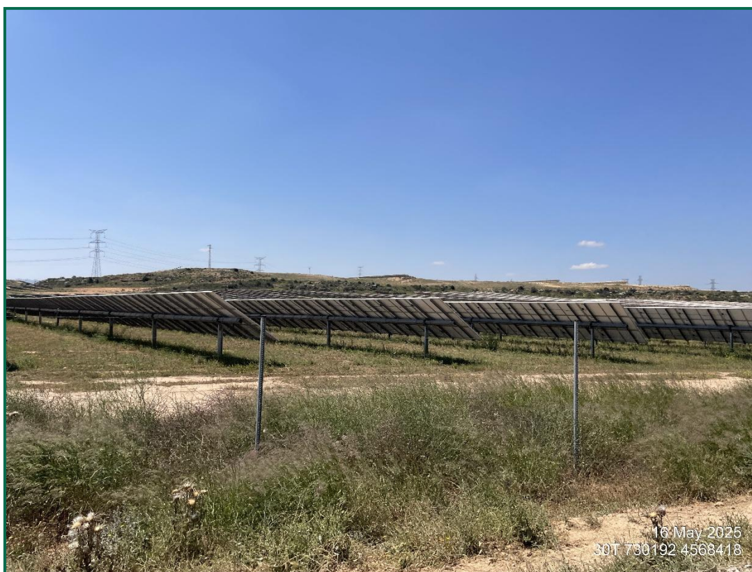
Fotografía 3. Zona revegetada recientemente.

Se ha realizado una reposición de la vegetación plantada en 2020 en todas las zonas donde se realizaron plantaciones y estas no se han desarrollado como se esperaba o han desaparecido. En primavera se llevó a cabo una reposición en todas las PFVs del grupo en la zona, durante este cuatrimestre se han seguido realizando riegos.