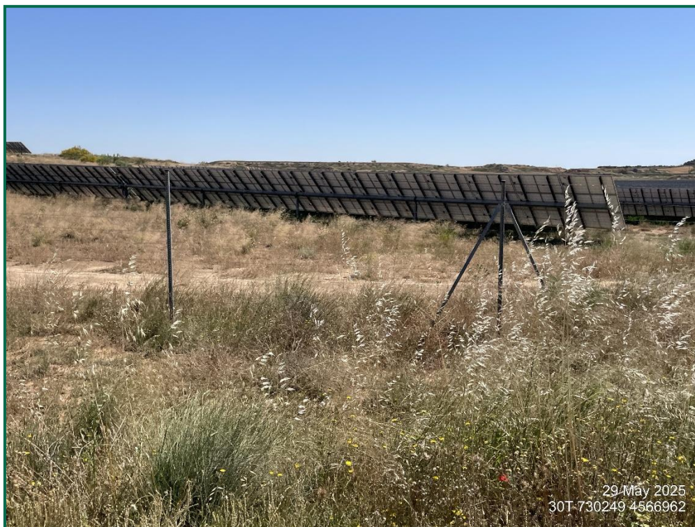
Fotografía 5. Vallado perimetral.

Respecto al vallado perimetral, se ha utilizado en todas las plantas malla cinegética que permite el paso de fauna de pequeño tamaño. Este vallado mide 2 metros de altura total y está formado por una serie de alambres verticales y horizontales, con una separación entre los verticales de 30cm, y entre los horizontales de mínimo 15cm en la línea inferior. Este vallado no presenta elementos cortantes ni punzantes.