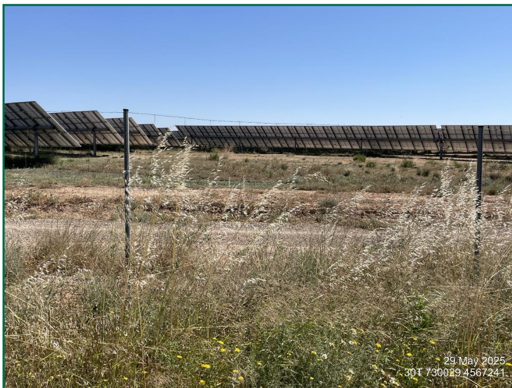
Fotografía 6. Vallado perimetral.

Con objeto de realizar un seguimiento de fauna se han realizado las siguientes acciones: