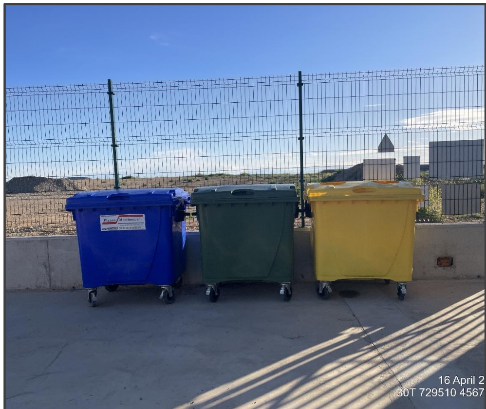
Fotografía 23. Contenedores de residuos.