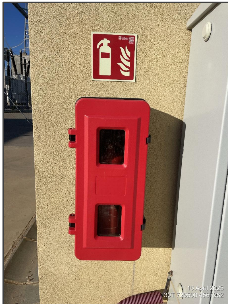
Fotografía 25. Extintores en edificio de control.

En las visitas se ha comprobado la disposición de equipos extintores de incendios en las instalaciones. Los extintores se encuentran ubicados en los edificios y en la Subestación.