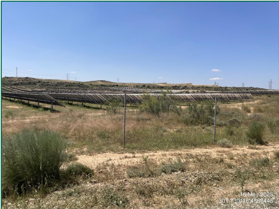
Fotografía 4. Zona revegetada.