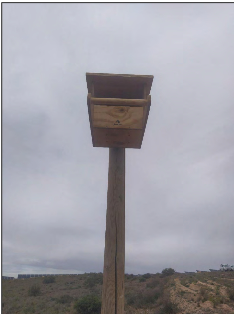
Fotografía 22. Caja para rapaces, sobre poste.