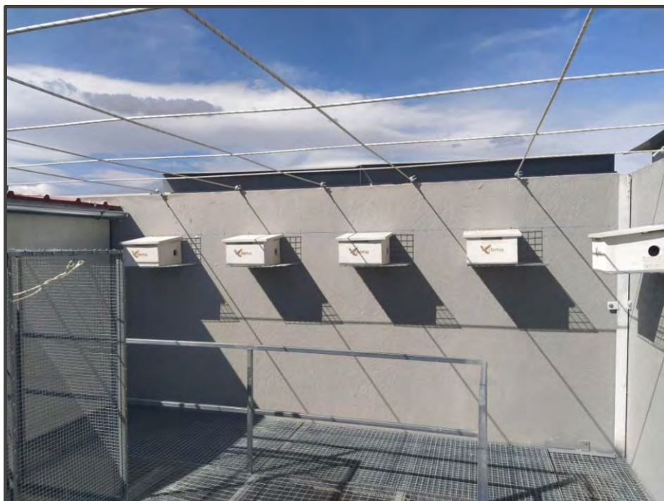
Fotografía 10. Interior del primillar, cajas nido.