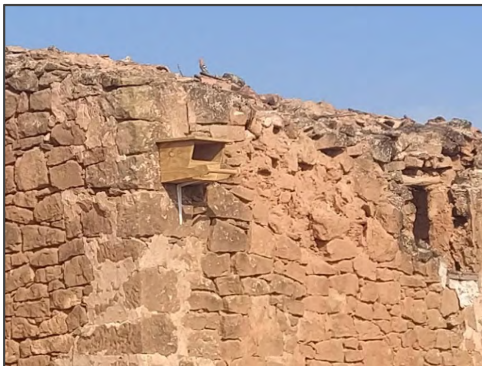
Fotografía 27. Caja para rapaces, sobre muro.