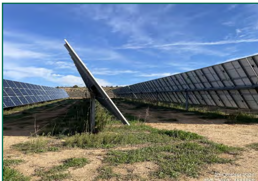
Fotografía 1. Vegetación entre placas actualmente.

En el periodo que abarca este informe se ha introducido ganado ovino en todas las plantas solares con objeto de recortar esta vegetación, a la vez que aportan nutrientes al suelo. No se han utilizado herbicidas. Se ha realizado adicionalmente poda mecánica en las zonas donde no ha resultado suficiente con el ganado.