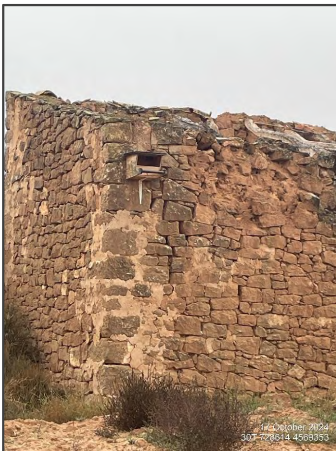
Fotografía 15. Caja para rapaz sobre construcción.