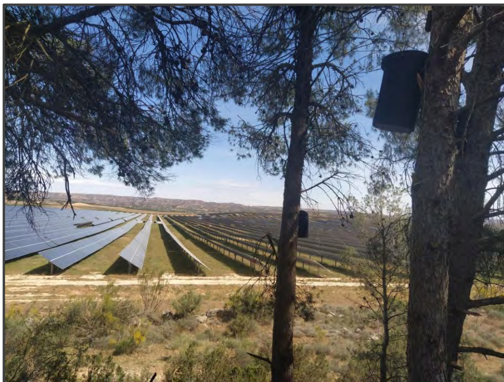
Fotografía 20. Cajas para quirópteros.