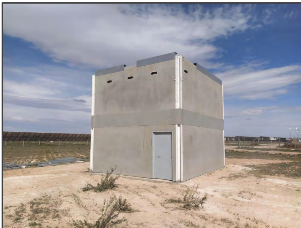
Fotografía 9. Exterior del primillar de nueva construcción.