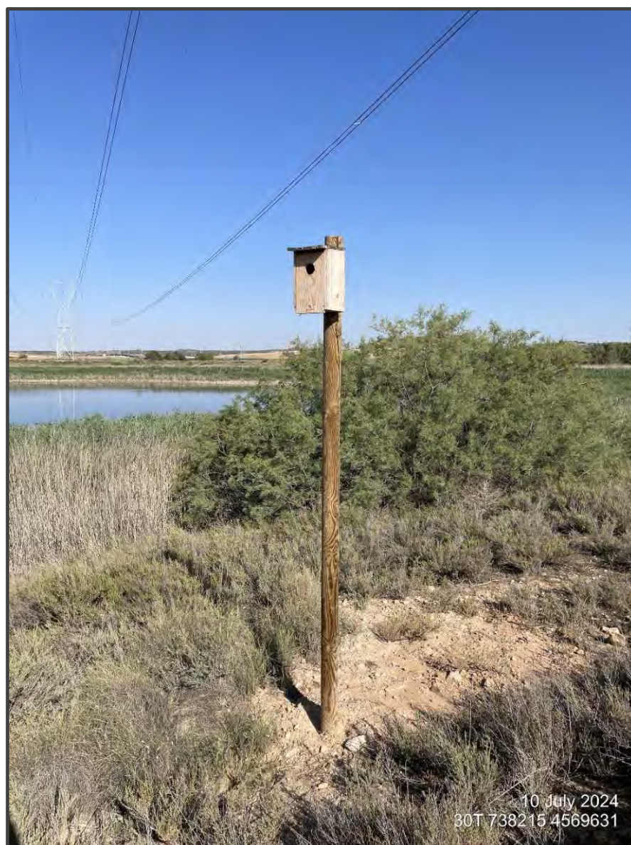
Fotografía 18. Caja para carraca junto a Hoya de Blase.