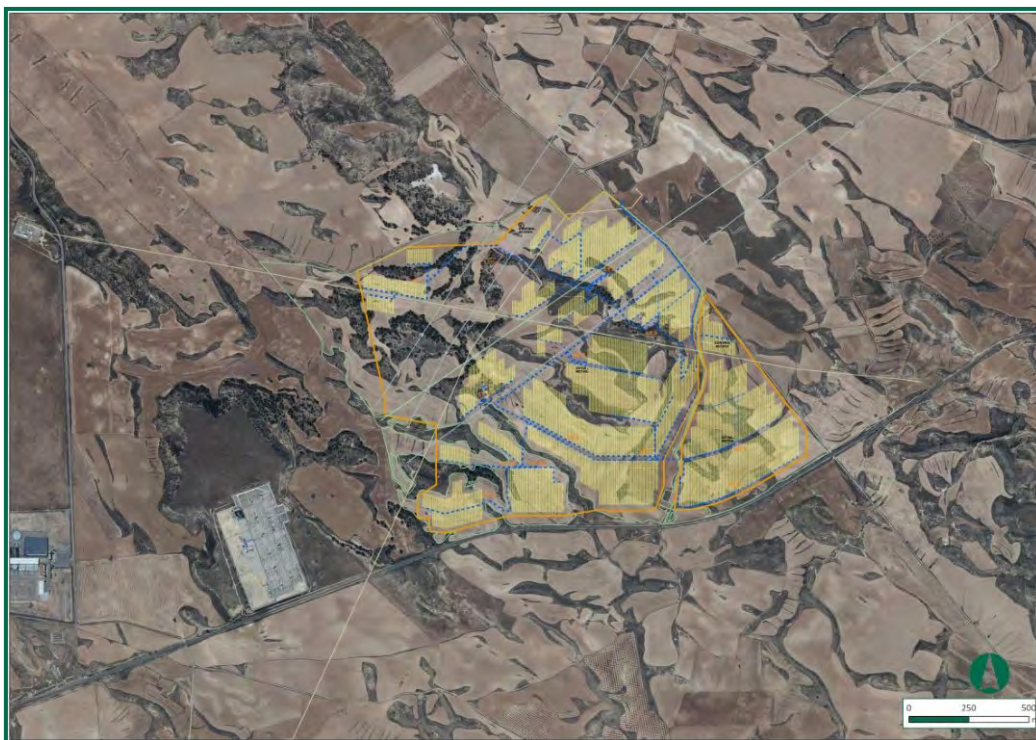
Figura 2. Localización de la zona de estudio.

La Planta FV proyectada por MEDIOMONTE SOLAR se extiende por un conjunto de parcelas, todas ellas pertenecientes al municipio de Escatrón, contiguas unas con otras y que suman una superficie total aproximada de 181,55 Ha, cuyo uso y calificación previa era agrícola.