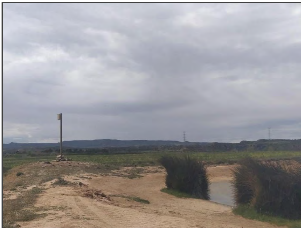
Fotografía 26. Caja para carraca, sobre poste.