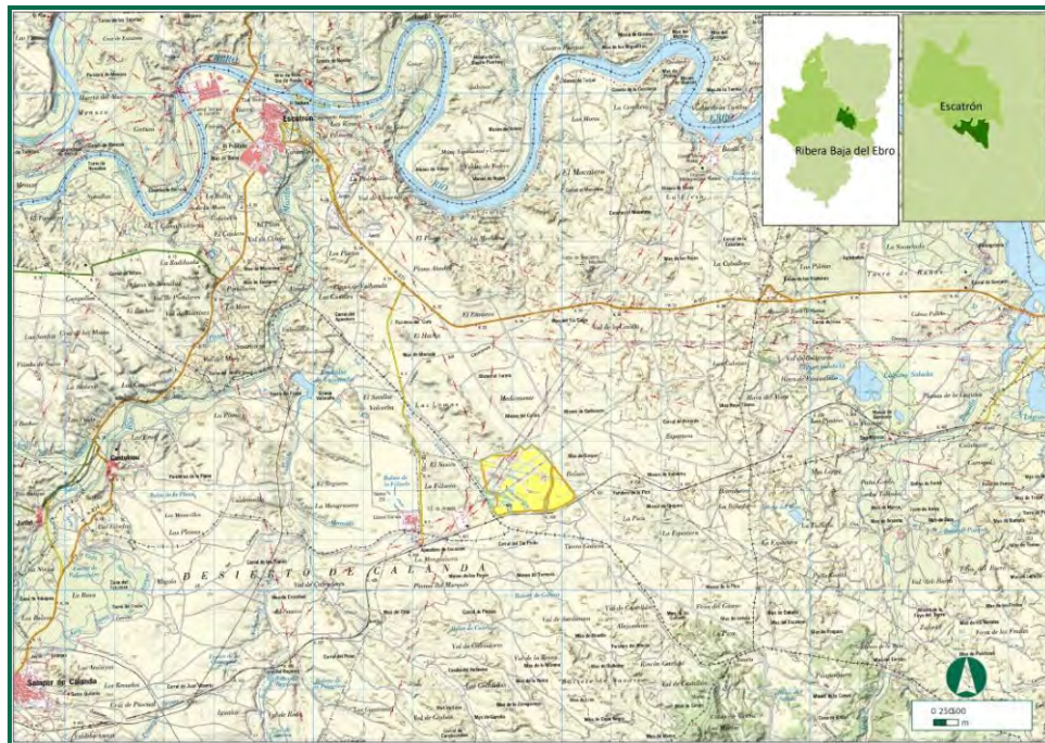
Figura 1. Ámbito de estudio.

La zona de implantación de la planta fotovoltaica “Mediomonte Solar”, se encuentra en el municipio de Escatrón, en la Comarca Ribera Baja del Ebro, en la provincia de Zaragoza. En concreto se sitúa en la hoja nº 441 “Híjar”, a escala 1:50.000 del Mapa Topográfico Nacional de España. La cuadrícula UTM 10x10 km en la que se incluye es la 30TYL26 y 30TYL36.