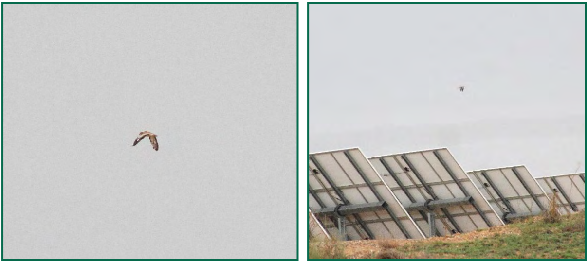
Fotografías 7 y 8. Alcaravanes sobre fotovoltaica.

Respecto a aves de pequeño tamaño, sobre las propias placas fotovoltaicas se observan fringílicos, en especial jilgueros, junto con pardillos en la mayoría de los casos y verdicillos, también se observan con asiduidad lavanderas blancas, escribanos trigueros, estorninos y gorriones, alcaudones, varias especies de sílvicos en las zonas de matorral.