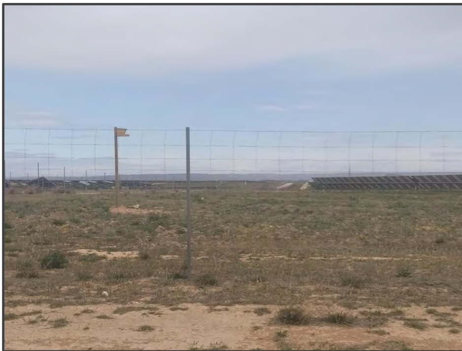
Fotografía 24. Caja para rapaces, sobre poste.