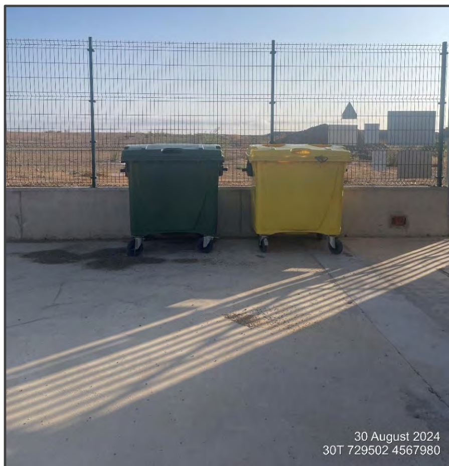
Fotografía 32. Contenedores de residuos.