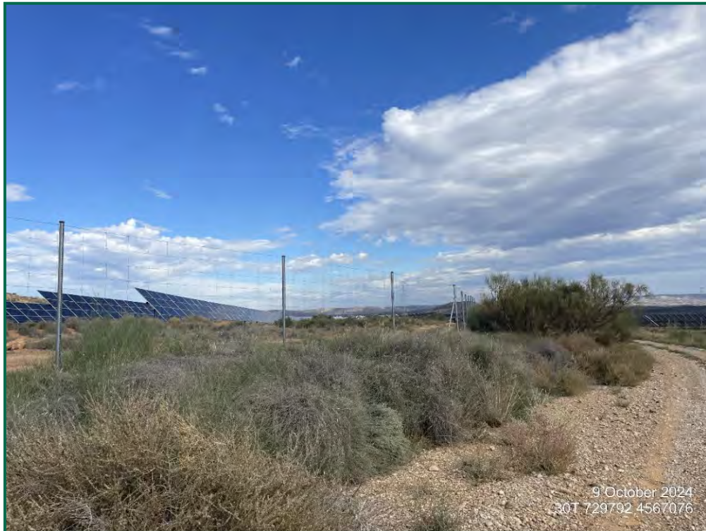
Fotografía 6. Vallado perimetral.

Con objeto de realizar un seguimiento de fauna se han realizado las siguientes acciones: