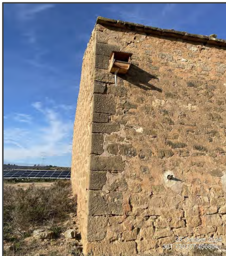
Fotografía 29. Caja para rapaces, sobre muro.