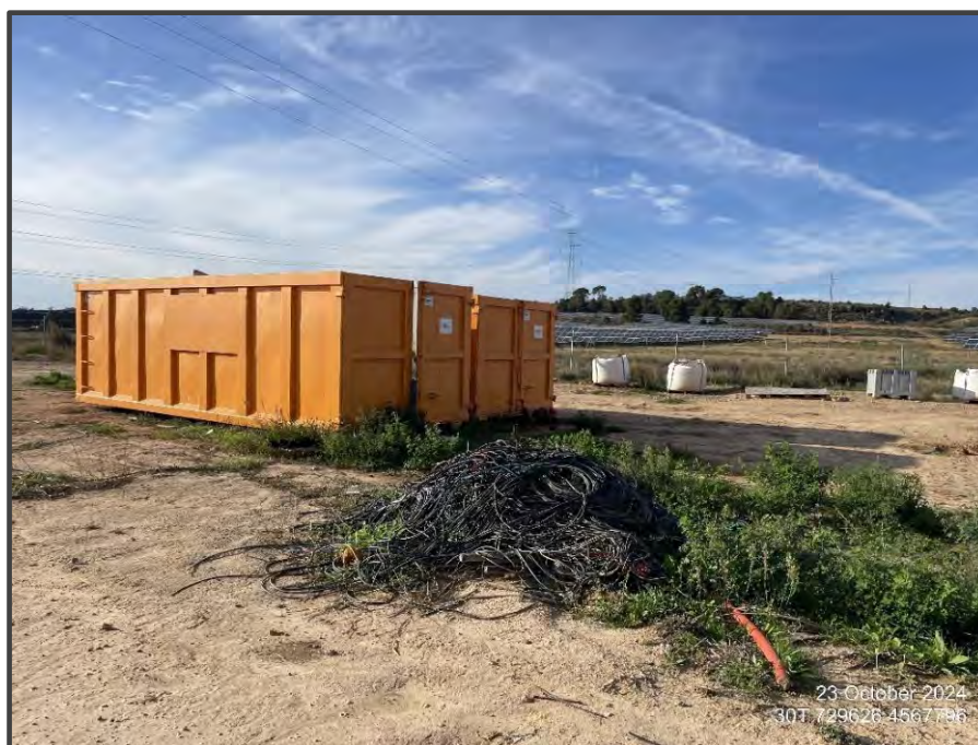
Fotografía 33. Zona de acopio de placas solares deterioradas