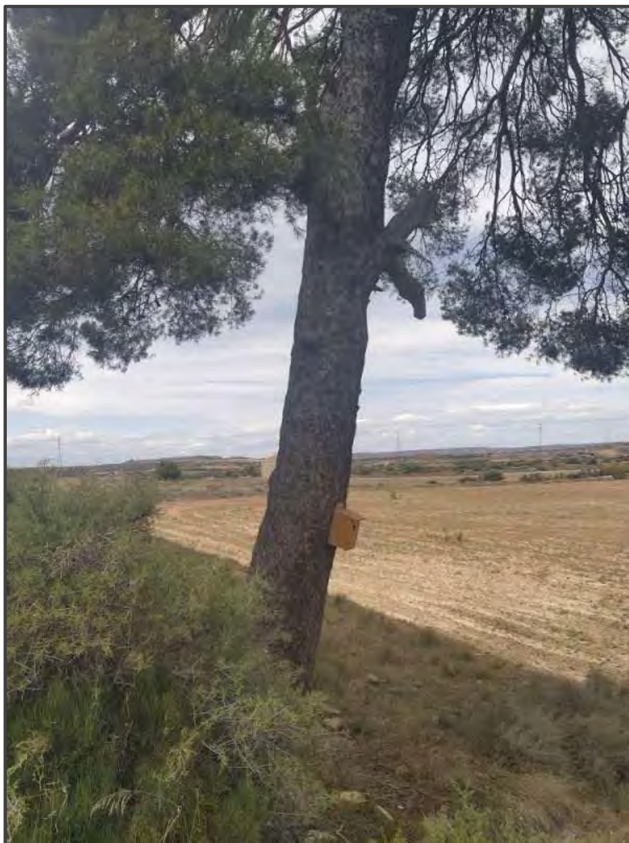
Fotografía 17. Caja para carraca sobre árbol.