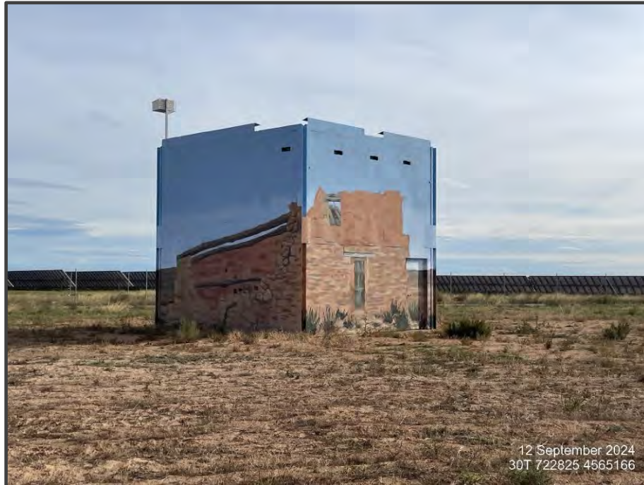
Fotografía 11. Exterior del primillar, pintado.

El pasado año se pintó el exterior de este primillar, para mejorar su integración paisajística en el entorno.