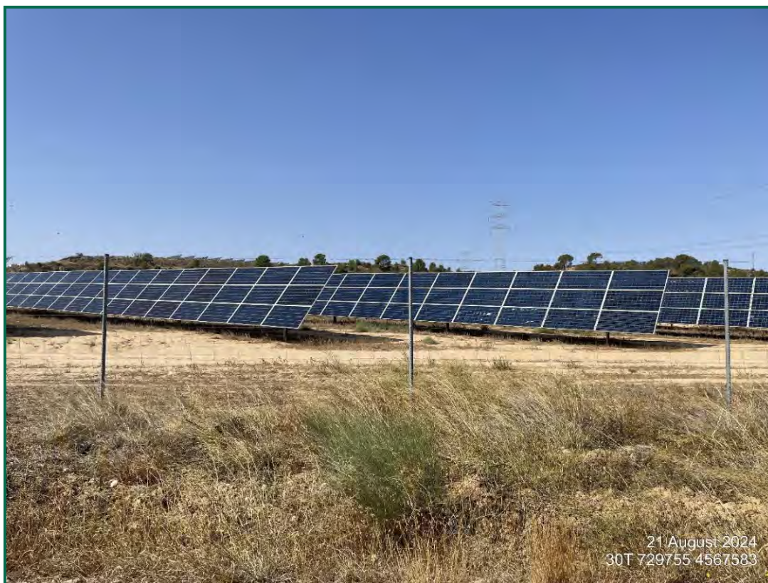
Fotografía 4. Zona revegetada.