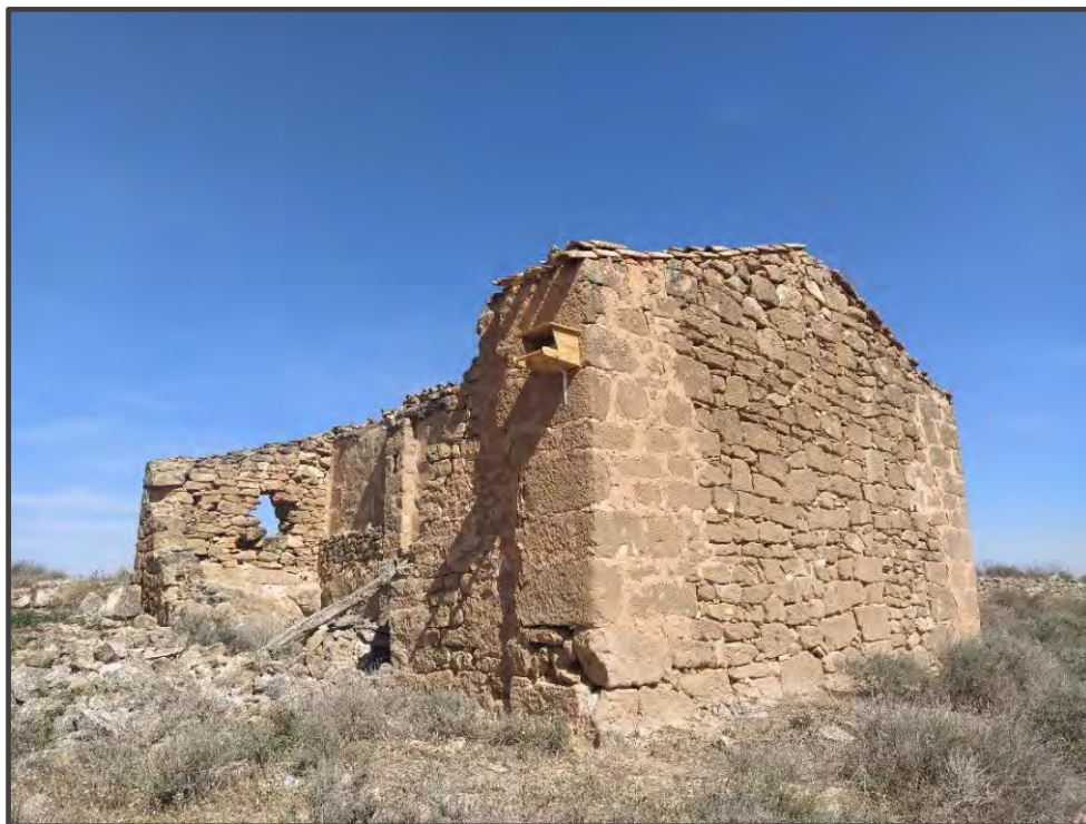
Fotografía 30. Caja para rapaces, sobre muro.