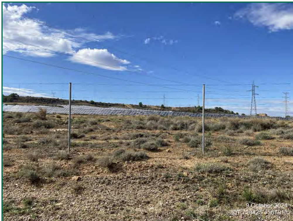
Fotografía 5. Vallado perimetral.

Respecto al vallado perimetral, se ha utilizado en todas las plantas malla cinegética que permite el paso de fauna de pequeño tamaño. Este vallado mide 2 metros de altura total y está formado por una serie de alambres verticales y horizontales, con una separación entre los verticales de 30cm, y entre los horizontales de mínimo 15cm en la línea inferior. Este vallado no presenta elementos cortantes ni punzantes.