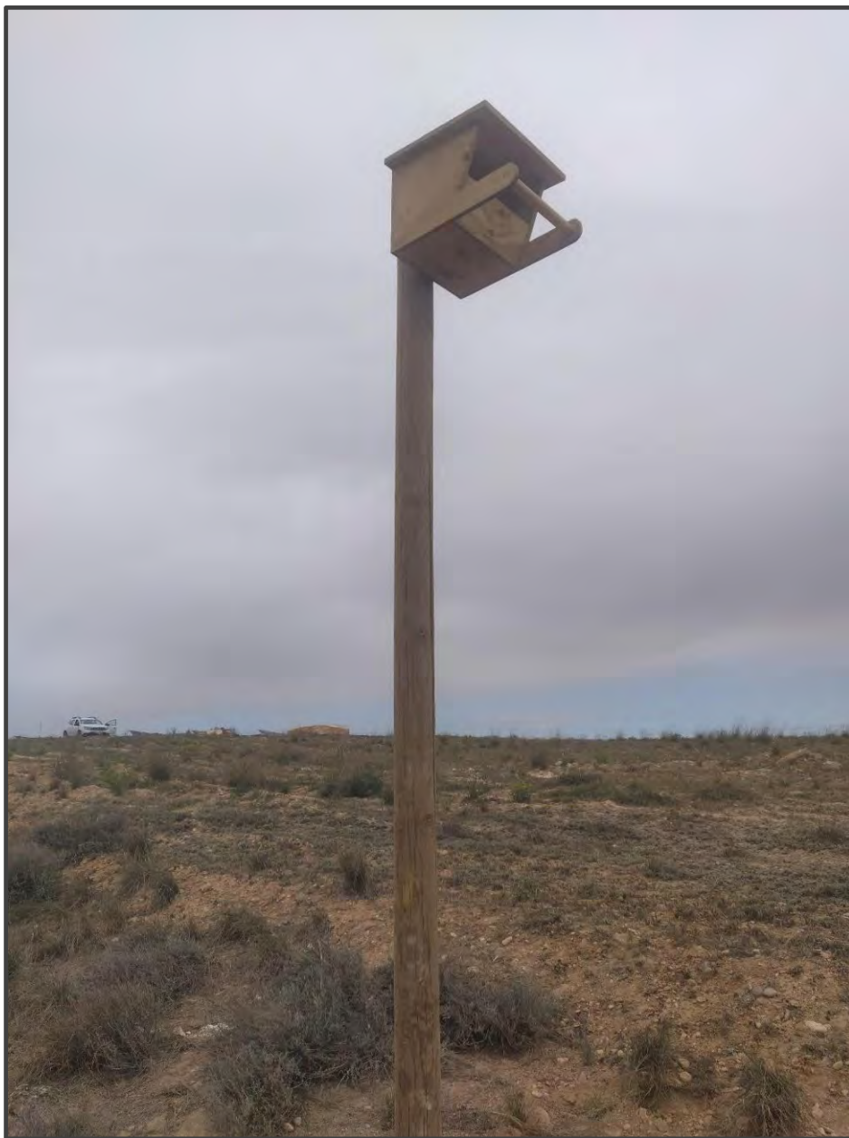
Fotografía 23. Caja para rapaces, sobre poste.