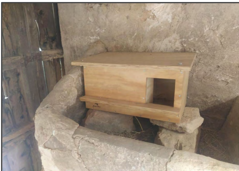
Fotografía 16. Caja para lechuza/rapaz nocturna en el interior de construcción.