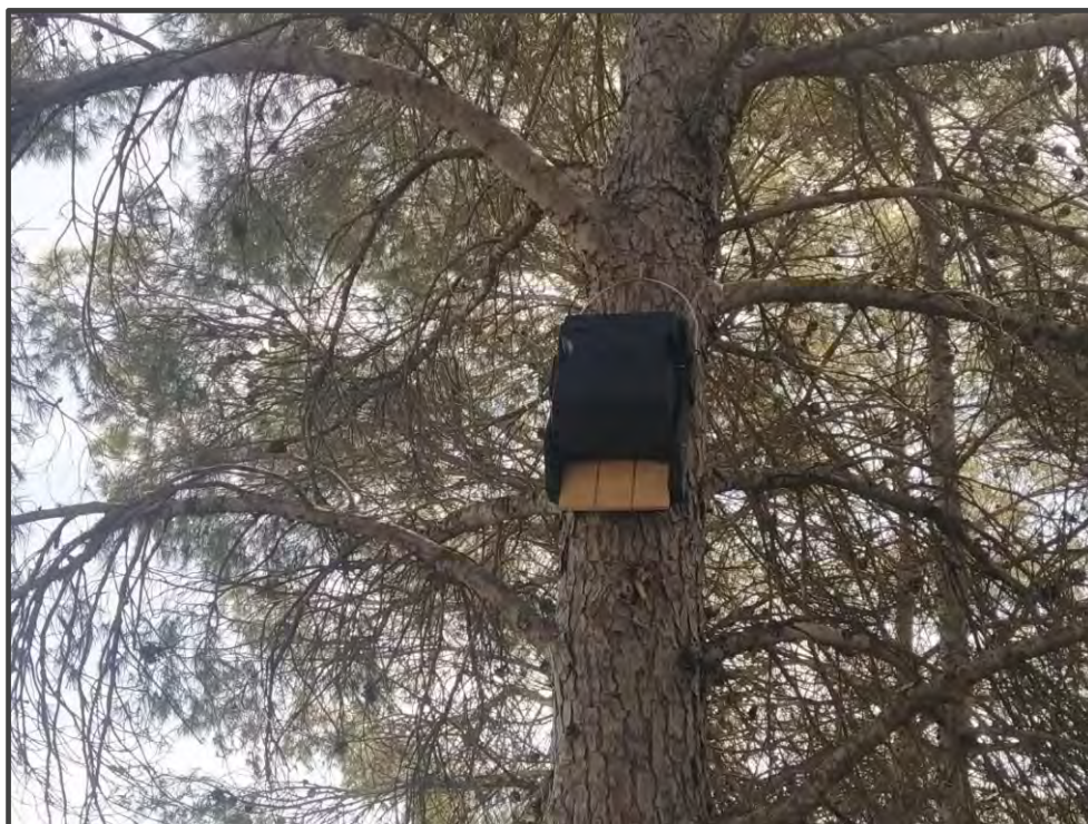
Fotografía 21. Caja para colonia de quirópteros.