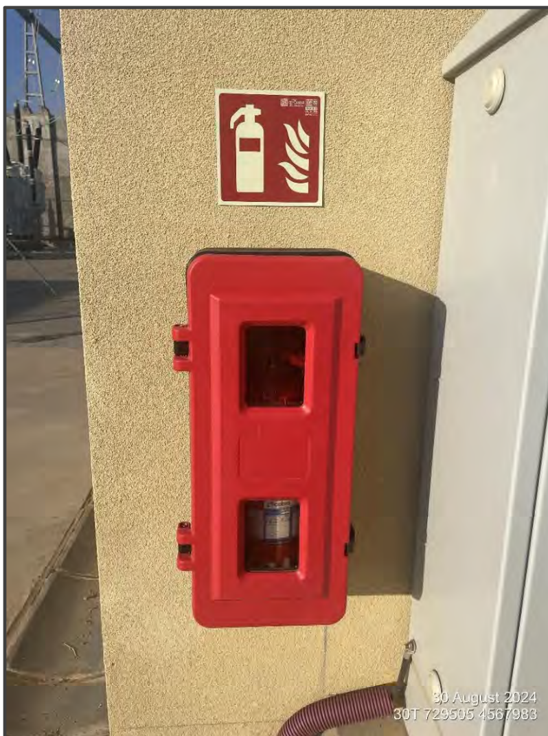
Fotografía 34. Extintores en edificio de control.