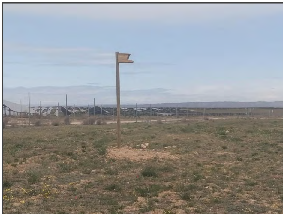
Fotografía 25. Caja para rapaces, sobre poste.