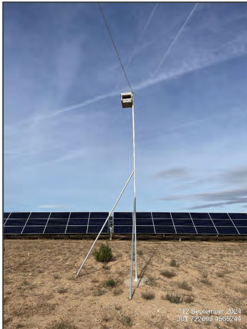
Fotografía 13. Caja para cernícalo primilla, sobre poste.

También se ha contado con la colaboración de la Fundación Internacional para la restauración de ecosistemas (FIRE) para la colocación de cajas nido y la renaturalización de diferentes zonas en el interior de las fotovoltaicas, las especies objetivo son lechuza, cernícalo, carraca y quirópteros. En el mes de abril se colocaron estas cajas nido repartidas por los hábitats considerados más adecuados para cada una de ellas, instalando en total de 21 cajas de madera para rapaces, la mayor parte de ellas colocadas en construcciones ya existentes en el interior de las plantas solares, y 5 de ellas sobre postes de nueva colocación. Estas cajas para rapaces pueden ser utilizadas especialmente por lechuza y por cernícalo vulgar. También se han instalado 9 cajas para quirópteros, adecuadas para albergar colonias y agrupadas en tres zonas con presencia de pinos y 4 cajas para carraca europea, una de ellas sobre árbol y 3 sobre poste.