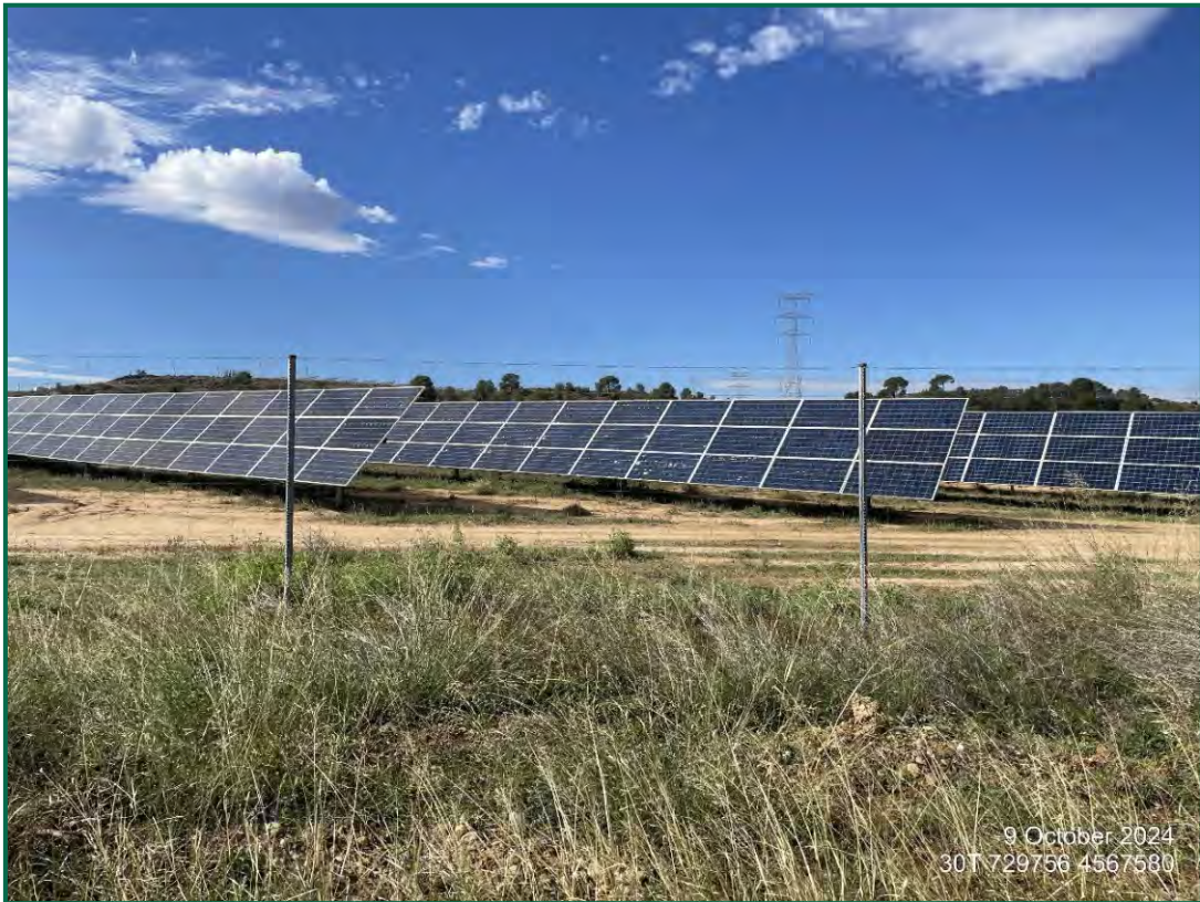
Fotografía 2. Vegetación entre placas actualmente.

Se ha realizado un seguimiento de la evolución de las revegetaciones realizadas durante los meses de invierno de 2020. Estas plantas se desarrollan, aunque se ha observado la desaparición de ejemplares. Durante la primavera se produce un desarrollo de la vegetación espontánea de la zona, que en ocasiones compite con la vegetación plantada. En todo caso esta proliferación vegetal contribuye a evitar la erosión.