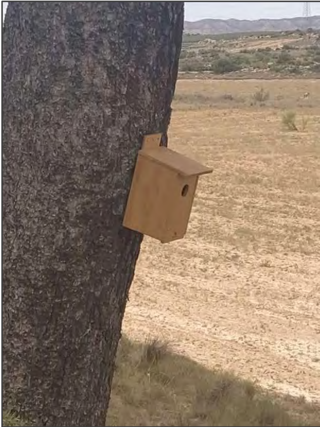
Fotografía 31. Caja para carraca, sobre árbol.

La empresa que en la actualidad es propietaria y gestora de las Plantas fotovoltaicas está diseñando, adicionalmente a las medidas ya implantadas, y en colaboración con el área de Ecología de la Universidad de Zaragoza, un plan que desarrolle la forma más apropiada de implementar nuevas medidas, para lo cual se está realizando un estudio previo del medio, que incluye