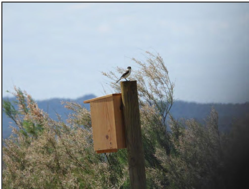
Fotografía 19. Caja para carraca con collalba posada.