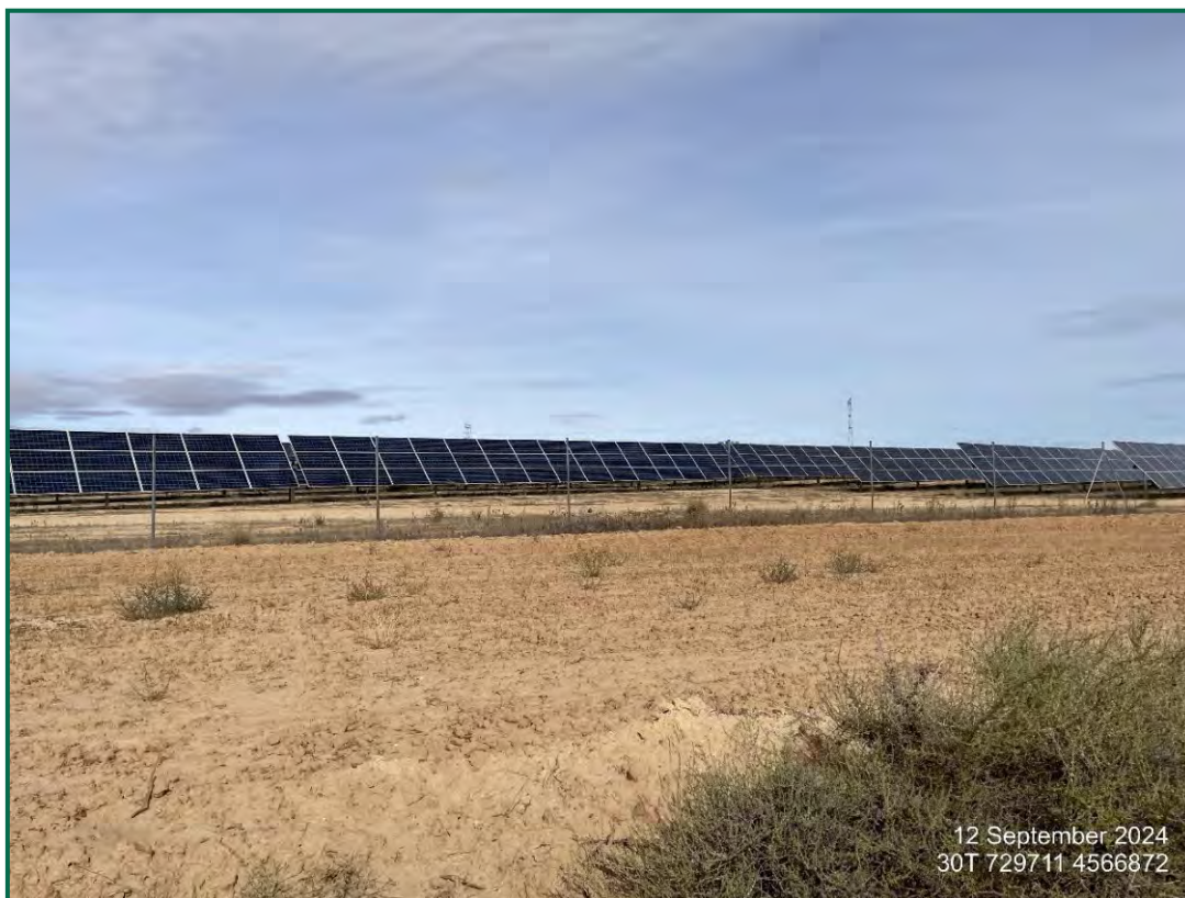
Fotografía 3. Zona revegetada recientemente.