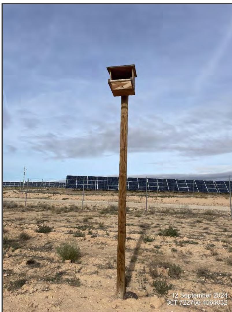
Fotografía 14. Caja para rapaces, sobre poste.