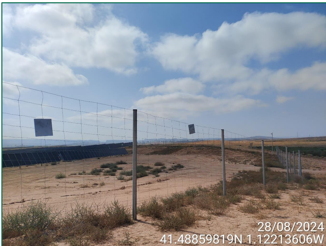
Fotografía 1. Vallado perimetral.

El vallado se ha visto afectado en algunas zonas por los episodios de fuertes vientos que se han producido en la zona. Estos vientos han arrastrado plantas rodadoras del entorno, que al encontrar el vallado como obstáculo se acumularon provocando la rotura de este en varios puntos. Ya se han reparando las zonas afectadas utilizando postes reforzados de mayor grosor.