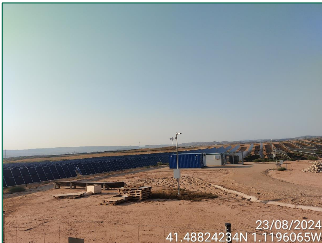
Fotografía 7. Zonas de acumulación de agua.