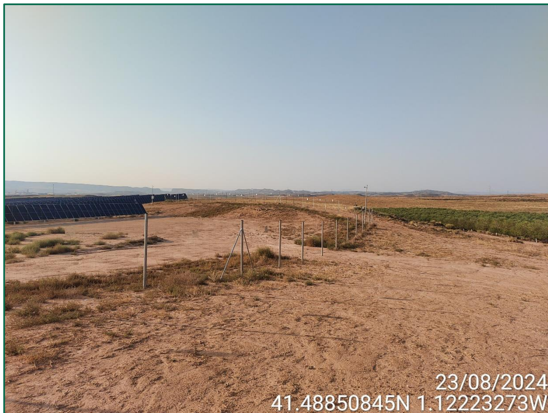
Fotografía 2. Vallado perimentral.