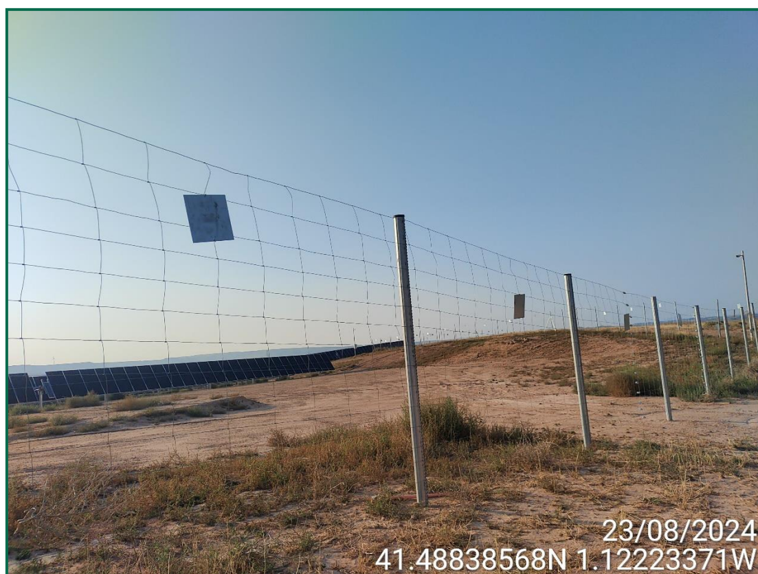
Fotografía 9. Placas anticolidión.

El vallado perimetral ya se ha instalado, utilizando malla cinéctica y dejando un espacio de al menos 20 cm desde el suelo, también se han colocado las placas anticolidión, dispuestas una por vano entre postes a diferentes alturas.