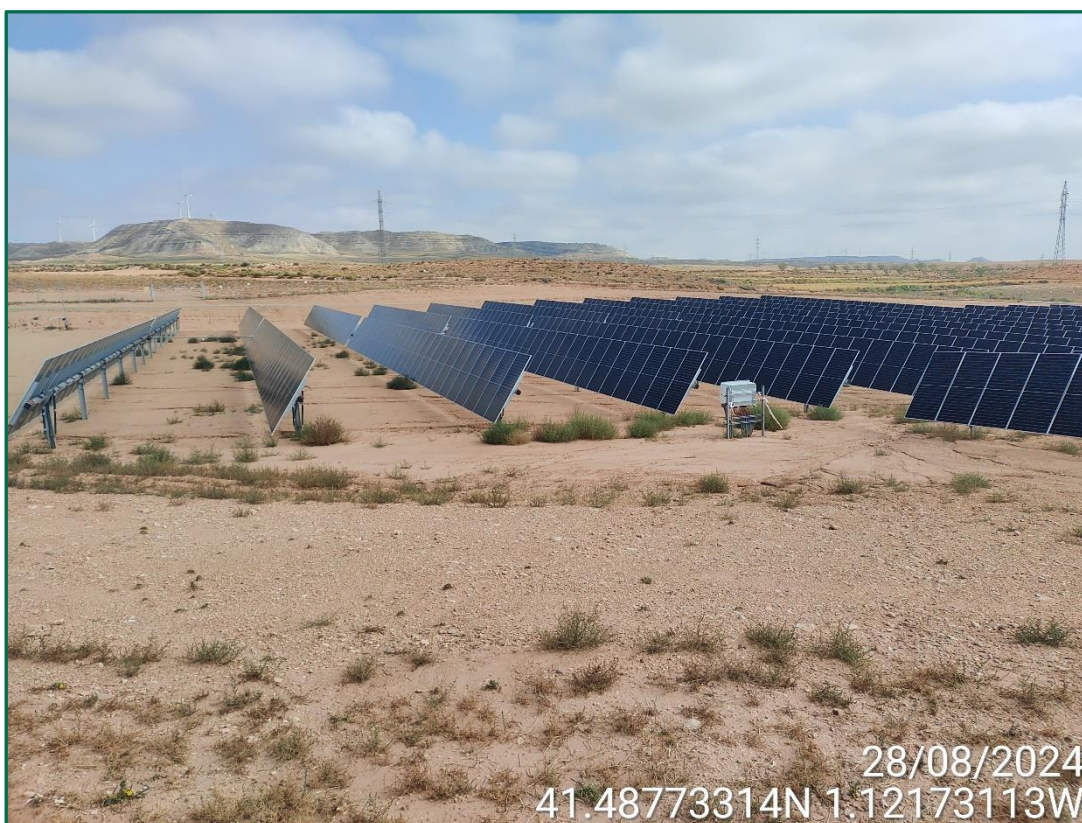
Fotografía 5. Erosión entre las placas fotovoltaicas.