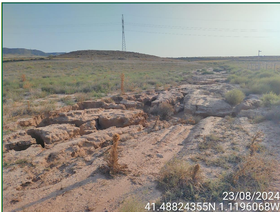
Fotografía 4. Erosión