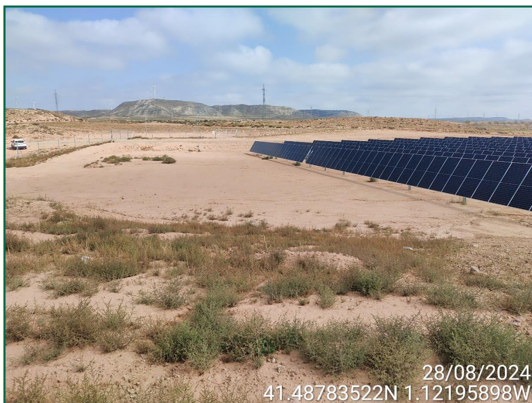
Fotografía 10. Zona de casetas y residuos ya desmantelada.

Los contenedores de residuos y el punto limpio ya han sido desmantelados y retirados por gestor autorizado. Se han dejado en obra dos bidones vacíos por si fuera necesario.