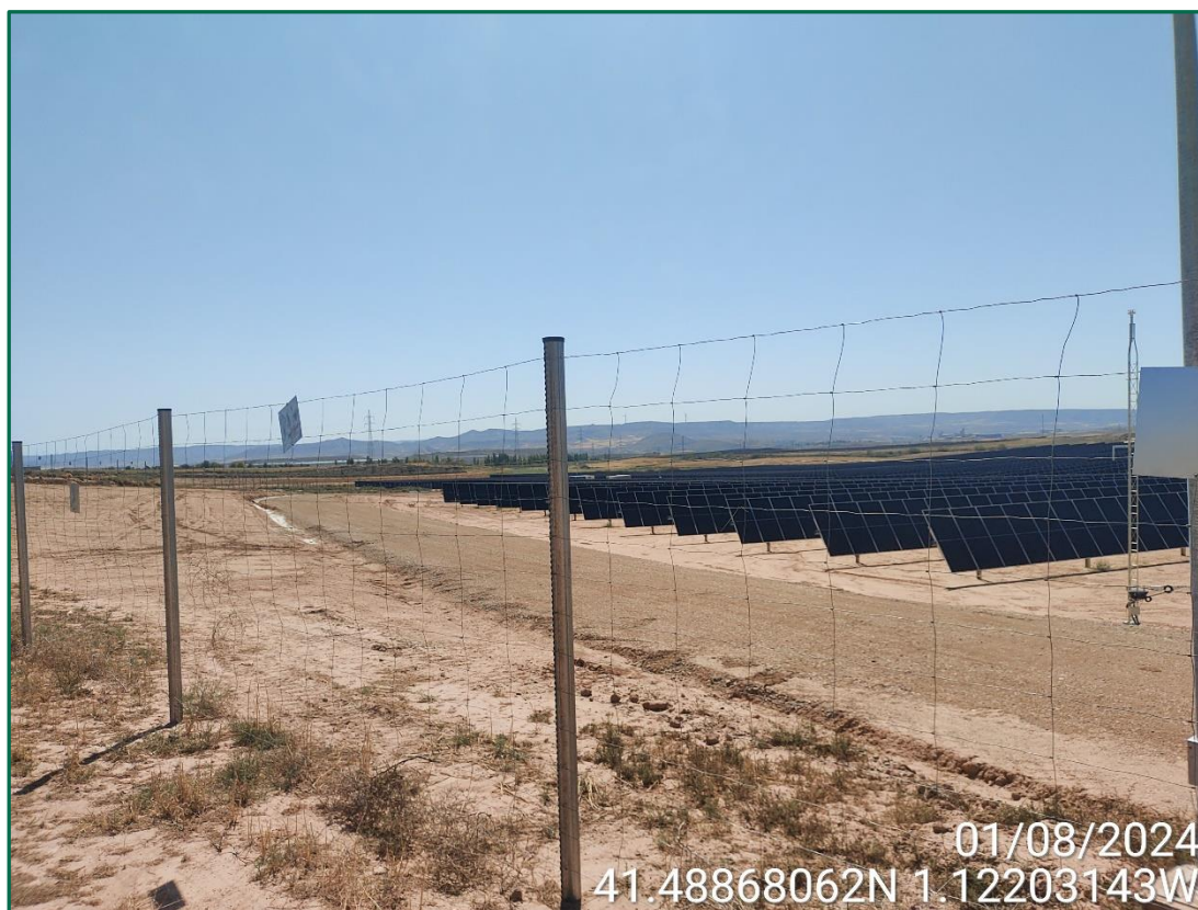
Fotografía 3. Vallado perimentral.