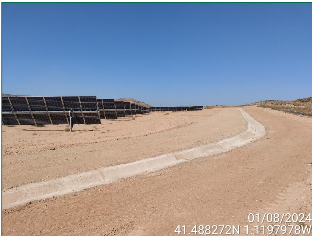
Fotografía 6. Vial