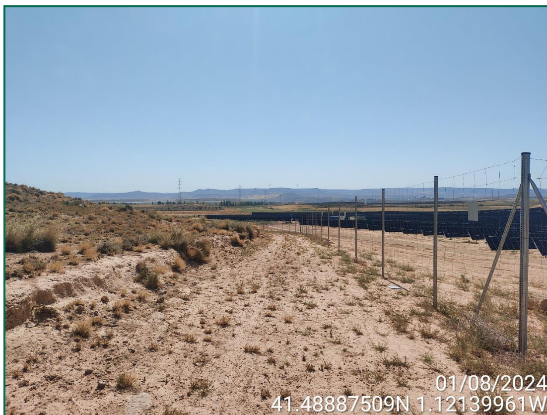
Fotografía 8. Cobertura vegetal colindante a la planta.

Durante las visitas a obra se realiza el seguimiento que la ocupación se limita a lo aprobado en el proyecto. Se verifica también que la maquinaria circula únicamente por los viales habilitados para tal fin.