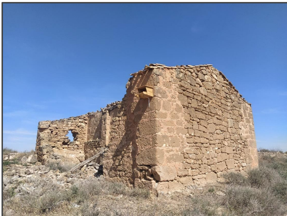
Fotografía 20. Caja para rapaces, sobre muro.