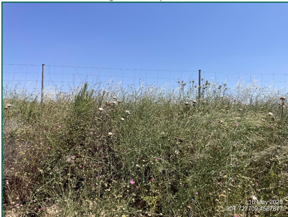
Fotografía 5. Vallado perimetral.

Con objeto de realizar un seguimiento de fauna se han realizado las siguientes acciones: