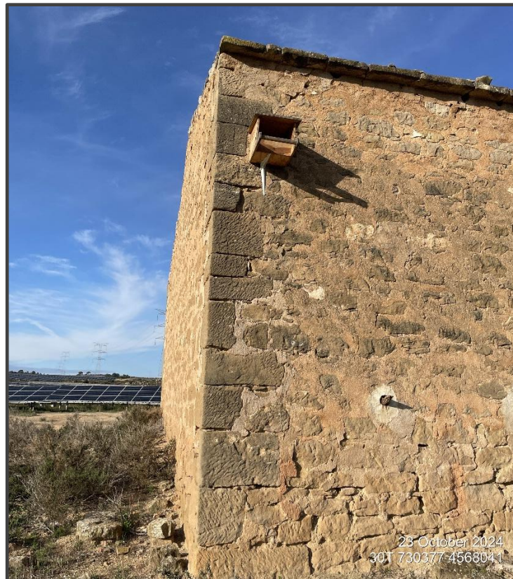
Fotografía 19. Caja para rapaces, sobre muro.