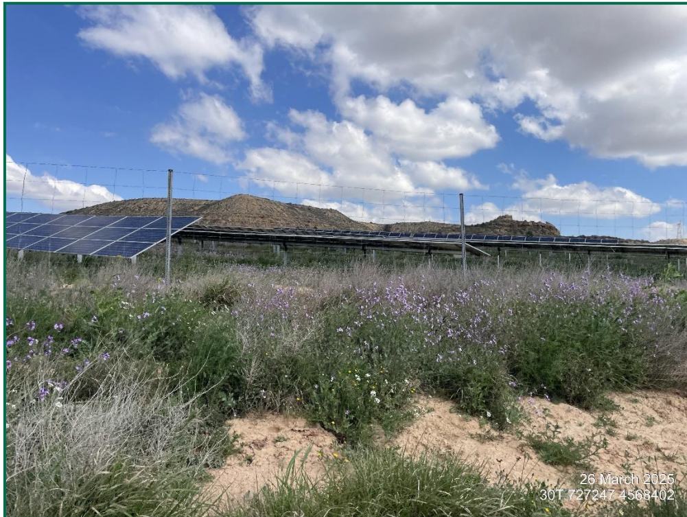
Fotografía 4. Vallado perimetral.