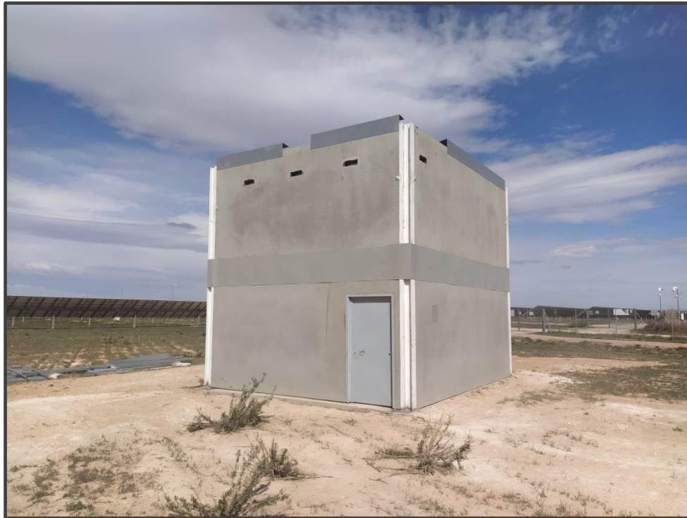
Fotografía 6. Exterior del primillar de nueva construcción.