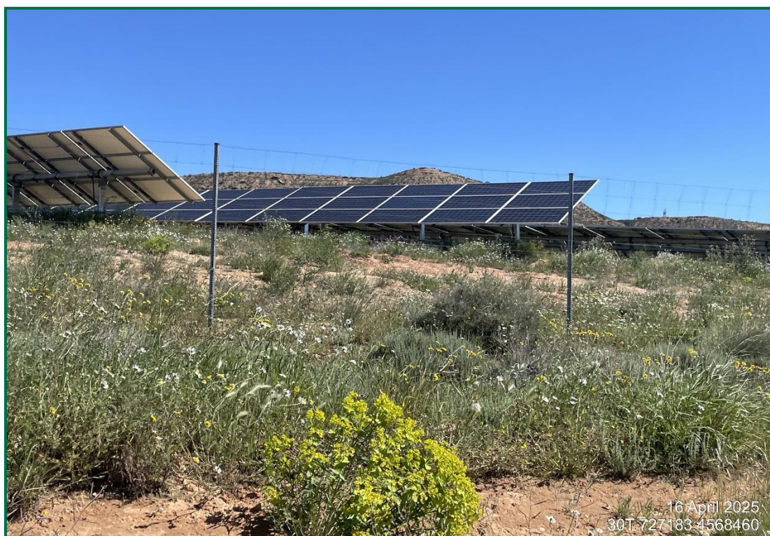
Fotografía 2. Vegetación entre placas actualmente.

Se ha realizado un seguimiento de la evolución de las revegetaciones realizadas durante los meses de invierno de 2020. Estas plantas se desarrollan, aunque se ha observado la desaparición de ejemplares. Durante la primavera se produce un desarrollo de la vegetación espontánea de la zona, que en ocasiones compite con la vegetación plantada. En todo caso esta proliferación vegetal contribuye a evitar la erosión.