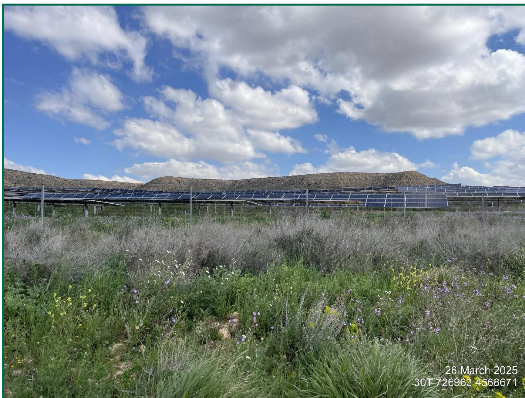
Fotografía 3. Zona revegetada.