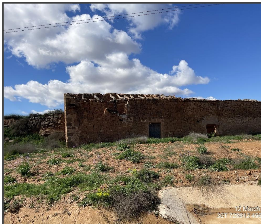
Fotografía 13. Caja para rapaz sobre construcción.