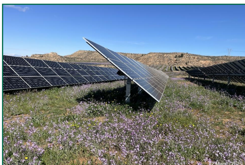
Fotografía 1. Vegetación entre placas actualmente.

En el periodo que abarca este informe se ha introducido ganado ovino en todas las plantas solares con objeto de recortar esta vegetación, a la vez que aportan nutrientes al suelo. No se han utilizado herbicidas.