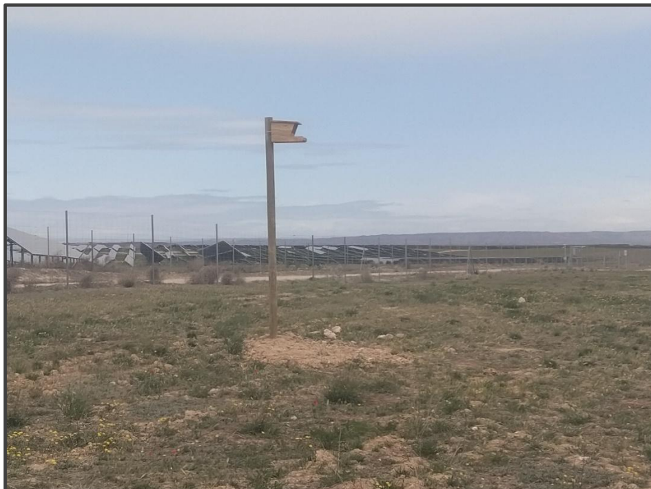
Fotografía 22. Caja para rapaces, sobre poste.