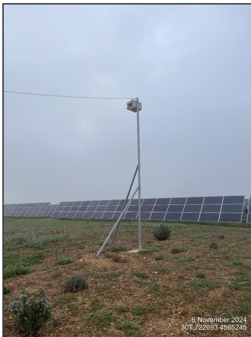
Fotografía 10. Caja para cernícalo primilla, sobre poste.

También se ha contado con la colaboración de la Fundación Internacional para la restauración de ecosistemas (FIRE) para la colocación de cajas nido y la renaturalización de diferentes zonas en el interior de las fotovoltaicas, las especies objetivo son lechuza, cernícalo, carraca y quirópteros. En el mes de abril se colocaron estas cajas nido repartidas por los hábitats considerados más adecuados para cada una de ellas, instalando en total de 21 cajas de madera para rapaces, la mayor parte de ellas colocadas en construcciones ya existentes en el interior de las plantas solares, y 5 de ellas sobre postes de nueva colocación. Estas cajas para rapaces pueden ser utilizadas especialmente por lechuza y por cernícalo vulgar. También se han instalado 9 cajas para quirópteros, adecuadas para albergar colonias y agrupadas en tres zonas con presencia de pinos y 4 cajas para carraca europea, una de ellas sobre árbol y 3 sobre poste.