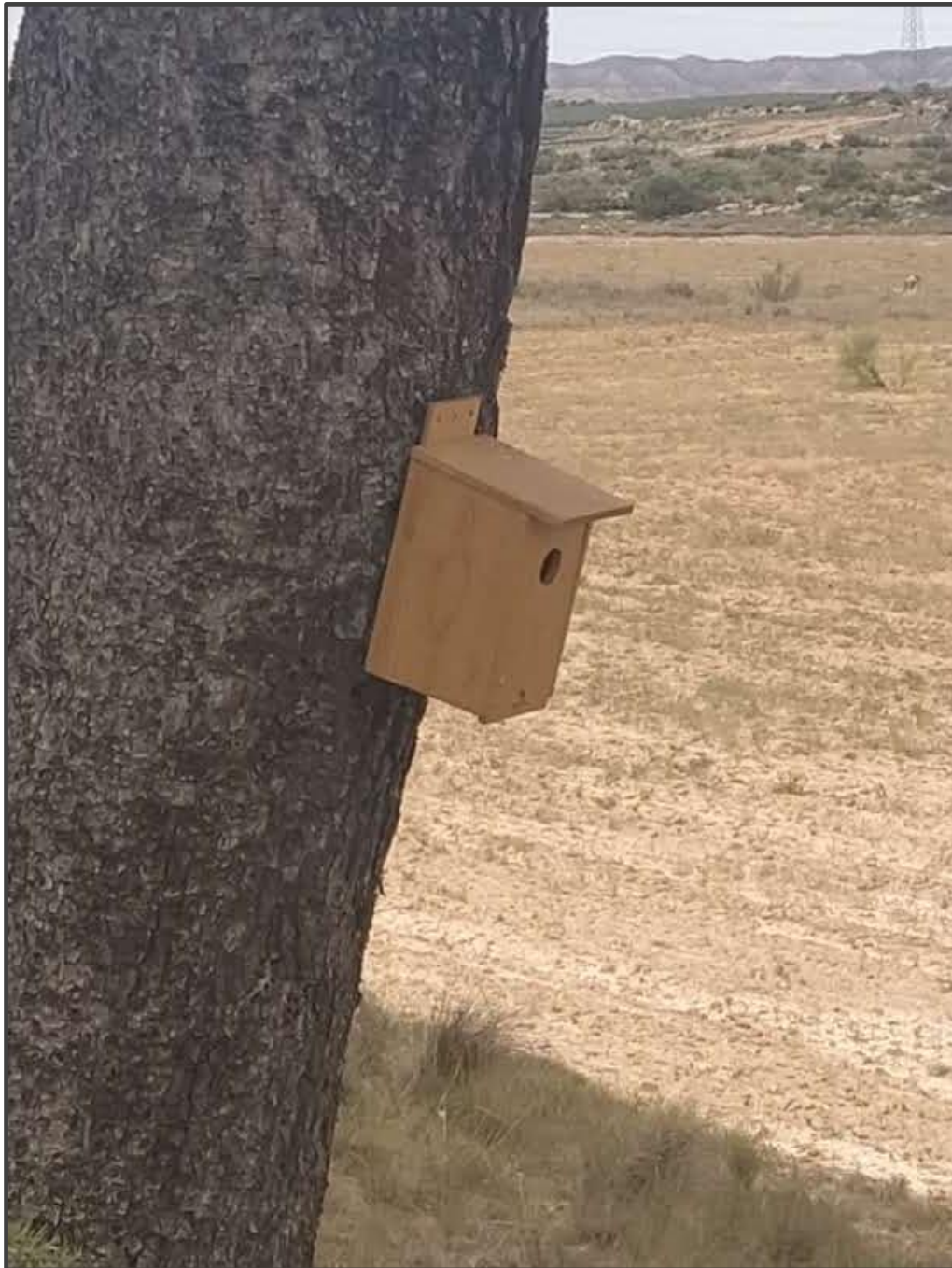
Fotografía 27. Caja para carraca, sobre árbol.