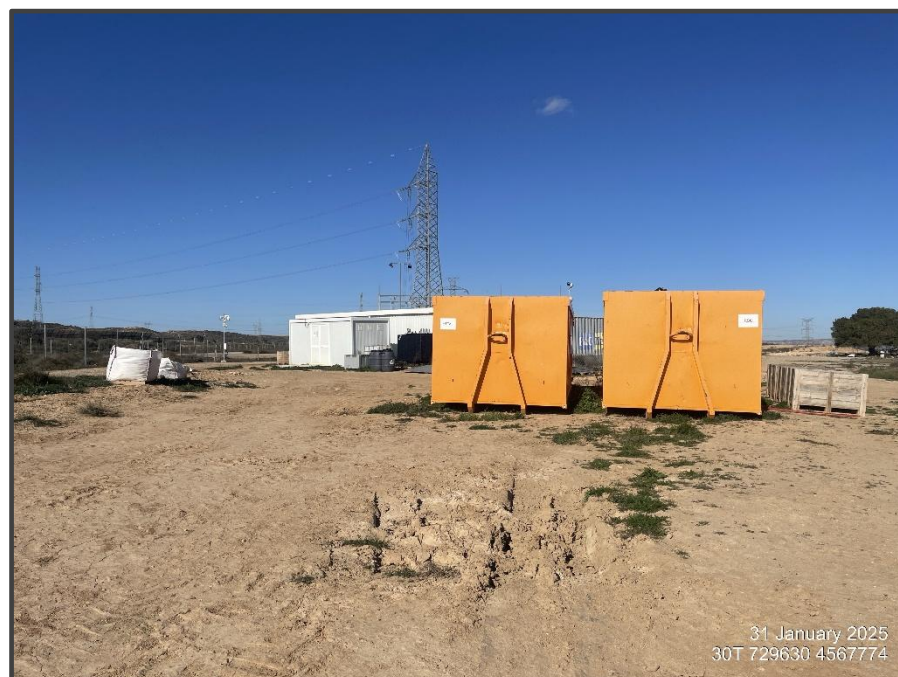
Fotografía 29. Zona de acopio de placas solares deterioradas.