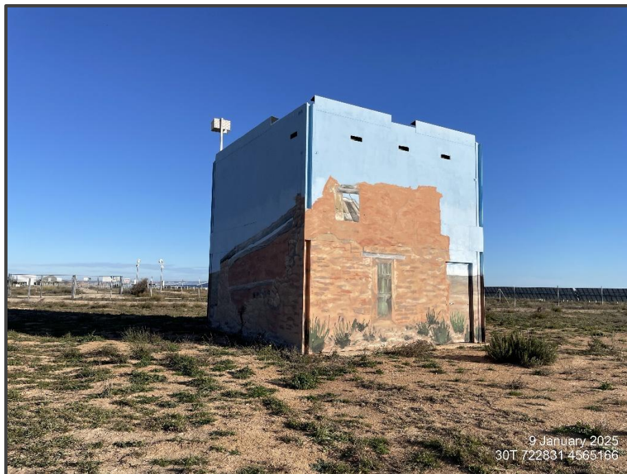
Fotografía 8. Exterior del primillar, pintado.