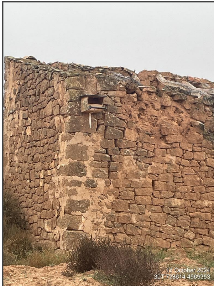
Fotografía 12. Caja para rapaz sobre construcción.