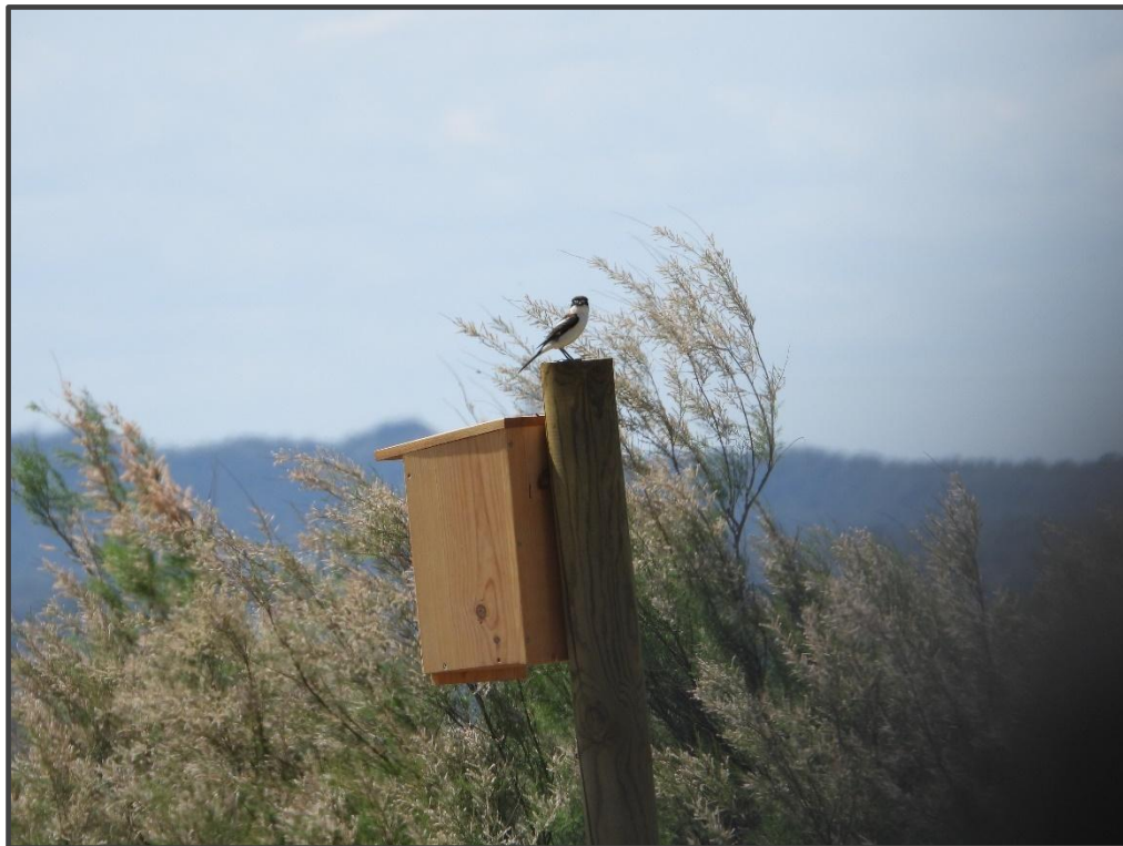
Fotografía 16. Caja para carraca con collalba posada.