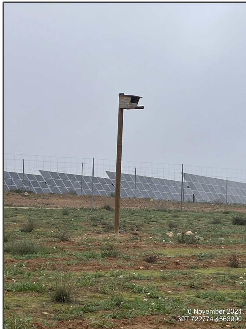
Fotografía 11. Caja para rapaces, sobre poste.