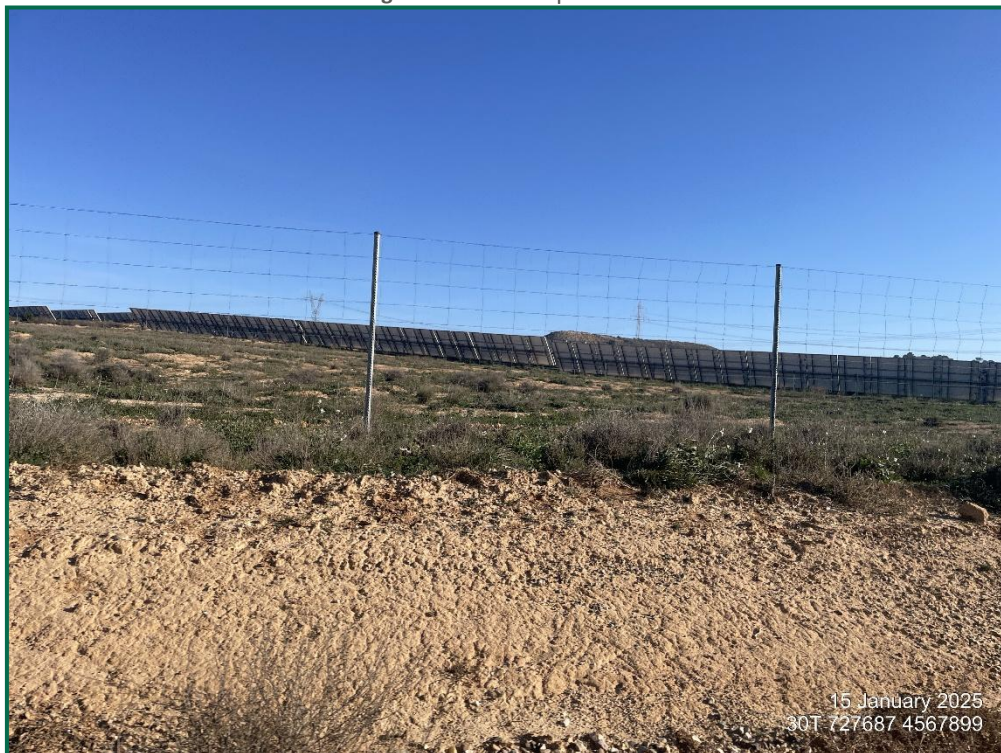
Fotografía 5. Vallado perimetral.

Con objeto de realizar un seguimiento de fauna se han realizado las siguientes acciones: