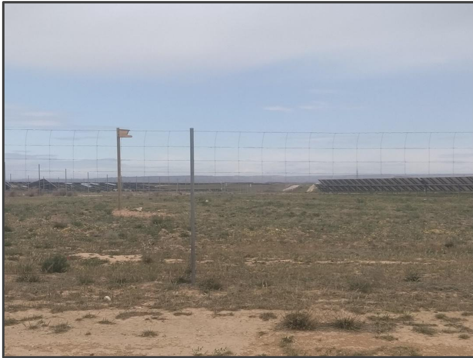
Fotografía 21. Caja para rapaces, sobre poste.