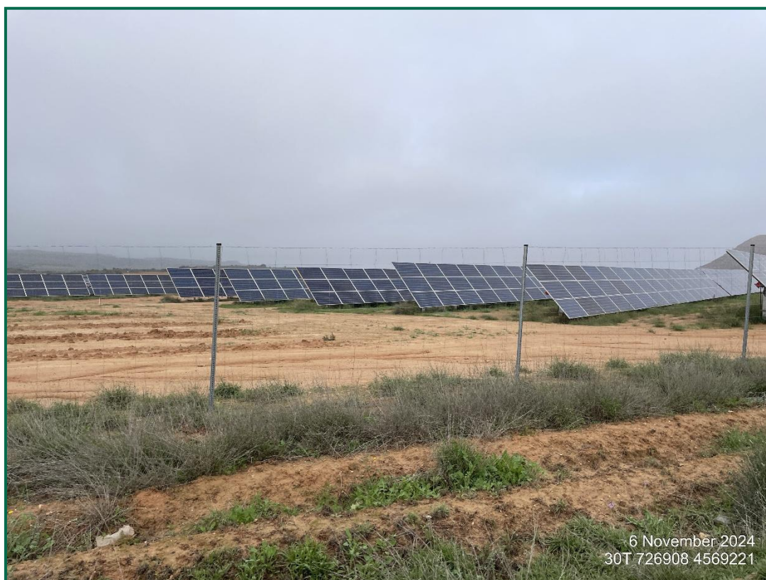
Fotografía 3. Zona revegetada.