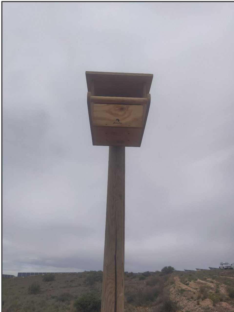
Fotografía 19. Caja para rapaces, sobre poste.