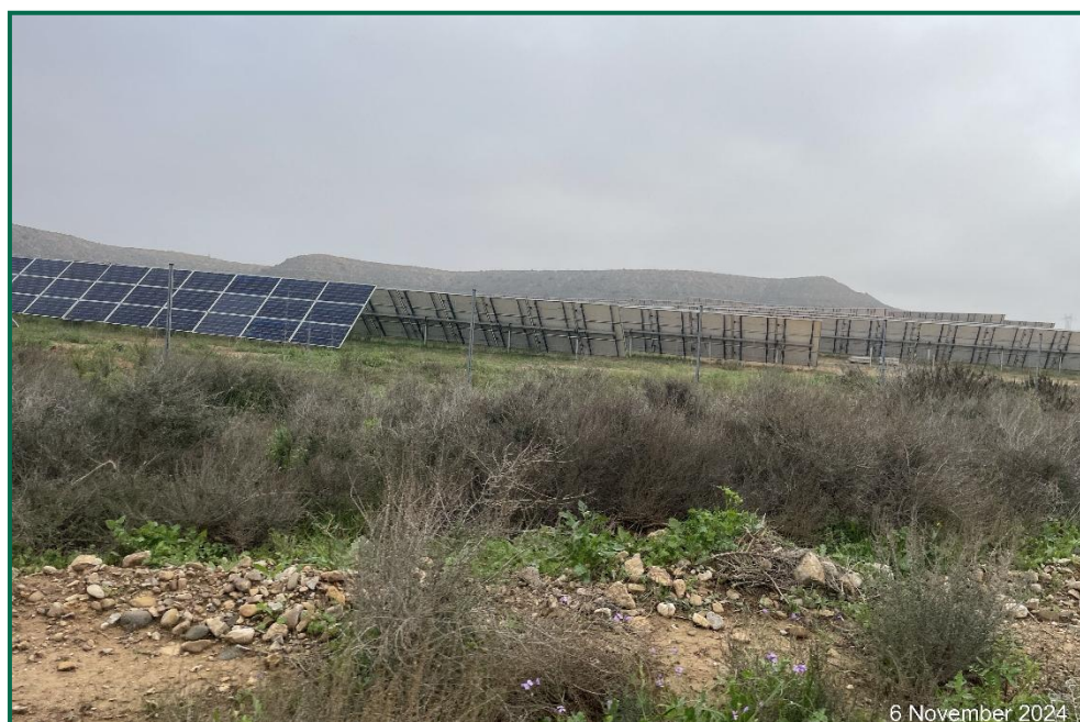
Fotografía 2. Vegetación plantada entre placas actualmente.

Se ha realizado un seguimiento de la evolución de las revegetaciones realizadas durante los meses de invierno de 2020. Estas plantas se desarrollan, aunque se ha observado la desaparición de ejemplares. Durante la primavera se produce un desarrollo de la vegetación espontánea de la zona, que en ocasiones compite con la vegetación plantada. En todo caso esta proliferación vegetal contribuye a evitar la erosión.