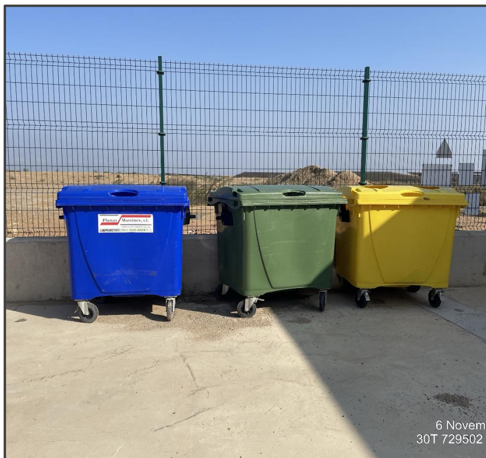
Fotografía 28. Contenedores de residuos.