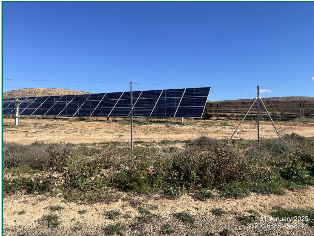
Fotografía 4. Vallado perimetral.