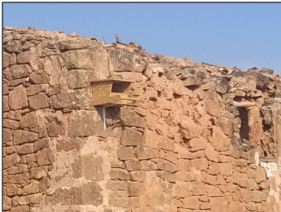
Fotografía 24. Caja para rapaces, sobre muro.