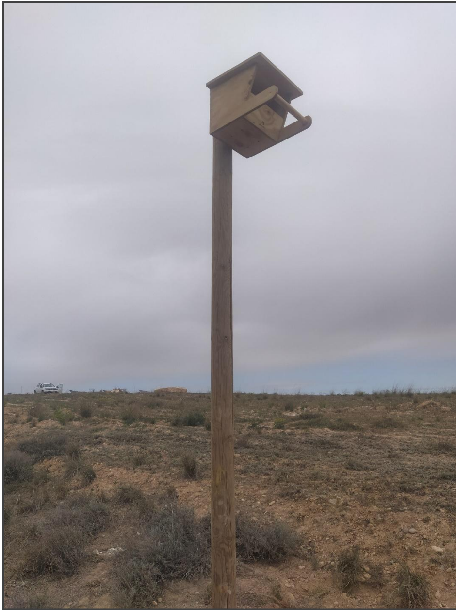
Fotografía 20. Caja para rapaces, sobre poste.