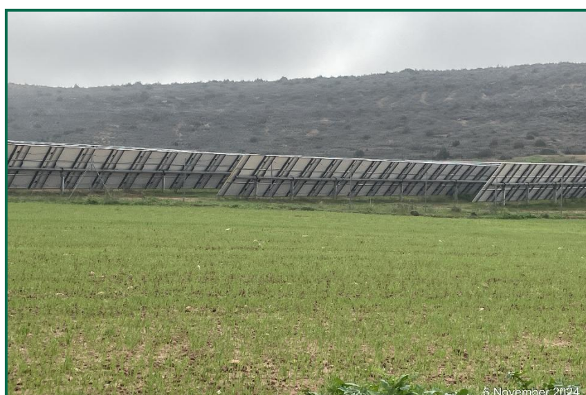
Fotografía 1. Vegetación entre placas actualmente.

En el periodo que abarca este informe se ha introducido ganado ovino en todas las plantas solares con objeto de recortar esta vegetación, a la vez que aportan nutrientes al suelo. No se han utilizado herbicidas.