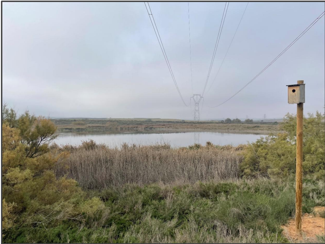
Fotografía 15. Caja para carraca junto a Hoya de Blase.