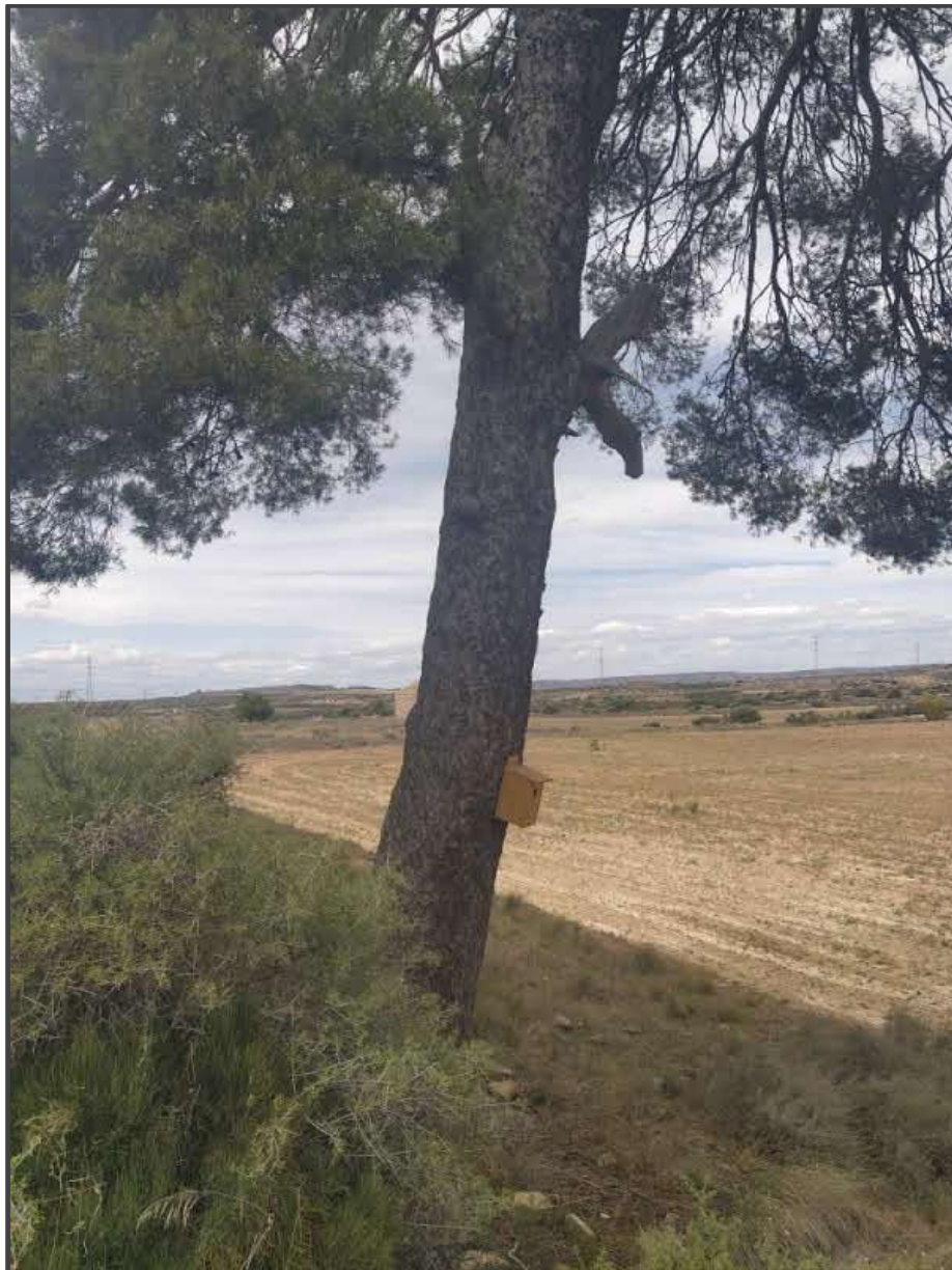
Fotografía 14. Caja para carraca sobre árbol.