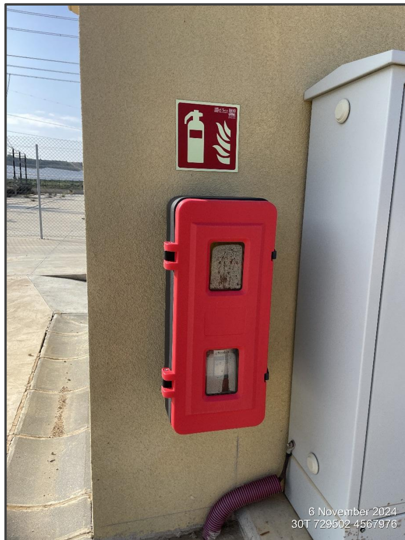
Fotografía 30. Extintores en edificio de control.

En las visitas se ha comprobado la disposición de equipos extintores de incendios en las instalaciones. Los extintores se encuentran ubicados en los edificios y en la Subestación.