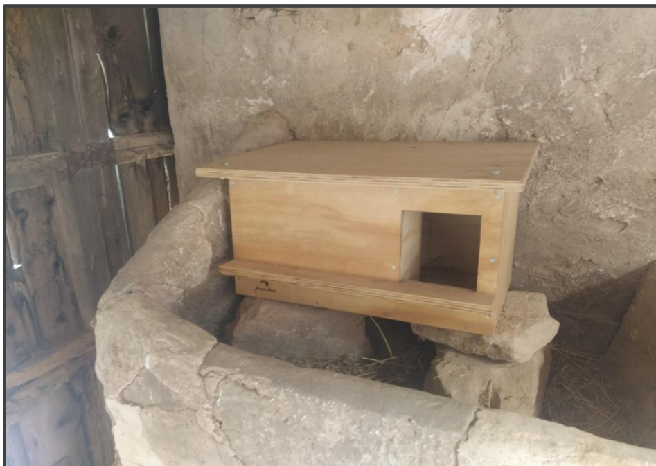
Fotografía 13. Caja para lechuza/rapaz nocturna en el interior de construcción.