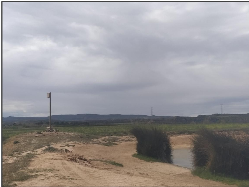
Fotografía 23. Caja para carraca, sobre poste.