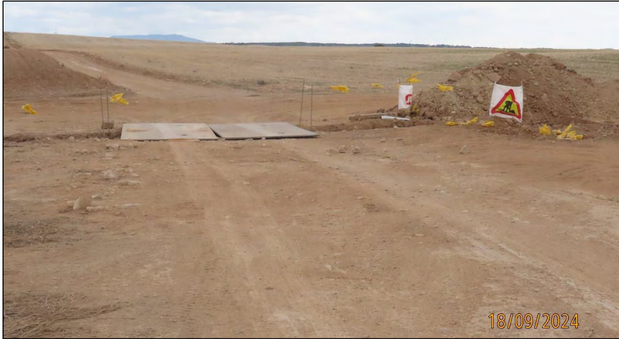
Ilustración 10. Reposición de camino afectado por la ejecución de la LSMT.