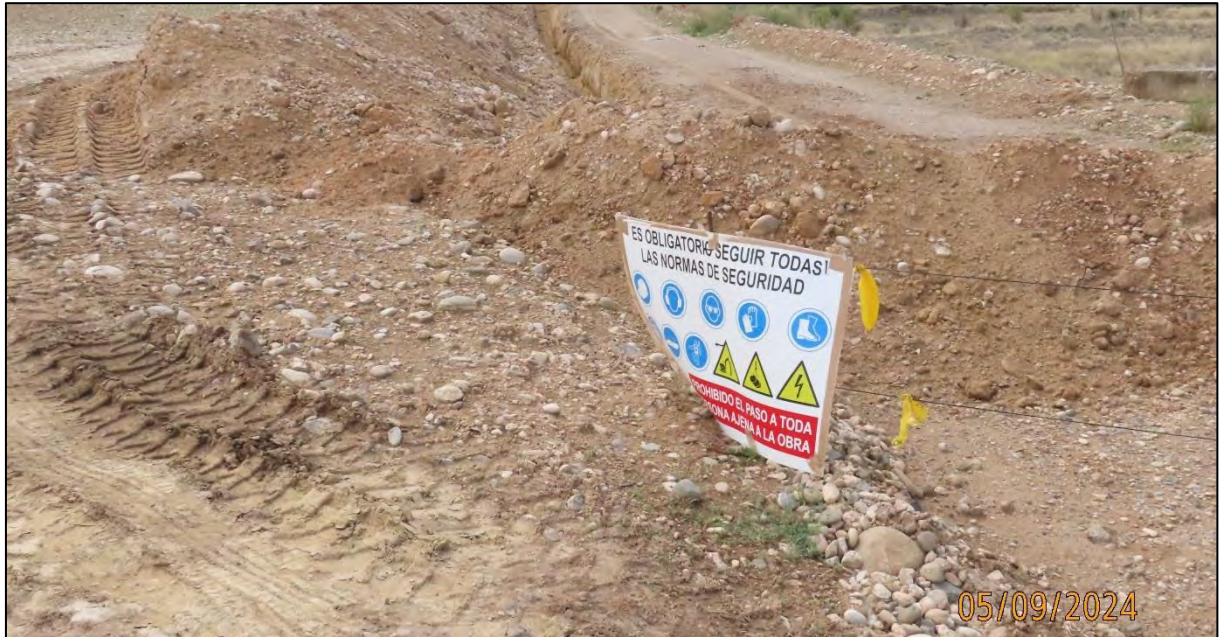
Ilustración 2. Señalización en la entrada al tajo.