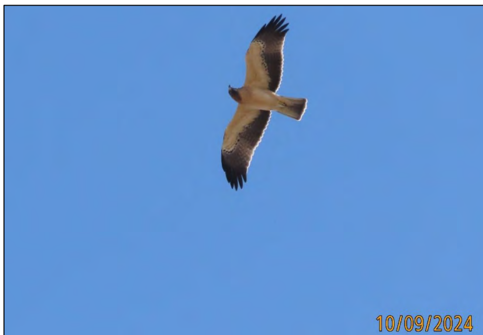
Ilustración 13. Águila calzada ( Hieraetus pennatus ).

El plano con la representación de las observaciones del seguimiento de avifauna se incluye en el ANEXO 2 .