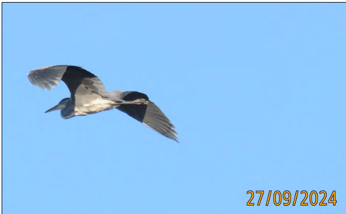
Ilustración 17. Garza real ( Ardea cinerea ).