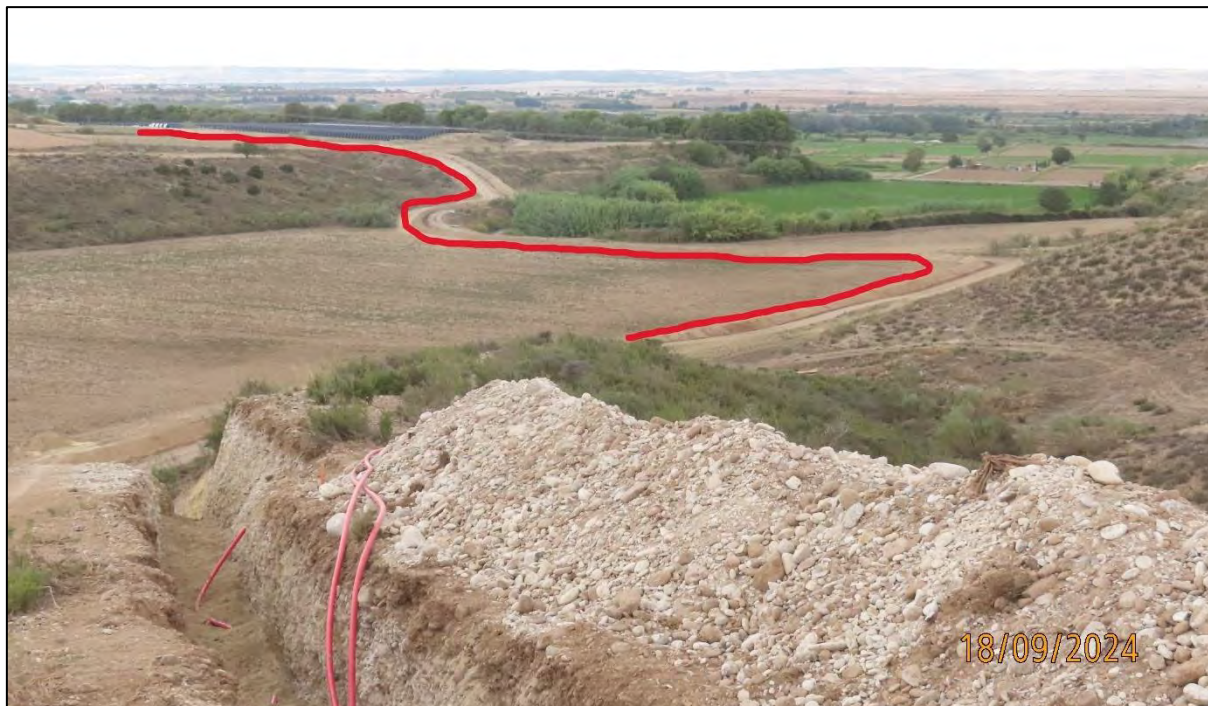
Ilustración 6. Trazado de la LSMT. Al fondo el PFV "El Boyal".