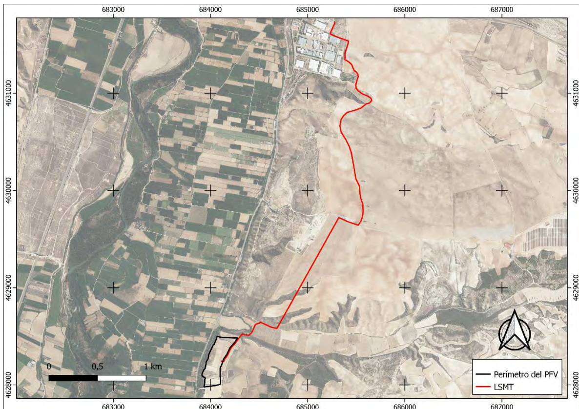
Ilustración 1. Situación de la PFV y su infraestructura de evacuación.

La zona de implantación de la planta solar fotovoltaica (PFV) "El Boyal", y su infraestructura de evacuación se encuentra ubicada en los municipios de Zaragoza y San Mateo de Gállego, en la Comarca Central de Zaragoza, concretamente en las parcelas 1, 37, 38, 39, 40, 41 y 101 del polígono 22 del término municipal de Zaragoza, y parcela 3 del polígono 507 y 70 del polígono 14 del término municipal de San Mateo de Gállego, a unos 2,3 km al norte de Peñaflor y en las inmediaciones de la carretera A-123. Las parcelas seleccionadas para la instalación de la planta solar fotovoltaica son de uso agrícola, ocupadas actualmente por cultivos de cereal en secano. A la zona de implantación de la planta solar fotovoltaica se accede desde camino existente que parte desde la carretera autonómica A-123, a la altura del kilómetro 13. La instalación cuenta con una línea soterrada de media tensión (15 kV), la cual cuenta con una longitud total de 4.981,88 m. La línea de evacuación se inicia en las coordenadas 684.107/4.628.240 y finaliza en 685.281/4.631.730.