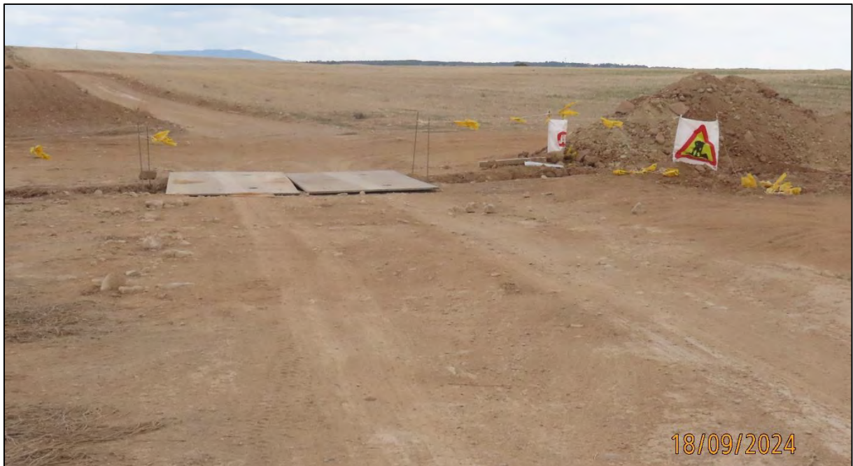
Ilustración 3. Señalización en camino atravesado por la obra, con reposición de camino mediante puente sobre la zanja.