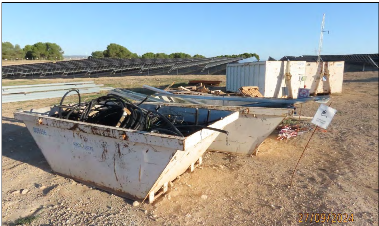
Ilustración 9. Zona de gestión de residuos.

Durante este sexto mes de obras se han producido residuos plásticos, de papel, de madera y de cableado, además de envases con residuos peligrosos, provenientes del espray de obra.