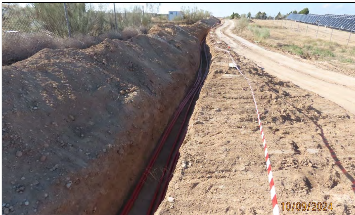
Ilustración 5. Señalización del trazado de la zanja a la altura del PFV "El Boyal".