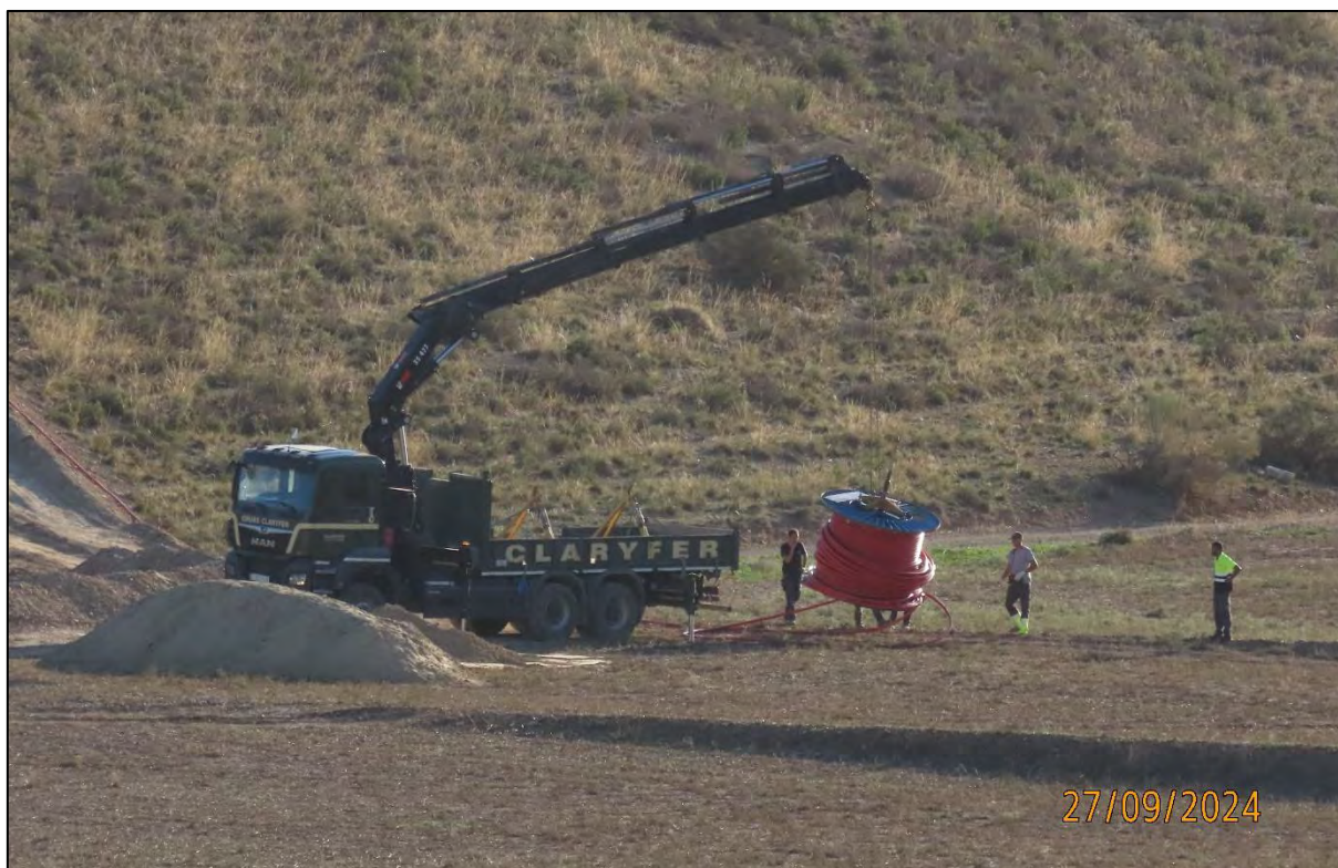
Ilustración 7. Movimiento de los cables de línea.