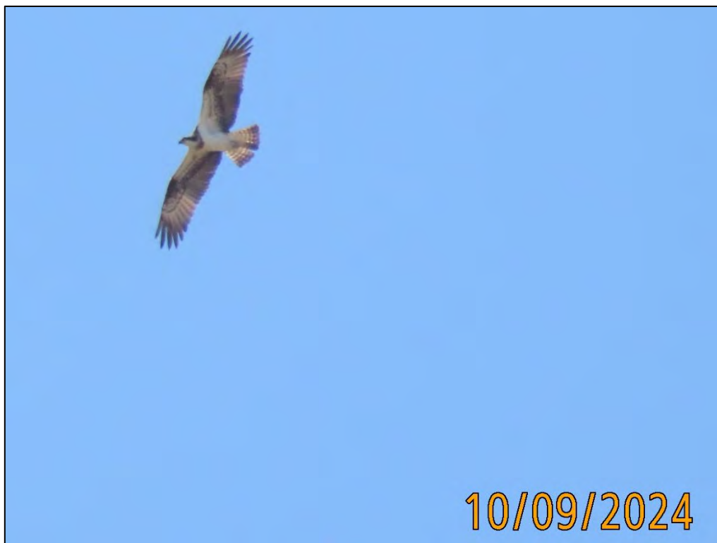
Ilustración 15. Águila pescadora ( Pandion haliaetus ).