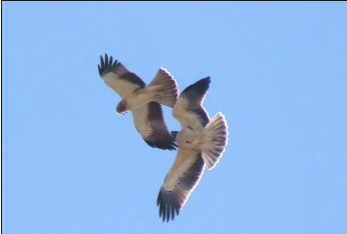
Ilustración 14. Pareja de águila calzada ( Hieraetus pennatus ).