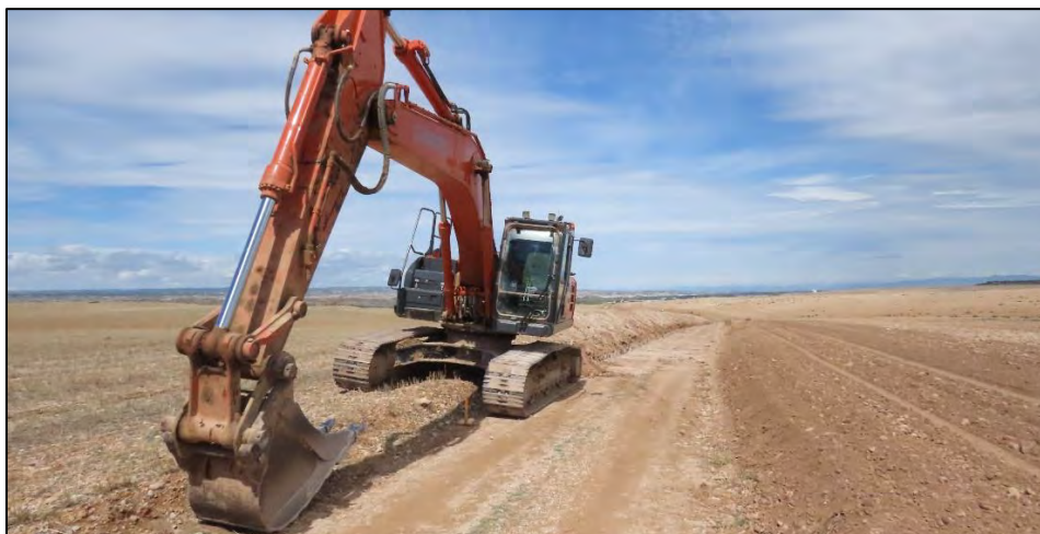
Ilustración 11. Excavadora zanjadora.

No se ha registrado ninguna incidencia respecto al control arqueológico.