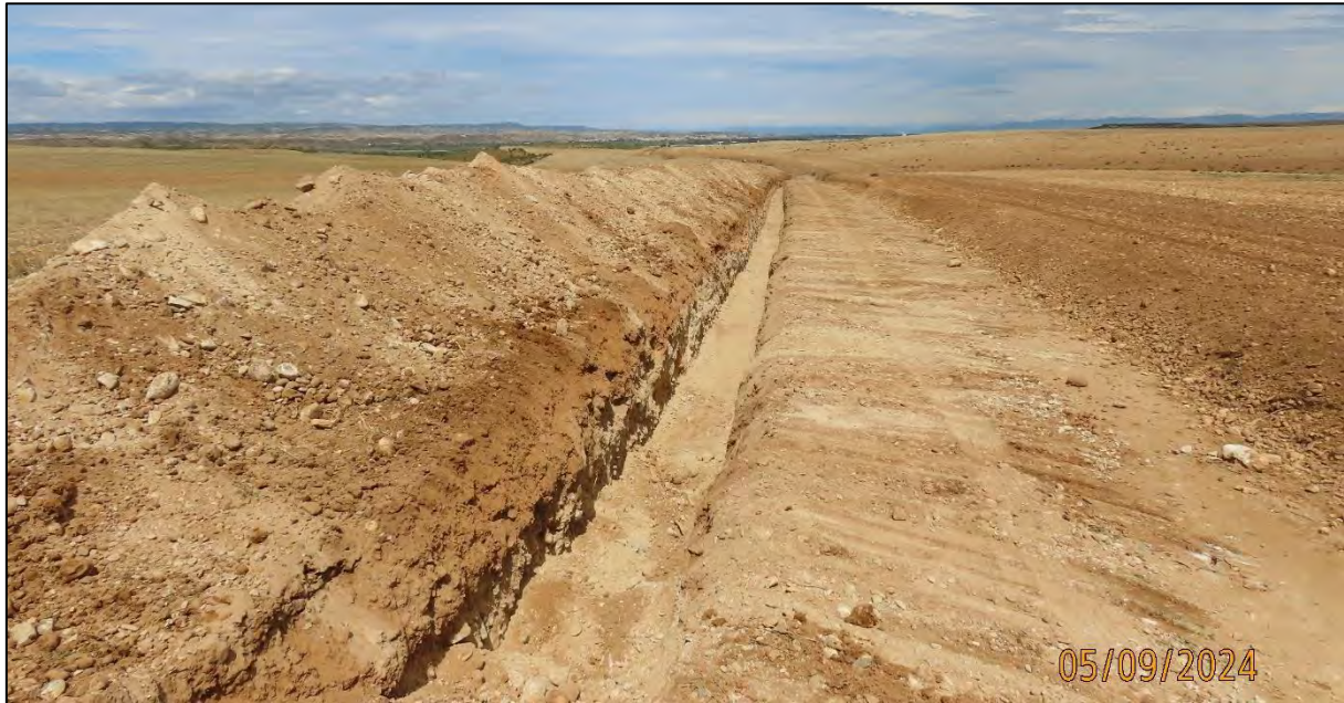
Ilustración 8. Acopio de tierra vegetal junto a la zanja de la LSMT.

Durante los movimientos de tierra, el técnico que lleva a cabo las labores de seguimiento ambiental en fase de obras controla que la superficie sobre la que se trabaja sea la definida en el proyecto ejecutivo y las resoluciones correspondientes. Durante esta tarea no se registró ninguna incidencia.