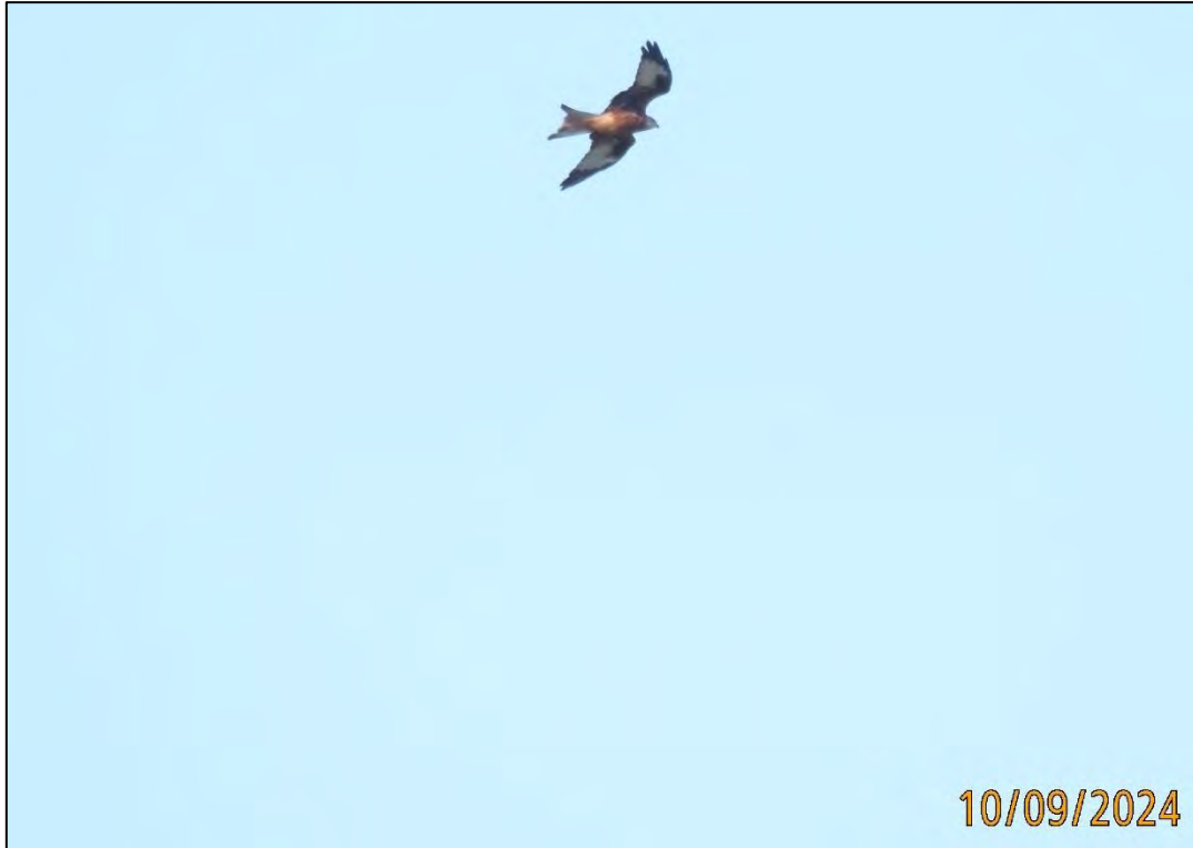
Ilustración 16. Milano real ( Milvus milvus ).