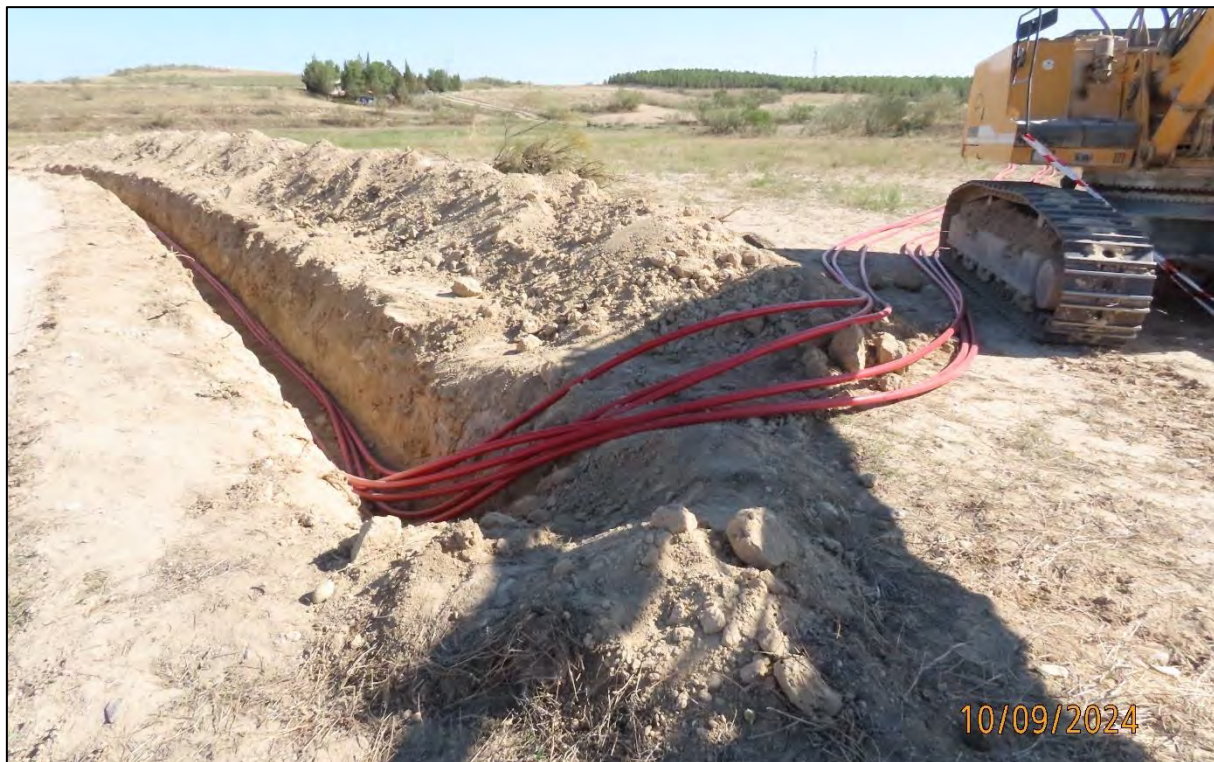
Ilustración 4. Extremo de la LSMT, que parte de la PFV "La Pallaruela".