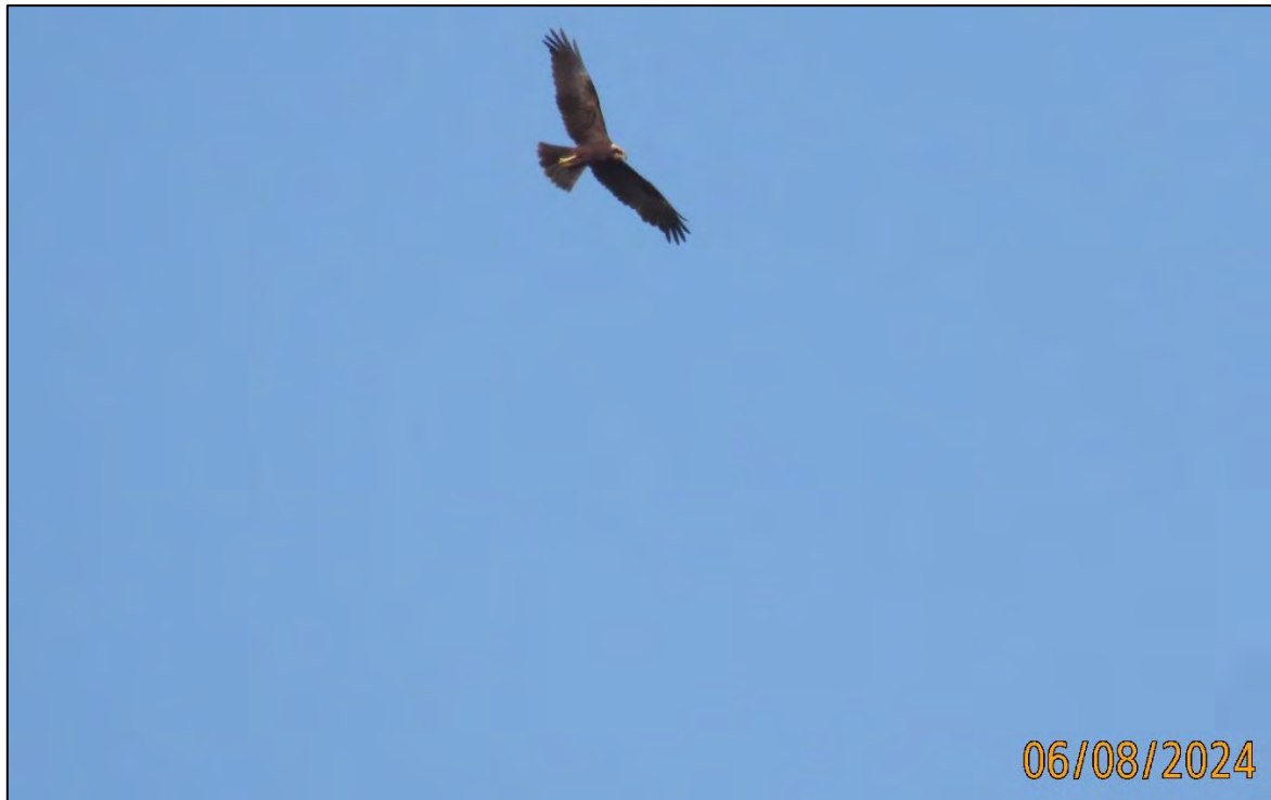
Ilustración 8. Aguilucho lagunero (Circus aeruginosus).