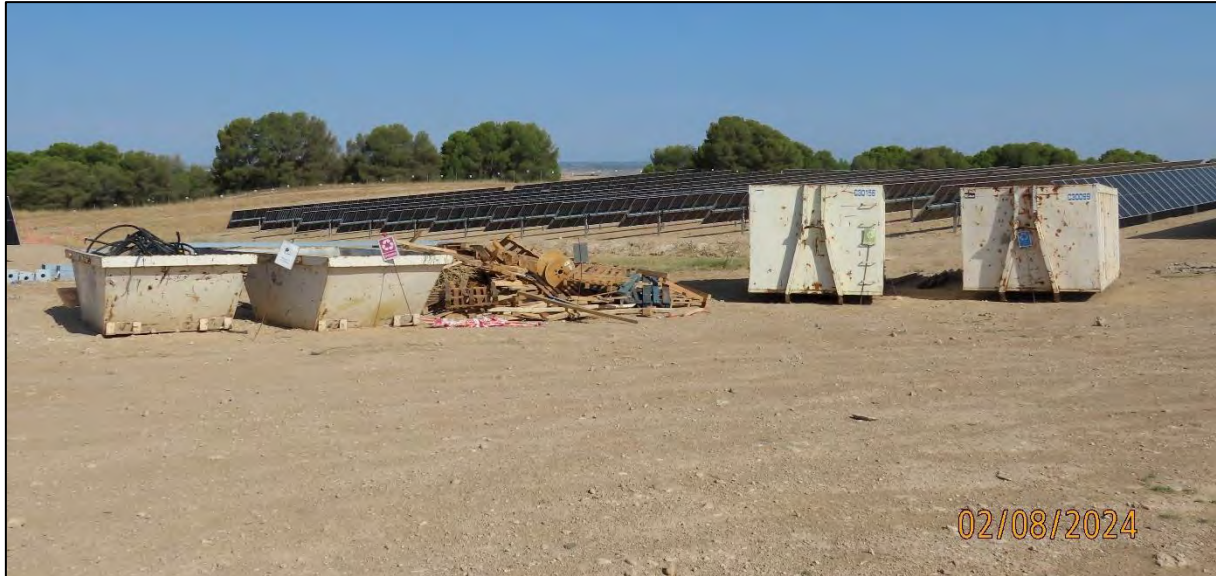
Ilustración 5. Ampliación de la zona de gestión de residuos.

Durante el mes de agosto la limpieza en el entorno de la instalación ha sido óptima, no observándose residuos ni en el interior, ni en las inmediaciones de la PFV. Por lo que no se detecta ninguna incidencia en este sentido.