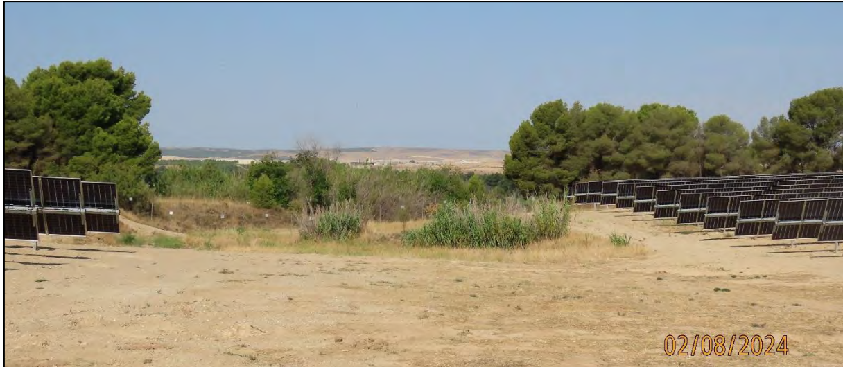
Ilustración 6. Vegetación natural de las barranqueras naturales conservadas.

Se controla que la maquinaria restrinja sus movimientos a la zona delimitada para ello. En este caso, se habilita el vial interior de las instalaciones paralelamente al vallado perimetral.