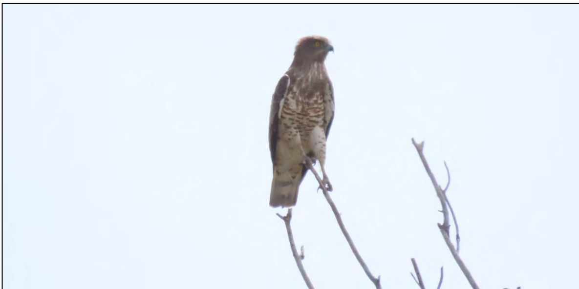
Ilustración 9. Águila culebrera europea (Circaetus Gallicus).