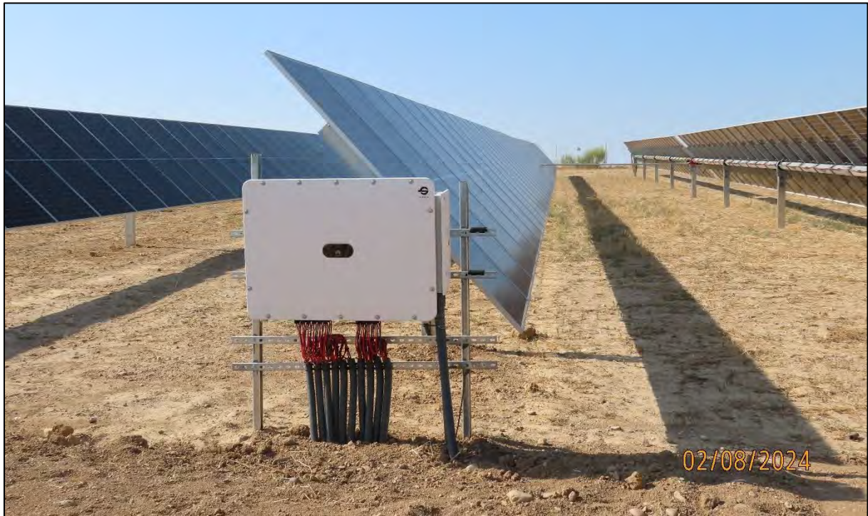
Ilustración 2. Línea de placas finalizada y revisada.

Es por esto por lo que el resto del mes se han realizado visitas con la finalidad de mantener la periodicidad del censo de avifauna, ya que este se debe de seguir realizando a pesar de que la obra se encuentre parada.