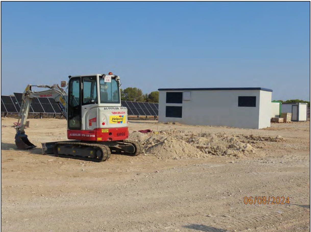
Ilustración 4. Centro de transformación preparado y a la espera de la ejecución de la LSMT.