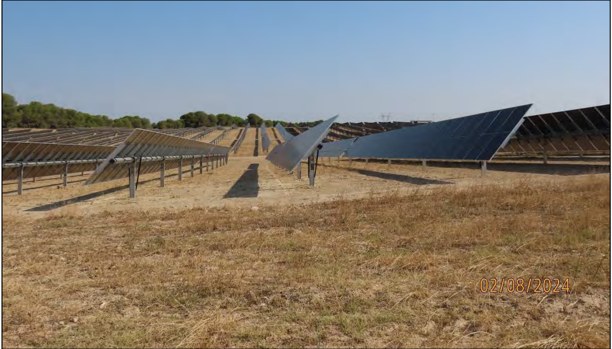
Ilustración 3. Aspecto de la PFV El Boyal a 02/08/2024.