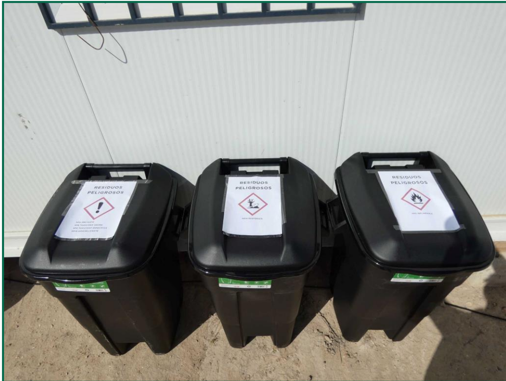
Fotografía 10. Contenedores de residuos peligrosos.