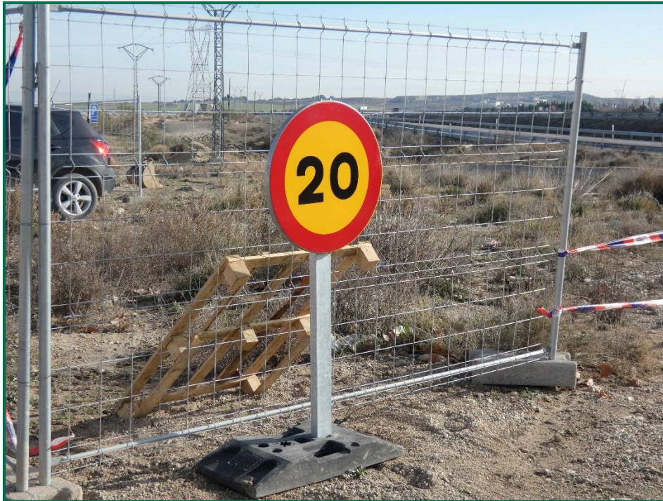
Fotografía 1. Señalización de velocidad.