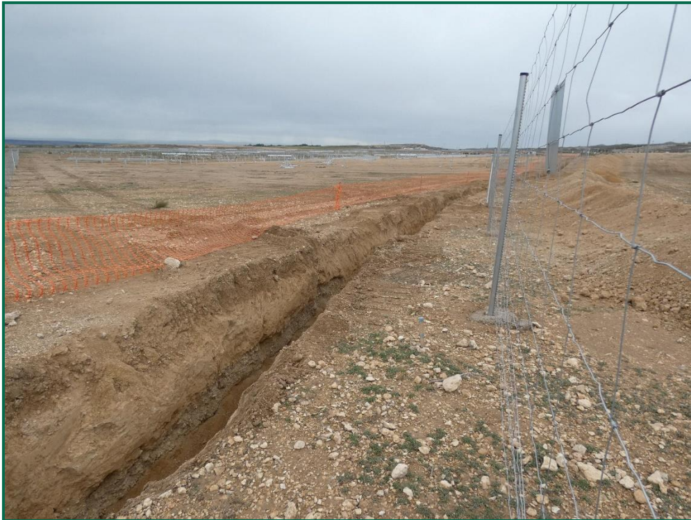
Fotografía 17. Línea de evacuación que une a las distintas plantas.