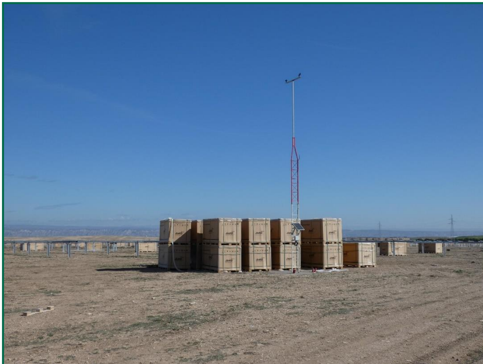
Fotografía 5. Torre de medición de parámetros ambientales y materiales de obra.