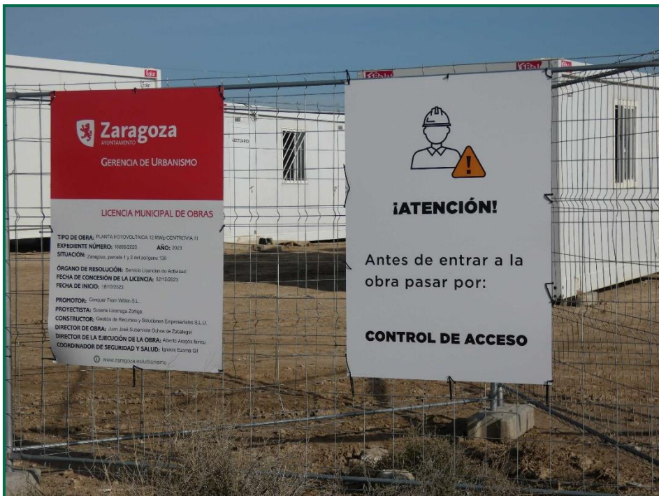
Fotografía 2. Carteles informativos.