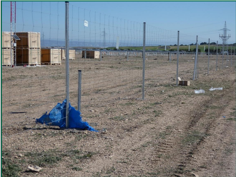
Fotografía 12. Restos de embalaje sobre el vallado.