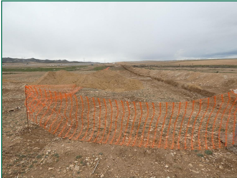
Fotografía 15. Balizamiento de la zanja.