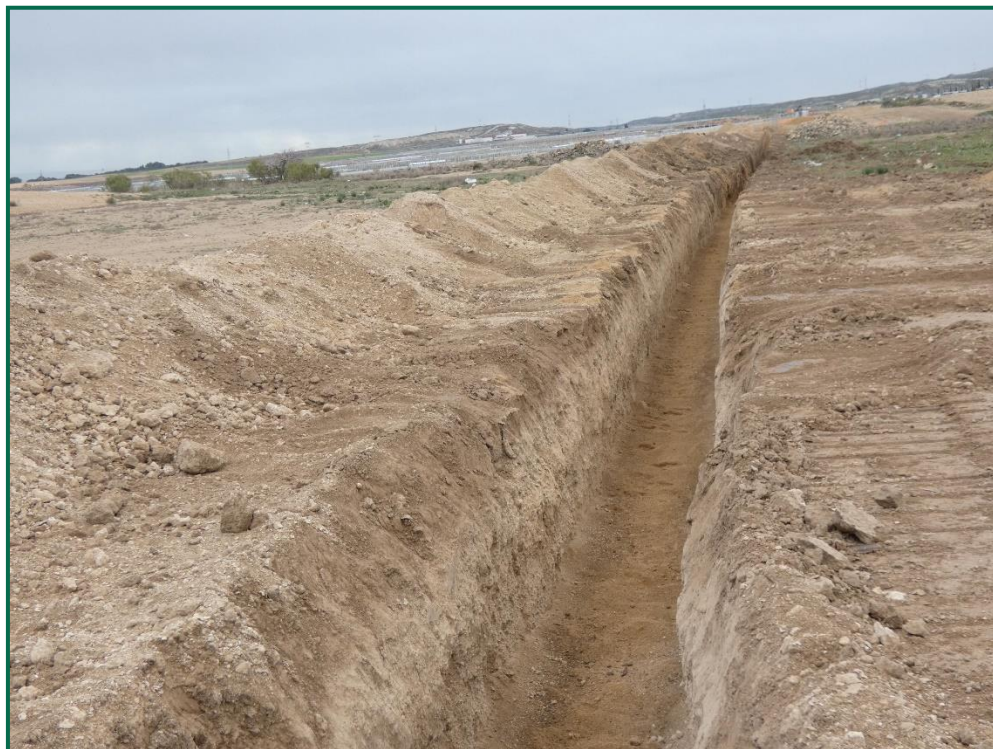
Fotografía 16. Realización de zanjas y acopios de tierra.