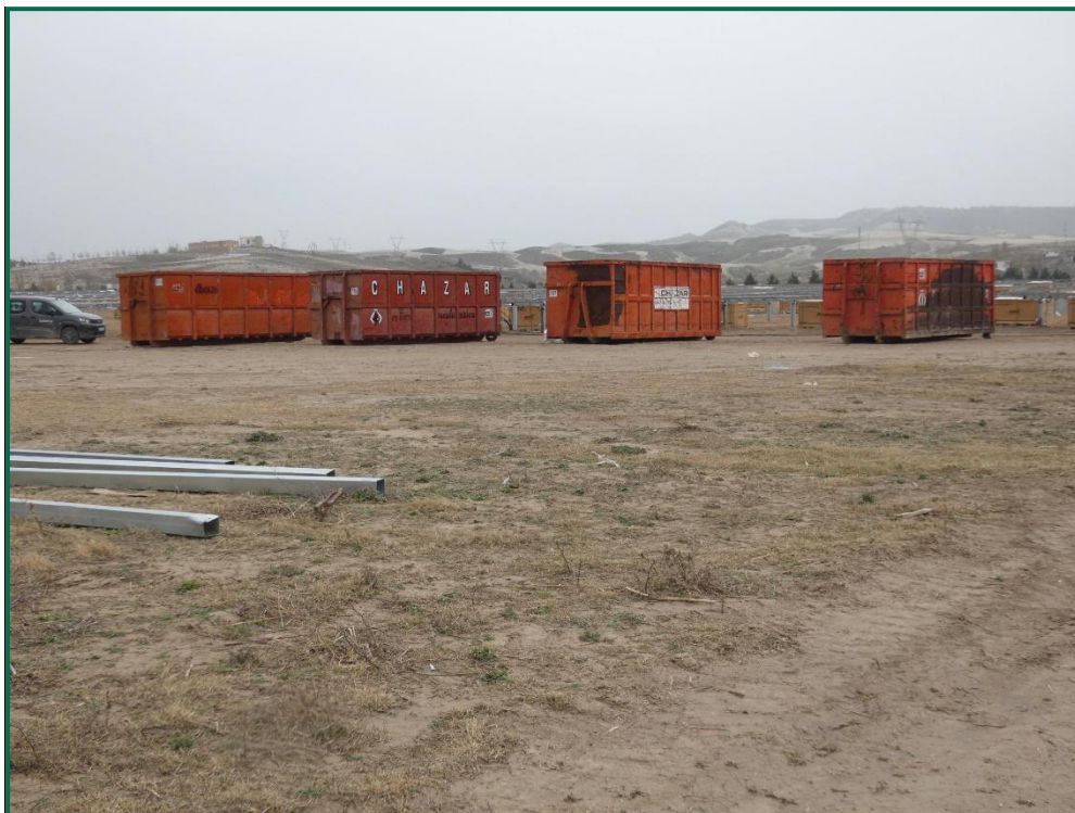
Fotografía 9. Contenedores de residuos sobre la planta.

Se están utilizando grupos electrógenos y se han instalado envases de combustible. Además, se han colocado bandejas de contención debajo de ellos para evitar derrames por pérdidas accidentales sobre el terreno.