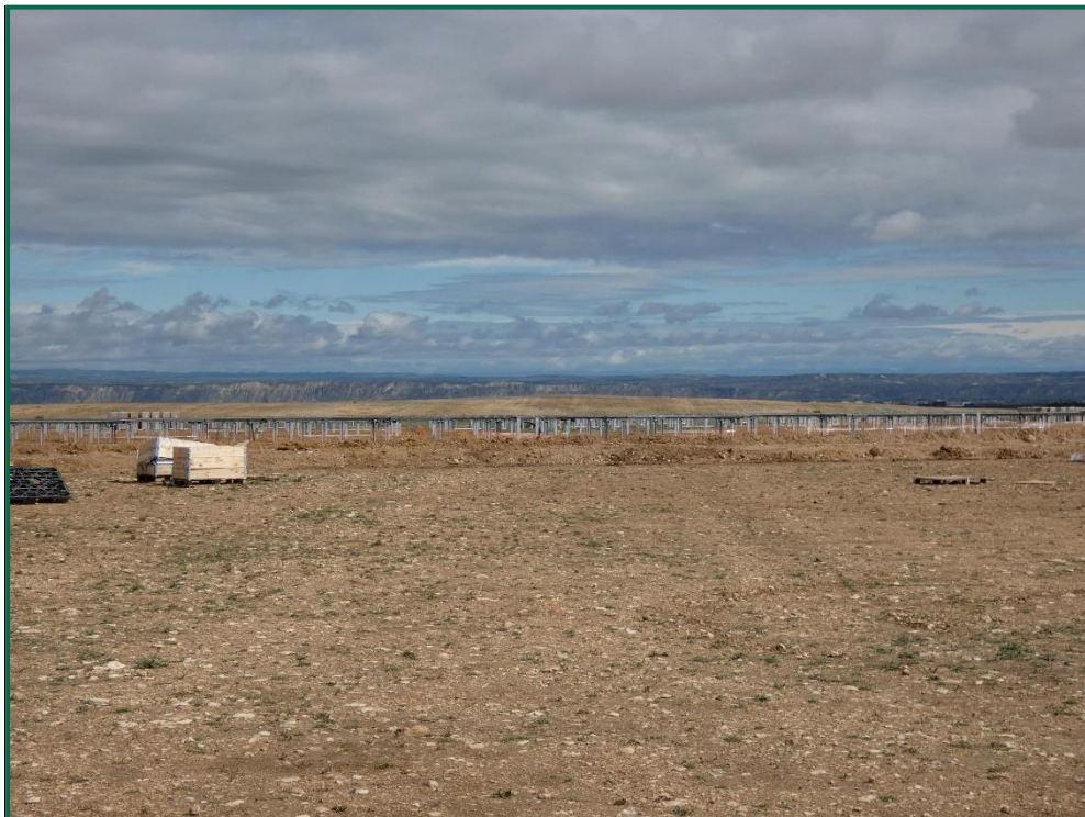
Fotografía 13. Superficie de la planta sin restos de embalaje.