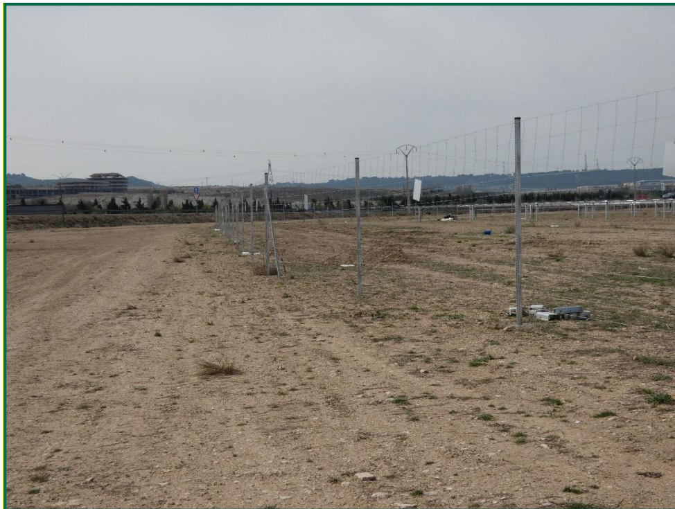
Fotografía 7. Placas anticolidión.

Durante este mes el vallado se ha doblado en ciertos puntos debido a los fuertes vientos que arrastran plantas rodadoras hasta que los postes del vallado ceden. Estos desperfectos se arreglarán en meses posteriores.