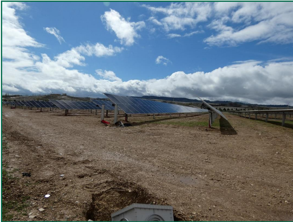
Fotografía 4. Colocación de las placas fotovoltaicas.