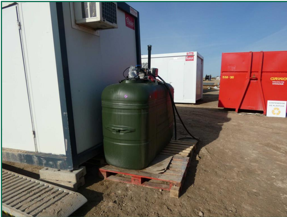
Fotografía 11. Envase de combustible.