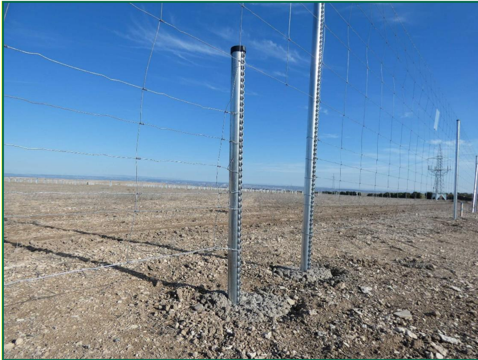
Fotografía 8. Espaciado cinegético.

Se ha realizado seguimiento de avifauna durante el proceso de la obra, observándose las siguientes especies: busardo ratonero ( Buteo buteo ), corneja negra ( Corvus corone ) cuervo grande ( Corvus corax ), chova piquirroja ( Pyrhacorax pyrrhacorax ), aguilucho lagunero ( Circus aeruginosus ), abubilla común ( Upupa epops ), gaviota patiamarilla ( Larus michaellis ), anade azulón ( Anas platyrhynchos ), pato colorado ( Netta rufina ) y garza real ( Ardea cinerea ). Además, otras especies como estornino negro ( Sturnus unicolor ) o urraca común ( Pica pica ) entre otras.