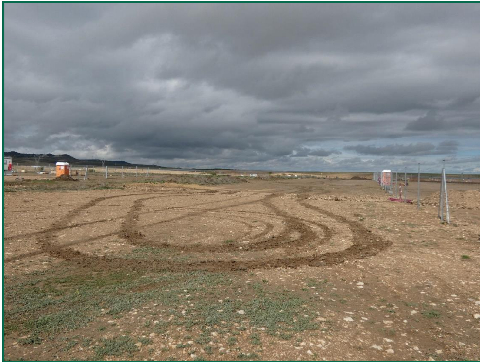
Fotografía 6. Franja vegetal y vallado perimetral.

Durante las visitas a obra se comprueba que la ocupación de zonas de vegetación se limita a lo aprobado en el proyecto. Se verifica también que la maquinaria circula únicamente por los viales habilitados para tal fin. Desde el inicio de las obras se ha planificado la ejecución de una franja vegetal de 8 m de anchura en torno al futuro vallado perimetral.