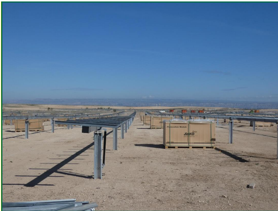
Fotografía 3. Postes verticales y horizontales para las placas fotovoltaicas.

Por el momento la tierra vegetal extraída ha sido escasa debido a que no ha sido necesario nivelar todo el terreno, únicamente algunas zonas y con un espesor limitado, y esta se ha ido extendiendo sobre el terreno. La tierra extraída para la construcción de balsas de limpieza se ha acopiado en caballones al igual que la tierra retirada para realizar zanjas. En las zonas donde se van a realizar plantaciones para crear una patalla vegetal no se ha realizado ningún movimiento de tierra, conservando la capa de tierra vegetal presente.