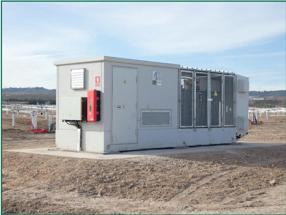
Fotografía 14. Extintor en la caseta del inversor.