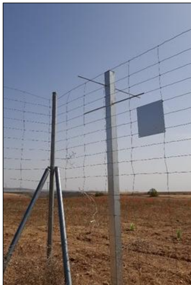
Figura 6: Ejemplo de poste posadero instalado en uno de los vértices del perímetro de la instalación.

Los postes instalados en algunos vértices de la instalación se mantienen en buen estado, aunque durante las visitas a lo largo del trimestre no se ha observado ningún ave haciendo uso de los mismos.