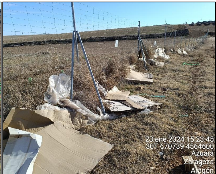
Figura 4: Residuos plásticos y de cartón dispersados por el viento y acumulados contra el vallado en el sector NE de la PSFV. Los residuos habían sido recogidos y almacenados correctamente antes de la visita de febrero.