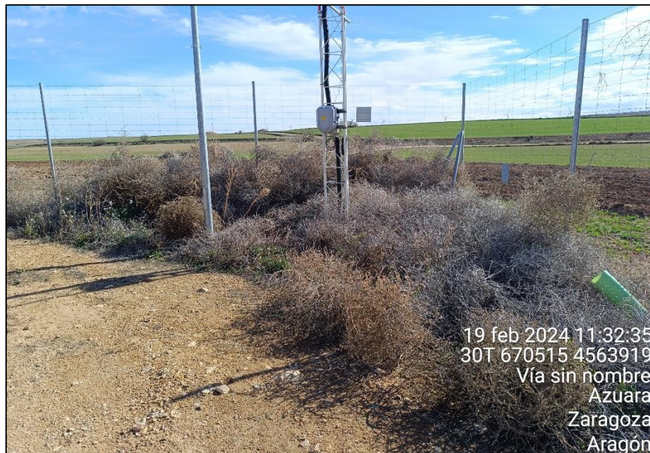
Figura 11: Vegetación rodada acumulada en una esquina dentro del perímetro vallado de la PSFV cubriendo parcialmente estructuras eléctricas.