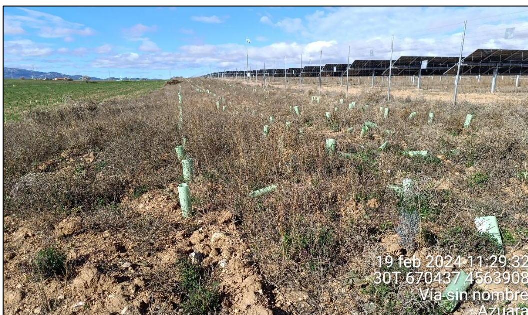
Figura 3: Colonización natural de vegetación en el espacio entre plantones

Por otra parte, la colonización por parte de la vegetación natural de los espacios entre plantones, en general, es bastante favorable y presenta una densidad alta.