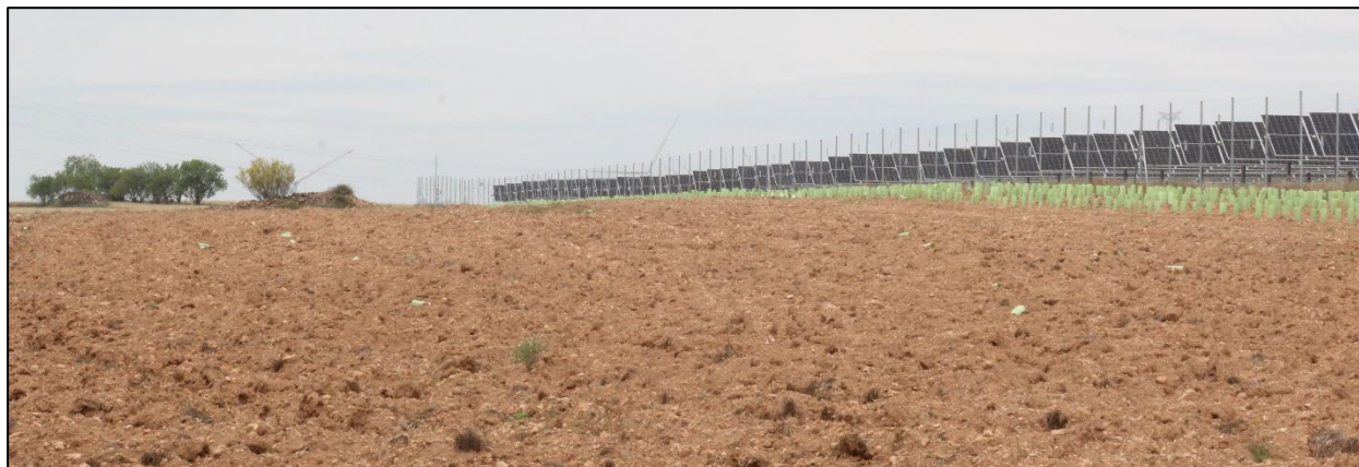
Figura 2: Ejemplo de campos arados dedicados al cultivo de cereal en secano en el entorno de la PSFV.

Existen campos de cultivo abandonados y barbechos cerealistas donde, además de en las márgenes de las parcelas y viales que las delimitan, prolifera un pastizal típico de ambientes medianamente enriquecidos en nitrógeno de especies arvenses acompañantes de estos cultivos como Papaver rhoeas , Lolium rigidum , Convolvulus arvensis , Fumaria spp. , Polygonum aviculare , Galium spp. , Cirsium arvense , Bromus spp. , Anacyclus clavatus , Rapistrum rugosum , Rumex spp. , Euphorbia serrata , Vicia sp. , Medicago sativa , Hypocoum procumbens , Capsella bursapastoris , Diploaxis erucoides , Malva sylvestris , Herniaria hirsuta , Chenopodium álbum , Matricaria chamomilla , y un largo etc. Se trata mayoritariamente de especies de dicotiledóneas de carácter anual y en, menor medida, especies bianuales o perennes. No obstante, las labores y el empleo de herbicidas limitan la presencia de especies vegetales arvenses a la periferia de las parcelas, márgenes de caminos, linderos, etc.