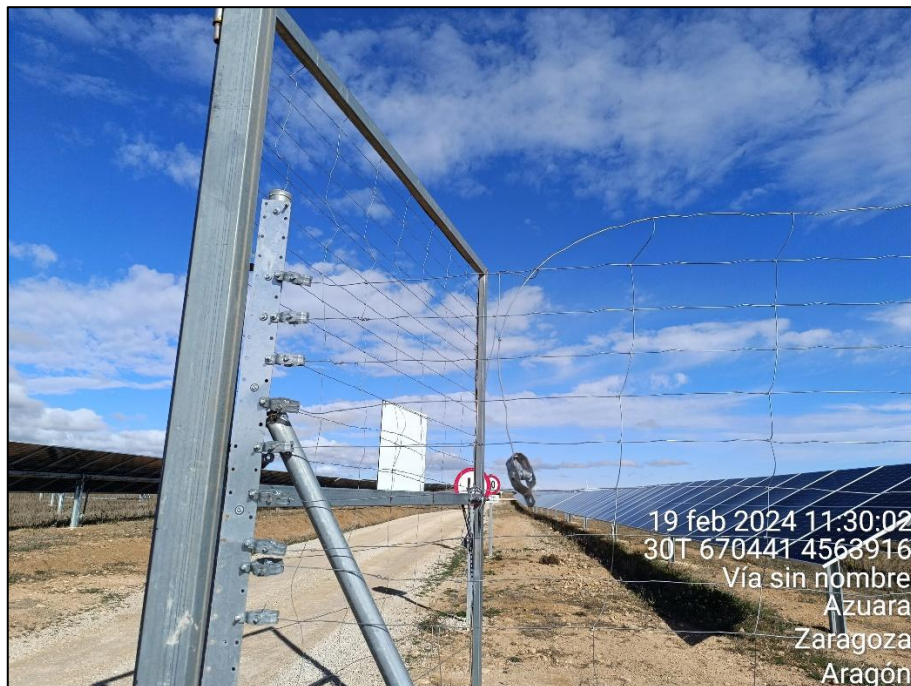
Figura 9: Empalme del vallado con un tensor suelto junto al puerta de entrada en la PSFV.

Por último, cabe reseñar que a lo largo del año se ha acumulado contra el vallado gran cantidad de vegetación seca rodada empujada por el viento. La acumulación se ha producido tanto por el exterior del vallado, principalmente en los tramos orientados hacia el W, como en el interior del vallado, sobre todo en los tramos orientados hacia el E y especialmente en las esquinas del perímetro. En algunas de estas esquinas la vegetación rodada ha cubierto zonas con estructuras eléctricas (cámaras, torres de medición...)