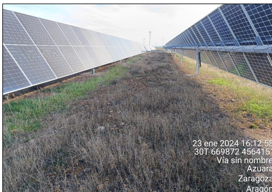
Figura 1: Revegetación por colonización natural desarrollada entre las filas de paneles.

La revegetación natural se está desarrollando de forma adecuada en todo el perímetro de la PSFV, dándose, en general, una colonización bastante rápida por las especies silvestres de la zona.