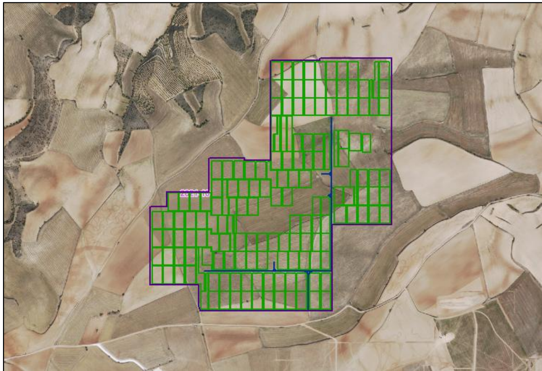
Figura 1: Ubicación del perímetro y de los paneles fotovoltaicos sobre fotografía por satélite.