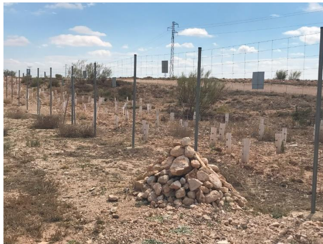
Foto 4: Majano en las inmediaciones de uno de los viales interiores.