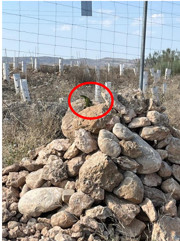
Foto 3: Majano con lagarto ocelado en el interior de la PSFV SEDEIS V.

Los majanos instalados en el interior del perímetro se encuentran en buenas condiciones. Gran parte de ellos se encuentran rodeados de vegetación que los hace más atractivos para la fauna. Cabe indicar que durante la última visita del 25 de julio se detectó un lagarto ocelado en uno de los majanos lo que indica el éxito de los mismos.