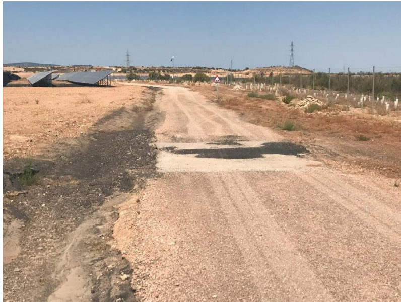
Foto 15: Aspecto de uno de los drenajes perpendiculares a un camino interior de la PSFV SEDEIS V.

Los canales de drenaje se encuentran en general en buen estado.