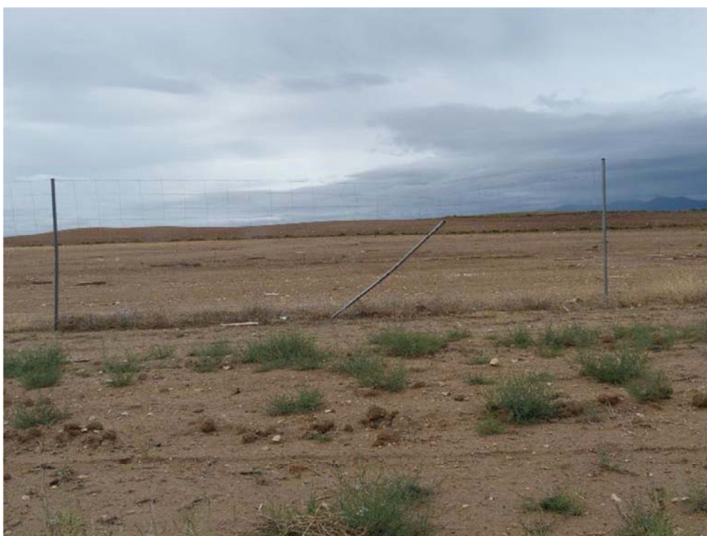
Figura 8.4. Poste doblado, vallado roto (elementos punzantes) y placas de visibilidad caídas/ausentes