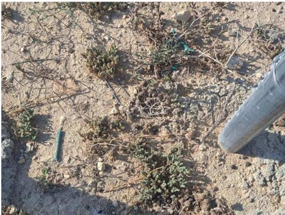
Figura 8.3. Alambres junto a los pasos de fauna a lo largo del vallado