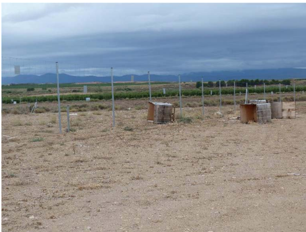
Figura 8.1. Cajas y palés abandonados en la planta “San Pedro B”