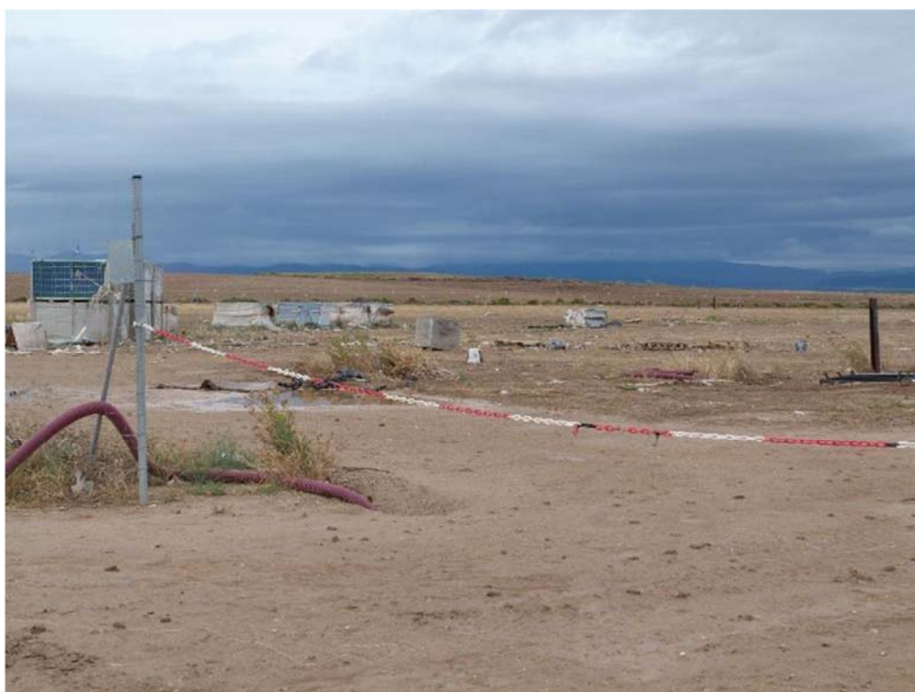
Figura 4.1. Acopios de materiales restantes localizados en la planta “San Pedro A”

En este periodo no se han realizado trabajos de construcción en esta planta. Además, se han retirado la mayor parte de los acopios de materiales que se localizaban en la misma y que se usaban para la construcción de las plantas fotovoltaicas “Épila 123”.