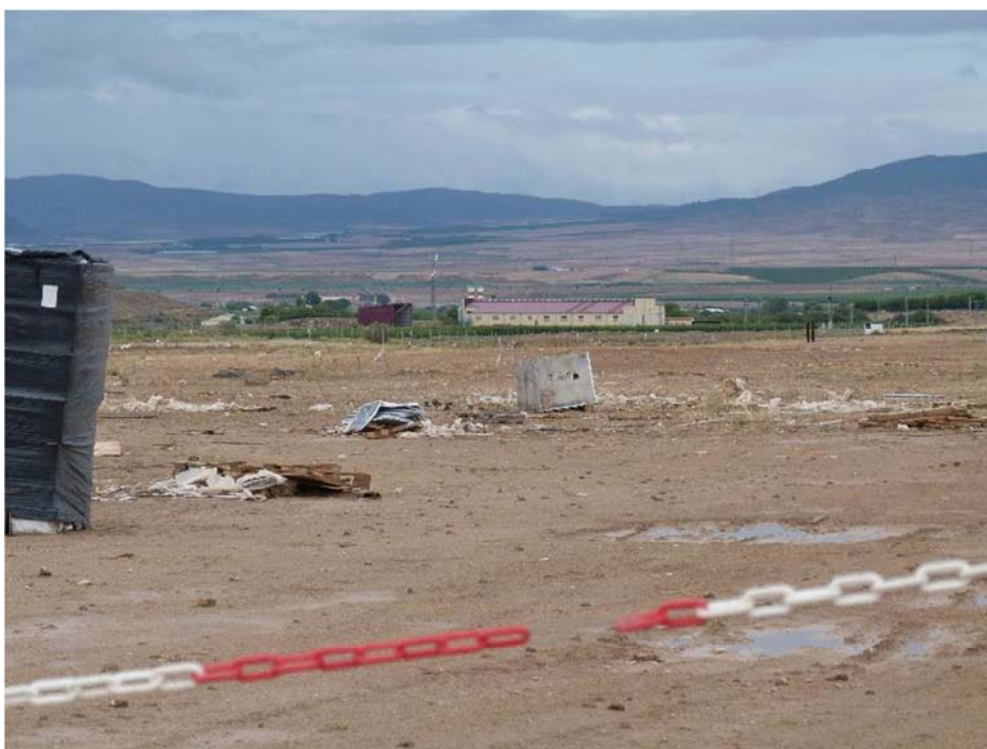
Figura 8.2. Residuos abundantes en la zona donde se situaban los acopios en “San Pedro A”