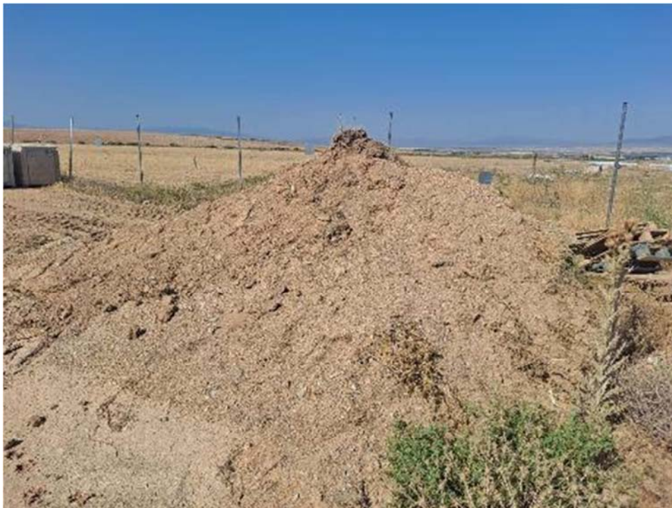
Figura 8.5. Acopio de tierra vegetal entre las plantas “San Pedro” y “Épila”