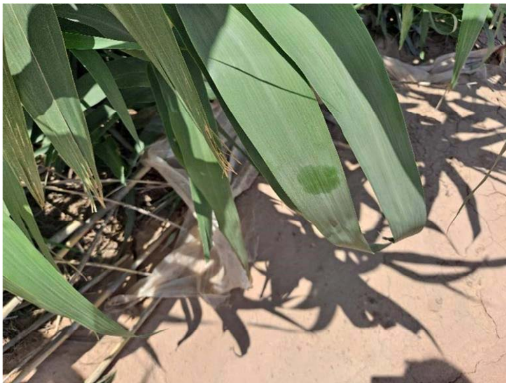
Figura 8.10. Depósitos de polvo en la vegetación existente dentro del recinto