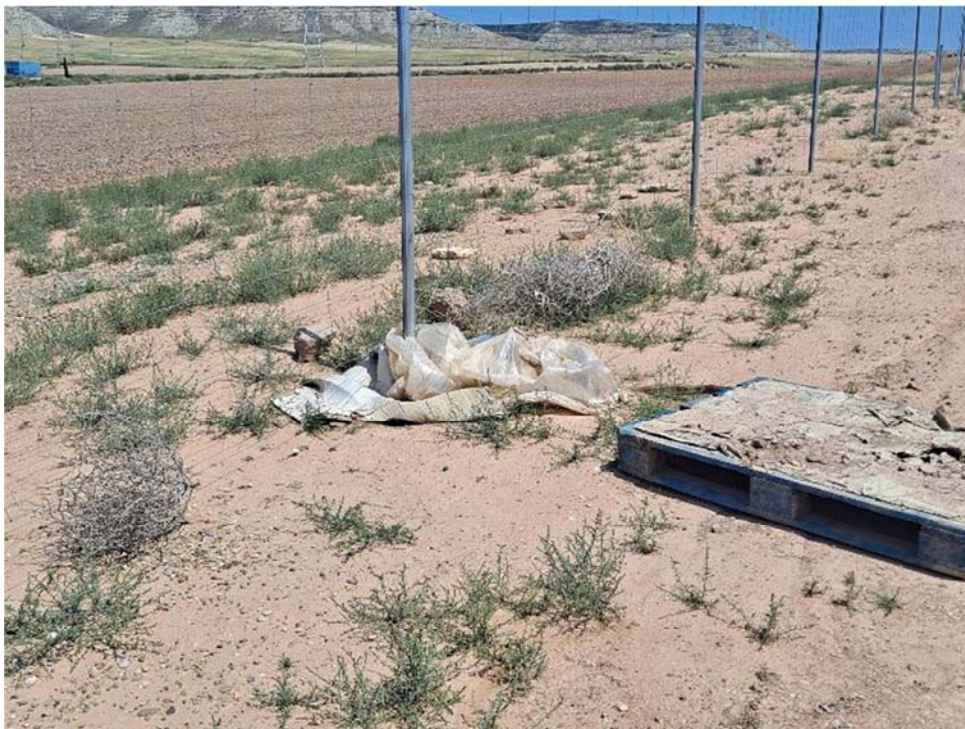
Figura 8.3. Residuos dispersos en la parcela