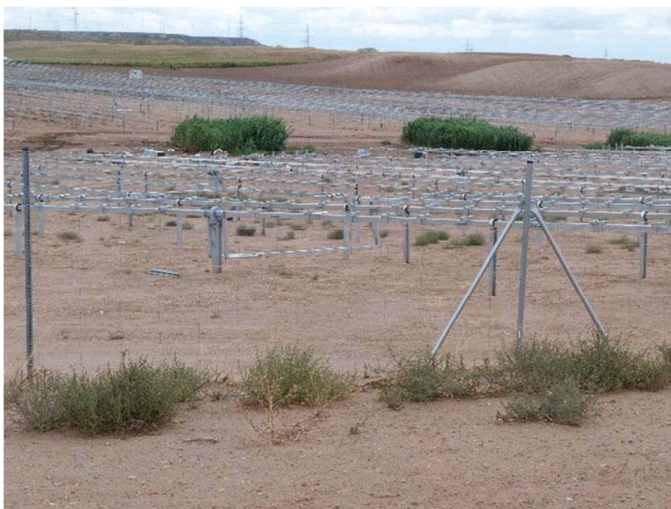
Figura 8.2. Aspecto de la planta el 14-08-2024. Terminando de colocar los seguidores