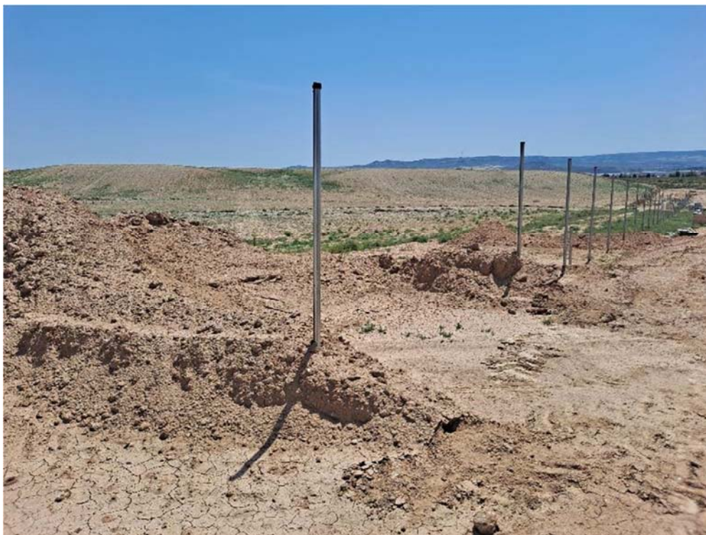
Figura 8.9. Tramo donde se ha desmontado el vallado en la esquina norte