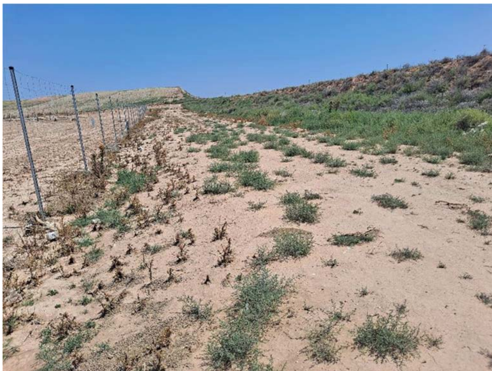
Figura 8.12. Aspecto del acopio de tierra vegetal situado en el extremo suroriental