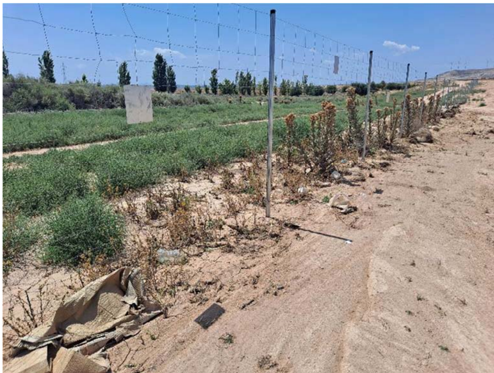
Figura 8.11. Más residuos dispersos por el interior del recinto vallado