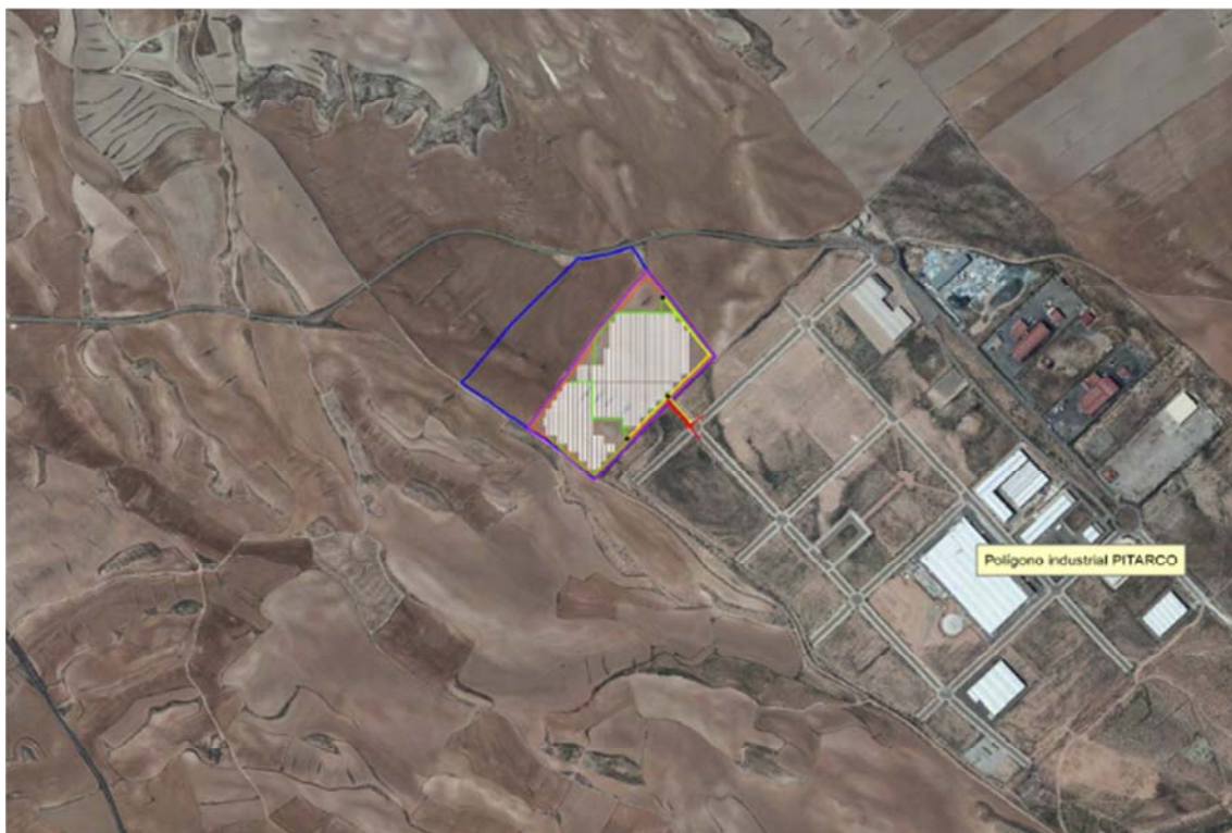
Figura 3.2. Localización de la zona de instalación de la planta solar fotovoltaica “Muel I y II”. Base cartográfica PNOA 2021.