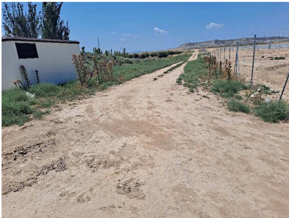
Figura 8.13. Aspecto del acopio situado en el extremo suroriental. Este tramo se usa como acceso, por lo que está compactado