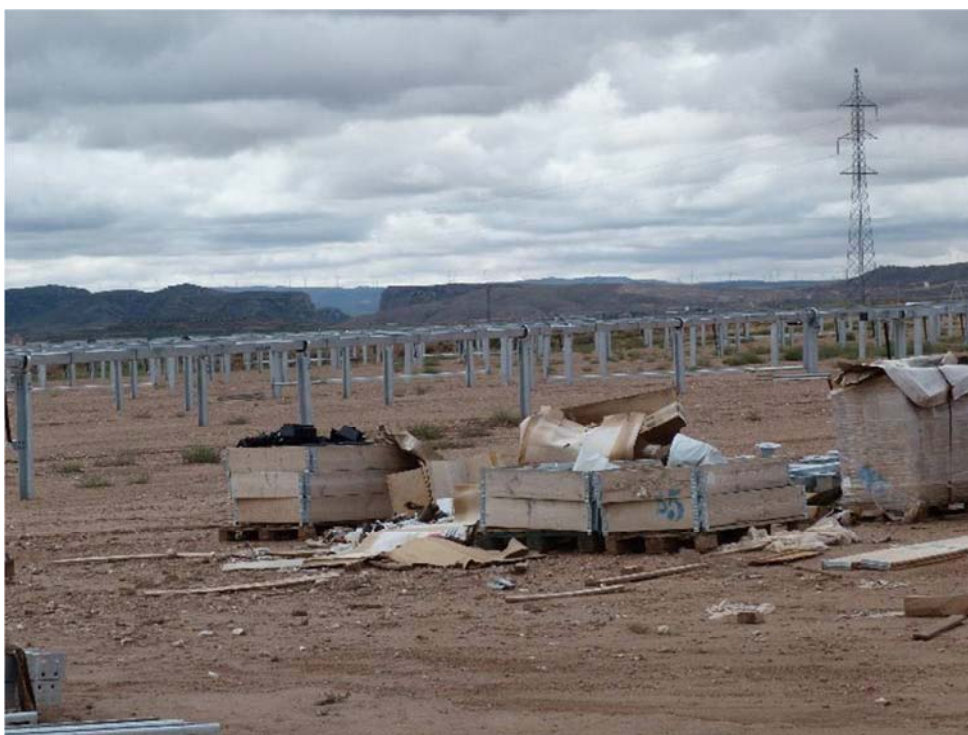
Figura 8.4. Área donde se localizan los cajones para almacenar residuos. Son insuficientes, por lo que se observan residuos dispersos en el suelo