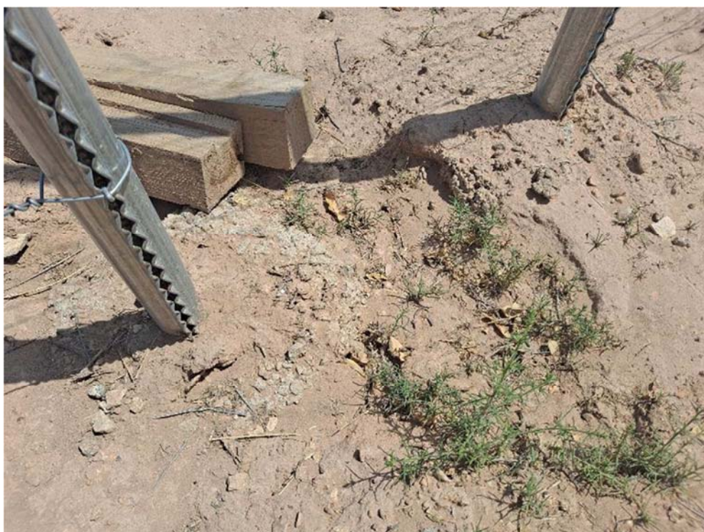
Figura 8.14. Alambres en el suelo en muchos de los pasos de fauna