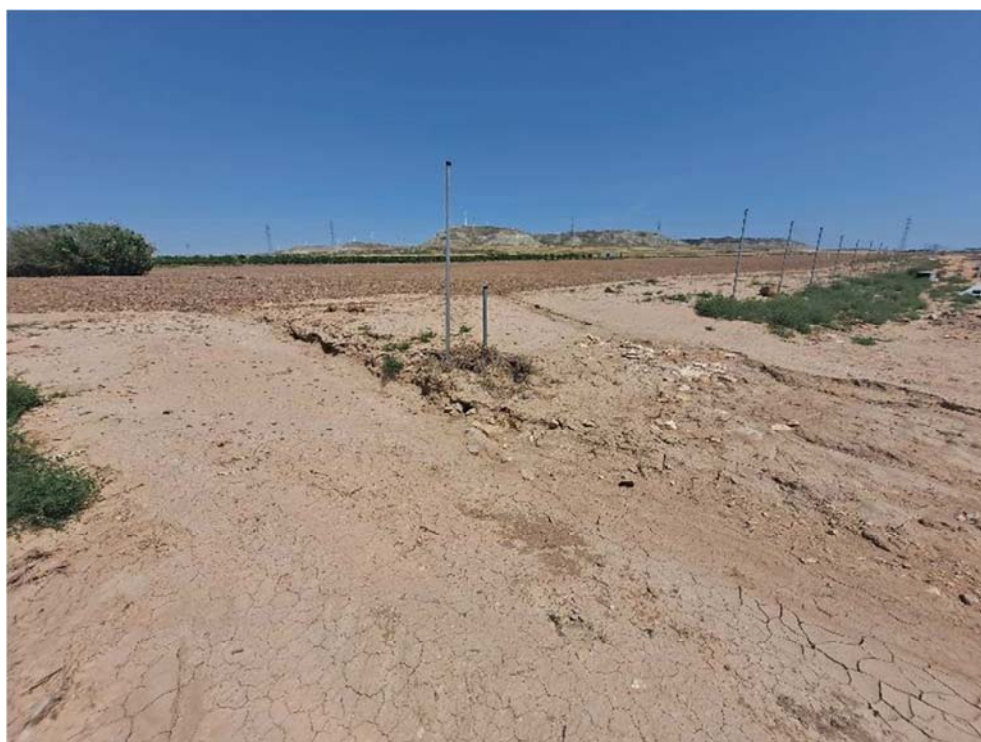
Figura 8.8. Reguero en el extremo noroeste de la parcela, que puede producir descalces en los postes del vallado