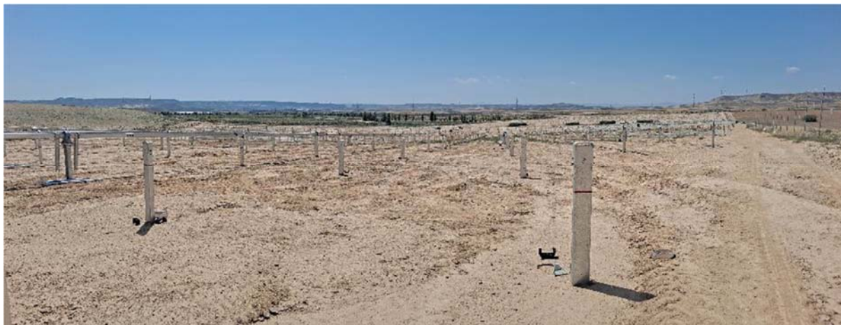
Figura 8.1. Aspecto de la planta el 18-07-2024. Se están colocando seguidores.