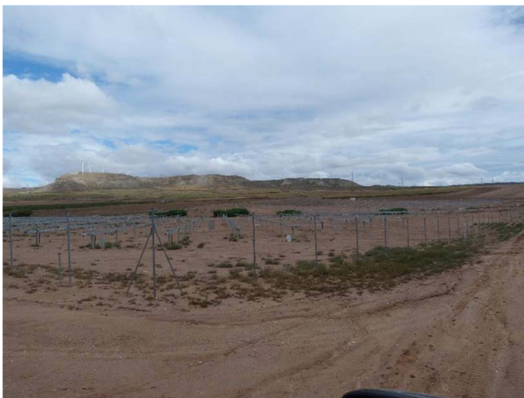
Figura 4.1. Aspecto de la parcela a fecha 14-08-2024, con los seguidores colocados