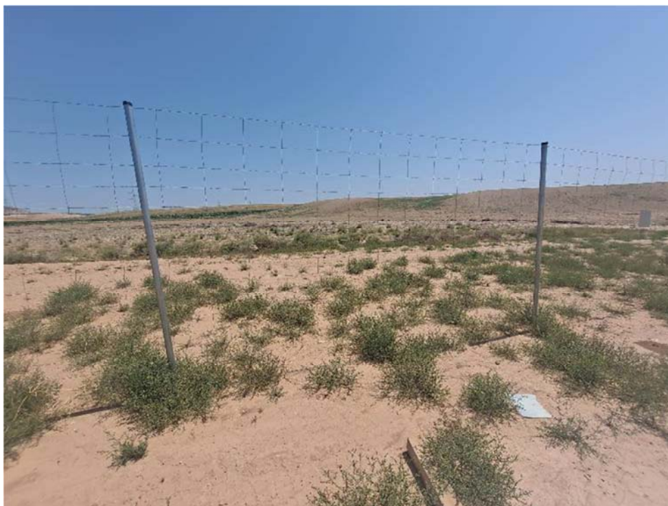
Figura 8.6. Placa ausente (en el suelo), en uno de los vanos del vallado