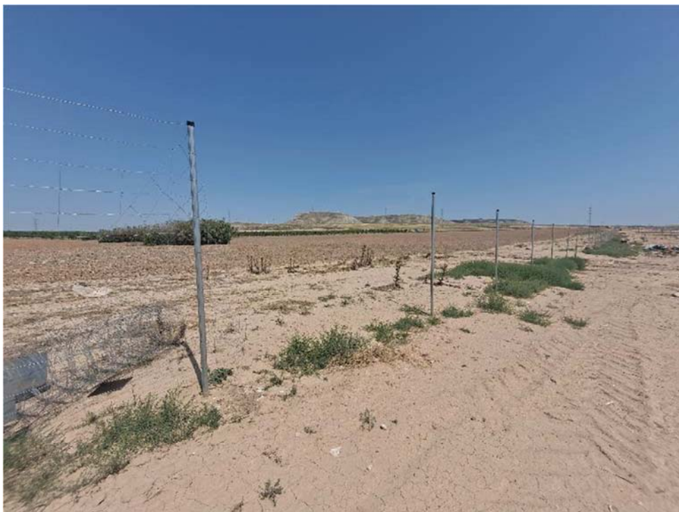
Figura 8.5. Tramo donde se ha desmontado el vallado en el límite noroeste