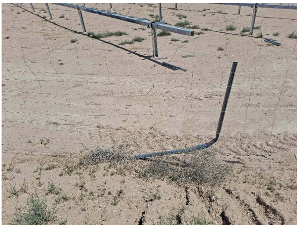
Figura 8.7. Poste doblado y vallado roto en el límite suroccidental de la parcela, dejando elementos punzantes peligrosos para la fauna