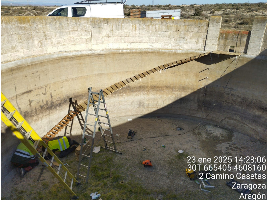
Ilustración 2. Construcción de bebederos – balsetes de fauna