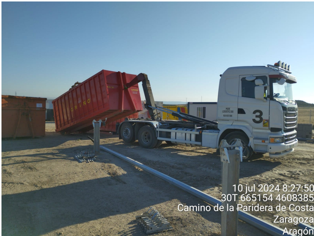
Ilustración 2. Residuos plásticos en el exterior de la zona de implantación junto al vallado del PFV