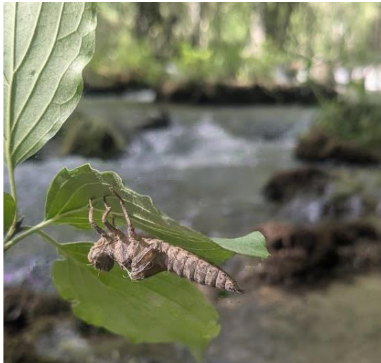
Foto. Última muda antes de emerger como adulto de una ninfa de libélula en vegetación de ribera del río Pitarque

Estanca de Alcañiz. Dadas las actuales condiciones del agua ocasionada por la excesiva proliferación de algas, se recomienda que la pesca de cualquier especie se realice en la modalidad de captura y suelta. Se exceptúa de lo anterior las especies incluidas en el Catálogo Español de Especies Exóticas Invasoras que pudieran ser sacrificadas y eliminadas del medio natural.