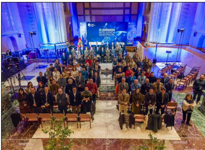
Imagen 6. Ponentes y asistentes

Una mirada diferente a las III Jornadas de Inteligencia Geoespacial: el dron captó a ponentes y asistentes reflejando, un año más la participación en este encuentro.