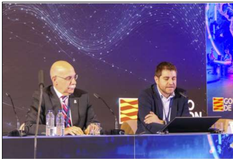
Imagen 5. Resumen de la jornada

La inteligencia del dato es la herramienta definitiva para la operatividad moderna, siempre que se garantice su calidad, integración y la correcta formación de quienes deben interpretarla.