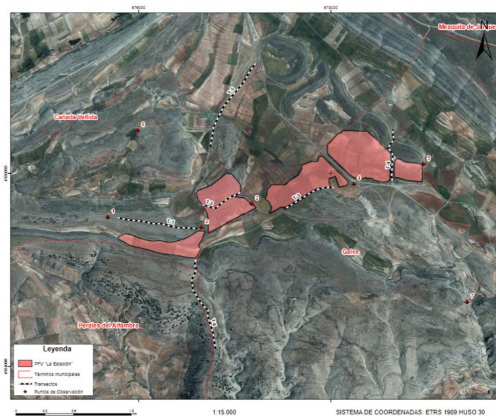
Ilustración 6: Puntos de observación y transectos para el informe preliminar de avifauna.

Los transectos se han realizado en coche a una velocidad inferior a 20 km/h y se ha anotado cada ejemplar avistado y/o escuchado. Los puntos seleccionados se han realizado con una duración de 30 minutos de espera en la cual también se anotan todos los ejemplares avistados y/o escuchado.