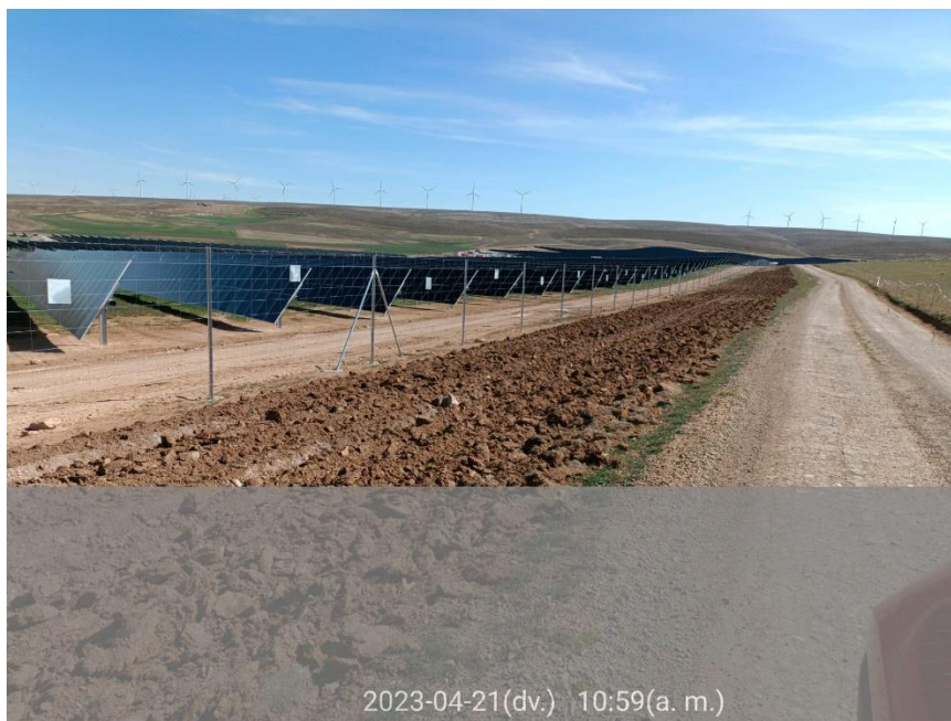
Ilustración 4. Arado de la zona 3