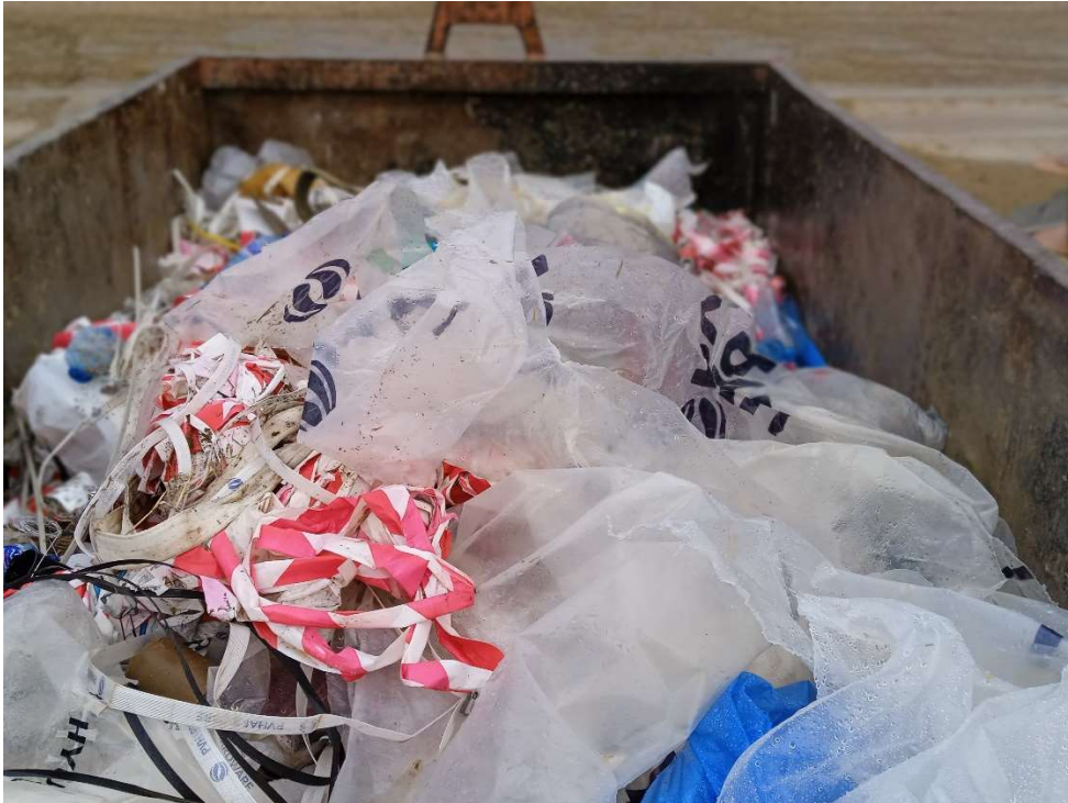
Imagen 7.- Contenedor de plásticos en el Punto limpio de Residuos no peligrosos.