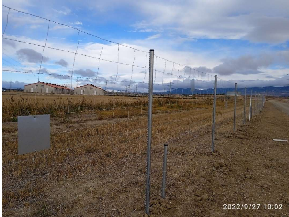
Imagen 1. Vallado perimetral finalizado. Se aprecia la luz de la malla, las placas metálicas anticolidión de avifauna y los pasos de fauna.