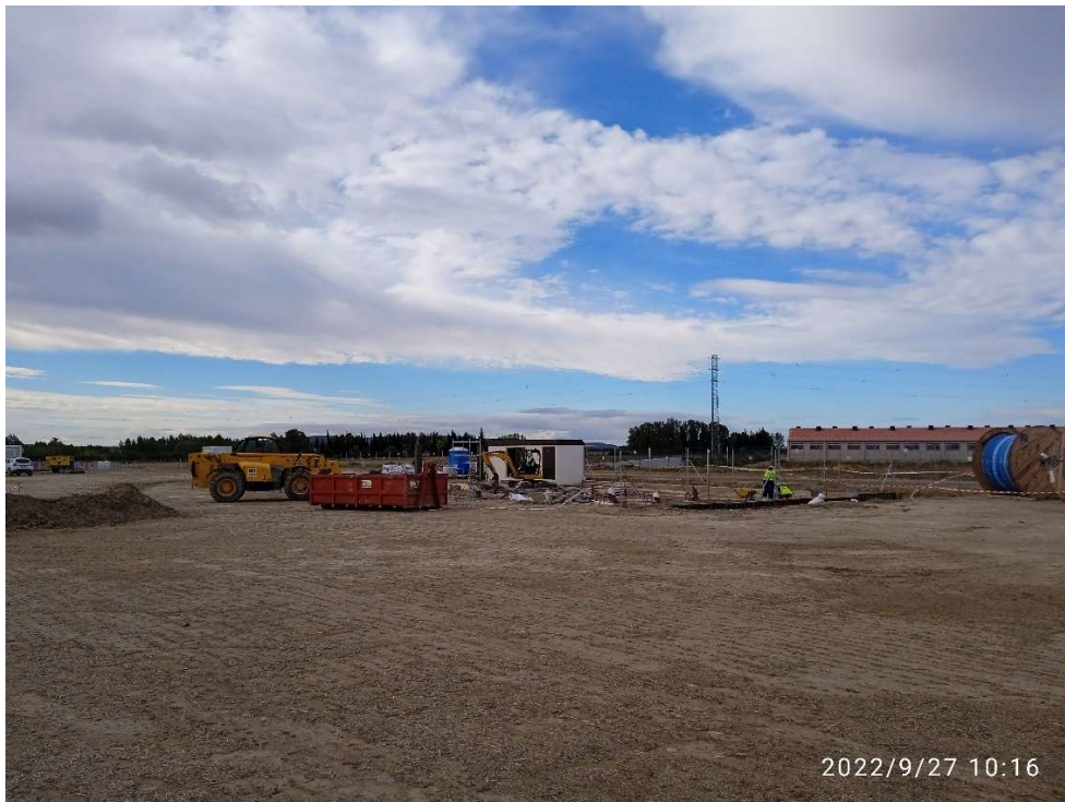
Imagen 8. Trabajos en la Subestación de Transformación.