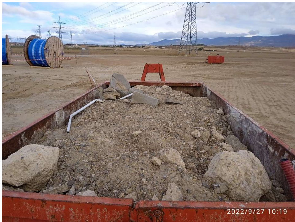
Imagen 13.- Contenedor para residuos de hormigón de una de las contratas.