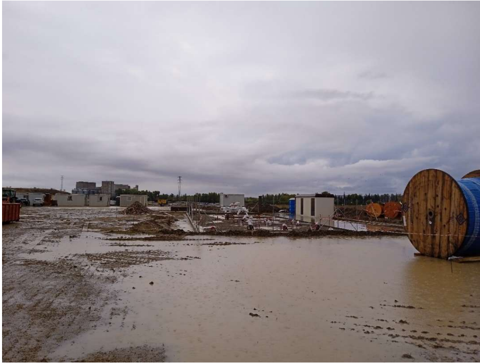
Imagen 5.- Trabajos en la Subestación de Transformación.