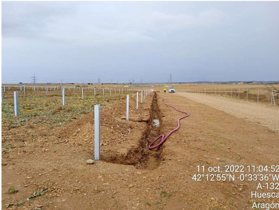
Imagen 3. Trabajos en las conducciones de baja tensión.