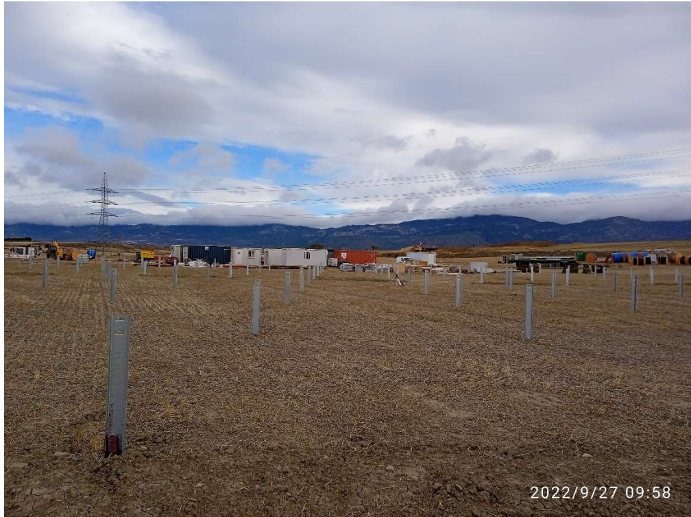
Imagen 5.- Postes de sujeción de los seguidores al lado de zona de instalaciones auxiliares.