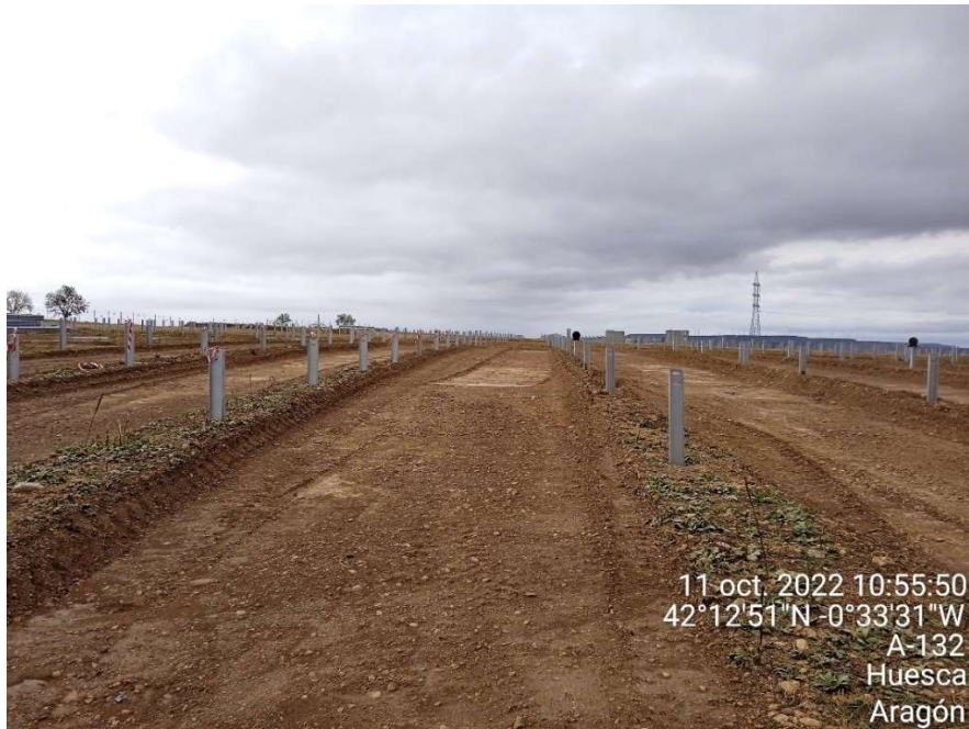
Imagen 1. Una de las zonas de la planta solar en la que se está rebajando el terreno para el buen funcionamiento de los seguidores.