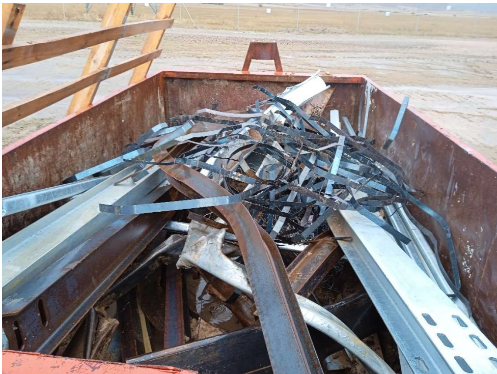
Imagen 8. Contenedor para metal del Punto limpio de Residuos no peligrosos.