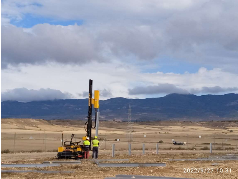
Imagen 3. Máquina hincadora colocando los postes de cimentación de los seguidores.