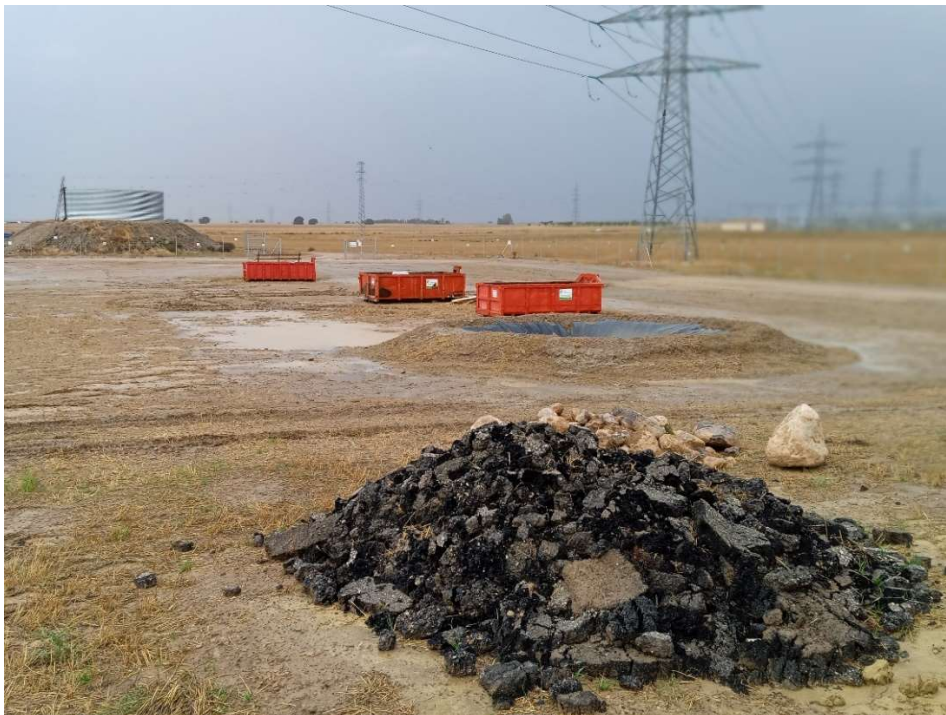
Imagen 6.- Punto limpio de Residuos no peligrosos.