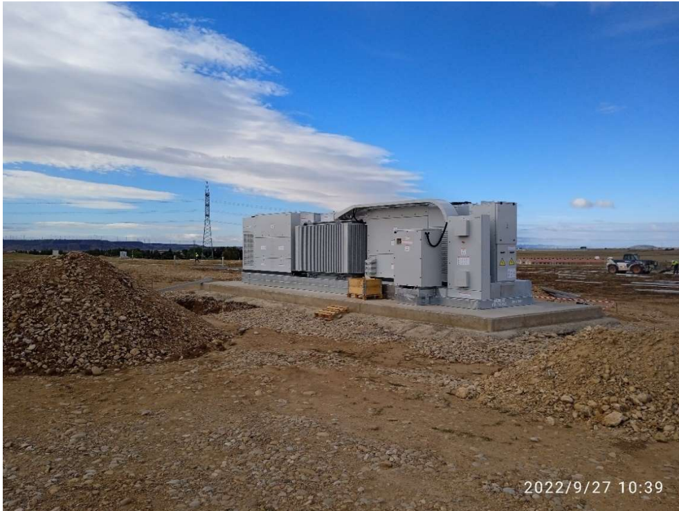
Imagen 7.- Trabajos en uno de los tres Centros de Transformación.