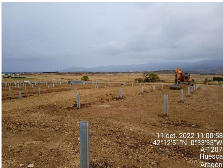
Imagen 2. Máquina trabajando para rebajar el terreno una vez colocados los postes de los seguidores.