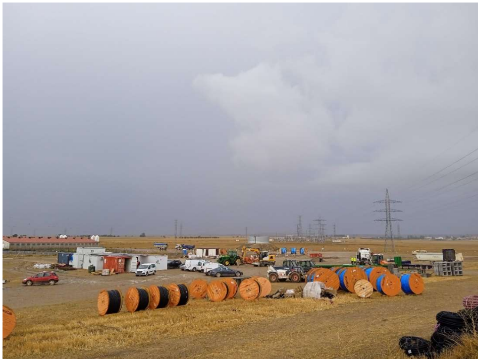
Imagen 4.- Vista general de la zona de Instalaciones auxiliares.