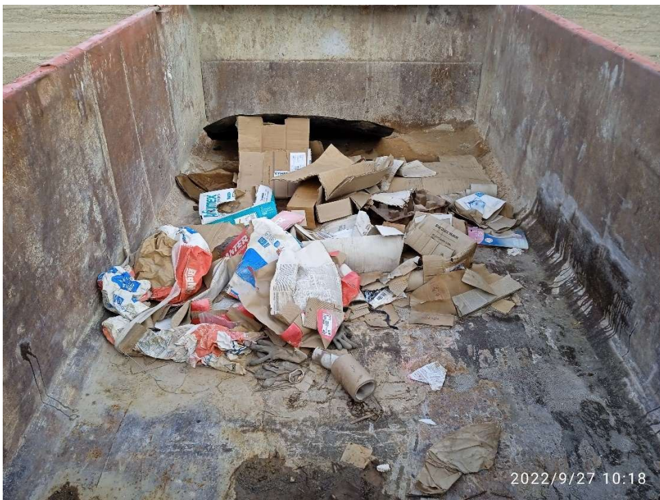
Imagen 12.- Contenedor para cartón del Punto limpio de Residuos no peligrosos.