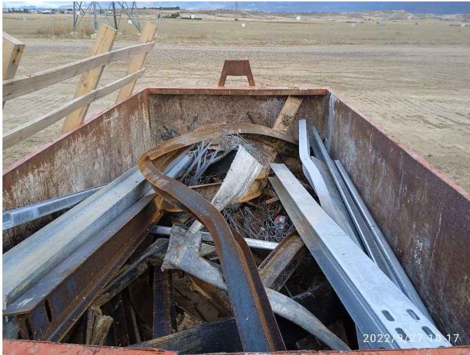
Imagen 11.- Contenedor para metal del Punto limpio de Residuos no peligrosos.