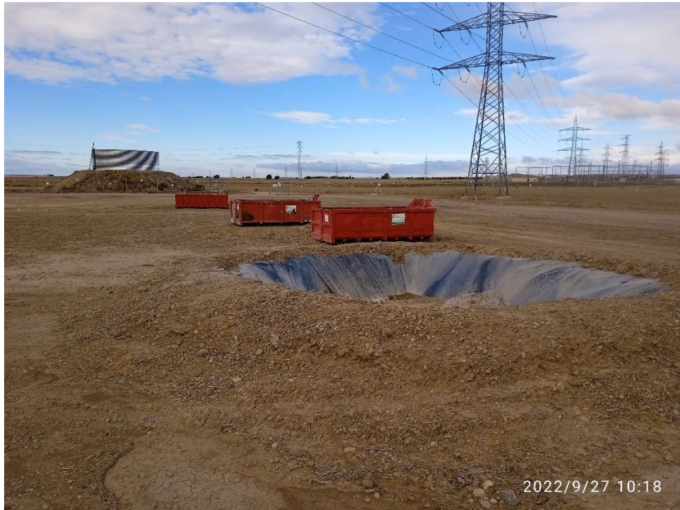
Imagen 9.- Punto limpio de Residuos no peligrosos.