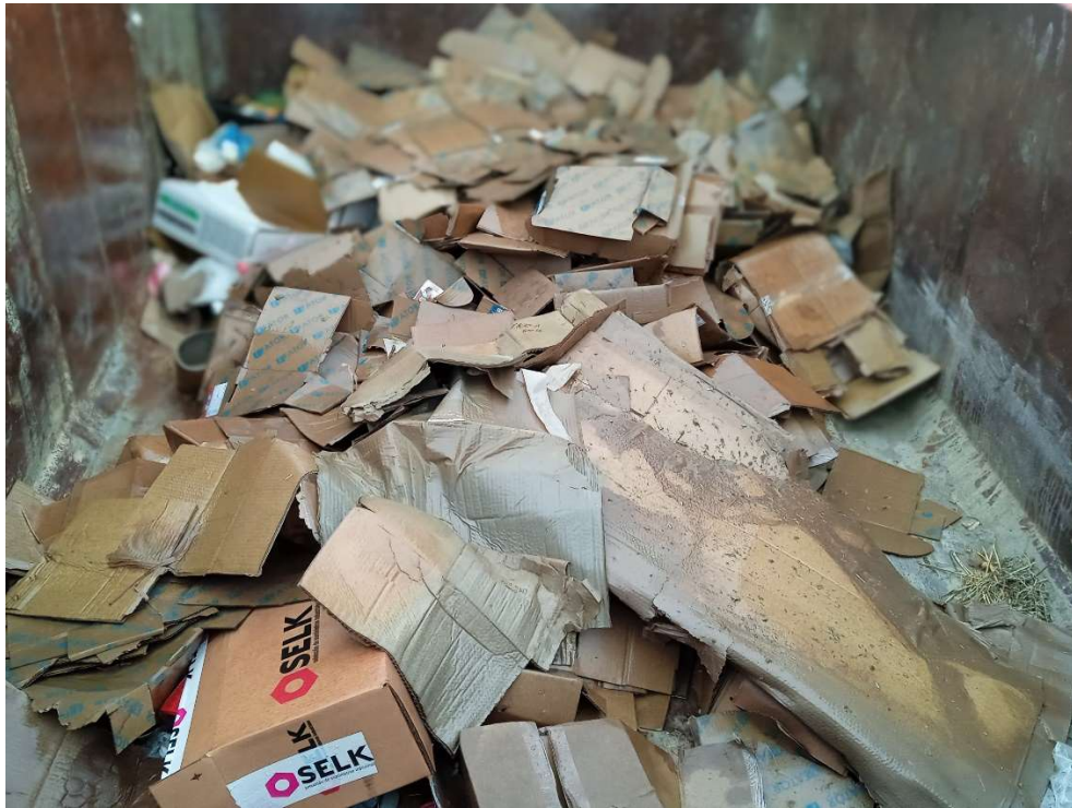
Imagen 9.- Contenedor para cartón del Punto limpio de Residuos no peligrosos.