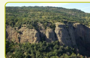
S-2 Ermita de San Voto "Dice la leyenda que aquí comenzó la historia del Monasterio Viejo"