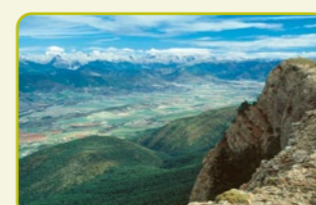
S-7 Subida a la Peña Oroel "Mirar el paisaje desde la cima del Monte Oroel, un regalo para los sentidos"