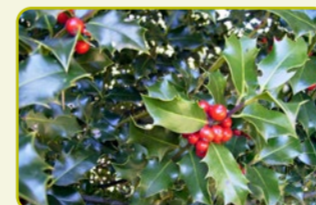
S-3 Ermita de Santa Teresa "Un paseo que invita al silencio"