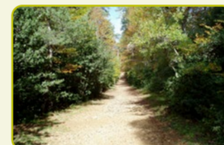
S-1 Balcón del Pirineo "Una mirada al norte".

La red está formada por un total de 8 senderos a pie ofertados: