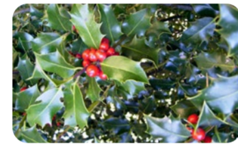
Acabo (Ilex aquifolium).