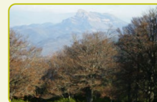
S-4 San Salvador "Todos los paisajes en un sendero"