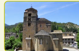
S-6 Monasterio Nuevo - Santa Cruz de la Serós "Por el Camino de Santiago"