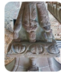
Capitel Monasterio Viejo.