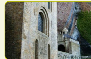
S-5 Monasterio Nuevo - Monasterio Viejo "El camino de los monjes"