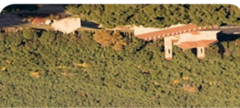
Vista aérea del Monasterio nuevo.