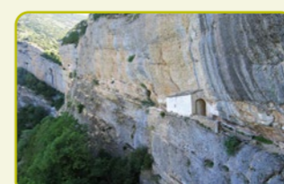
S-8 Santa Cilia - Ermita Virgen de la Peña "Una ermita incrustada en la pared de conglomerado"