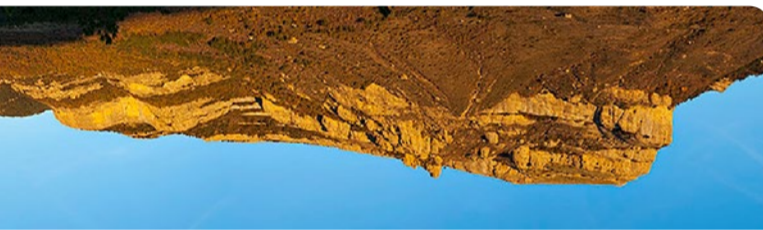
Vista panorámica de la cara Sur del Monte Oroel.