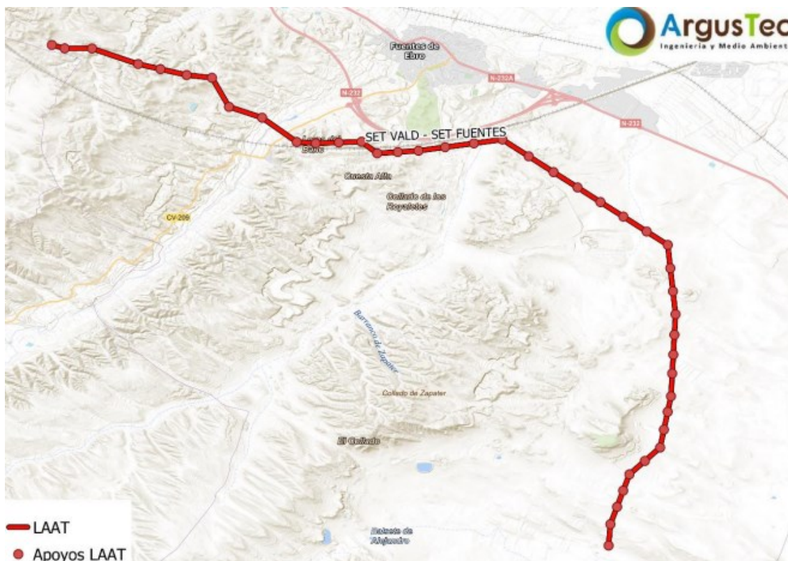
Figura 1 Localización del proyecto