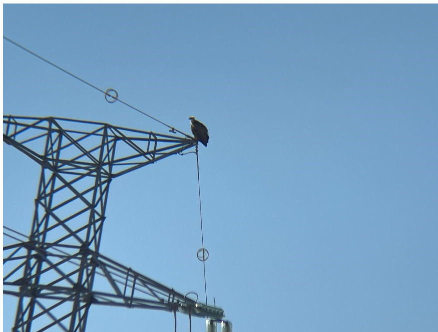
Figura 2 Buitre leonado (Gyps fulvus)

El presente anexo se compone de un número representativo de fotografías del total realizado durante el periodo evaluado, escogidas por su relevancia y/o carácter explicativo para la correcta comprensión del presente informe.