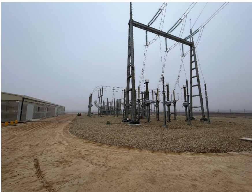
Figura 2 SET Valdompere

El presente anexo se compone de un número representativo de fotografías del total realizado durante el periodo evaluado, escogidas por su relevancia y/o carácter explicativo para la correcta comprensión del presente informe.