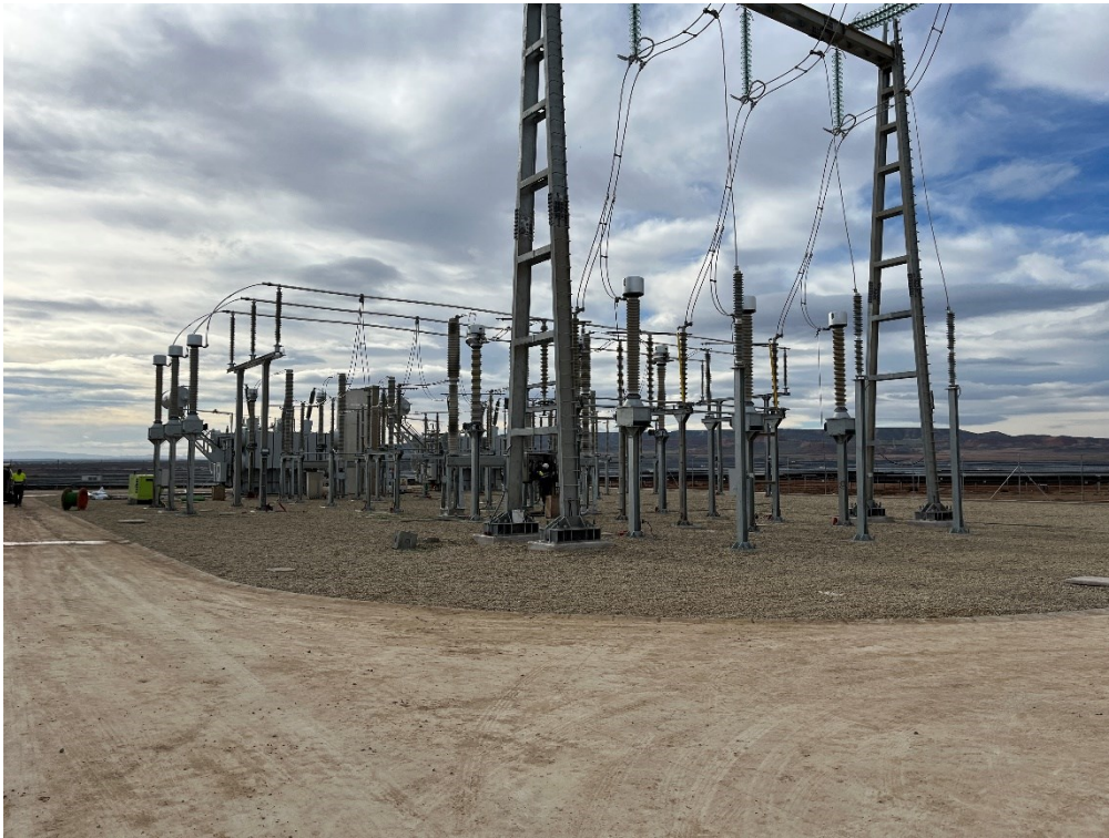
Figura 3 SET Valdompere