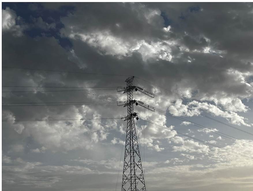
Figura 5 Fijación de cable Ap. 25

El presente anexo se compone de un número representativo de fotografías del total realizado durante el periodo evaluado, escogidas por su relevancia y/o carácter explicativo para la correcta comprensión del presente informe.