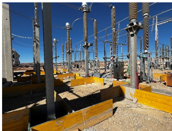
Figura 3 Cimentaciones Set Valdompere

Durante este mes, también se han avanzado con estos trabajos, realizando labores de cimentación de la Set Valdompere.