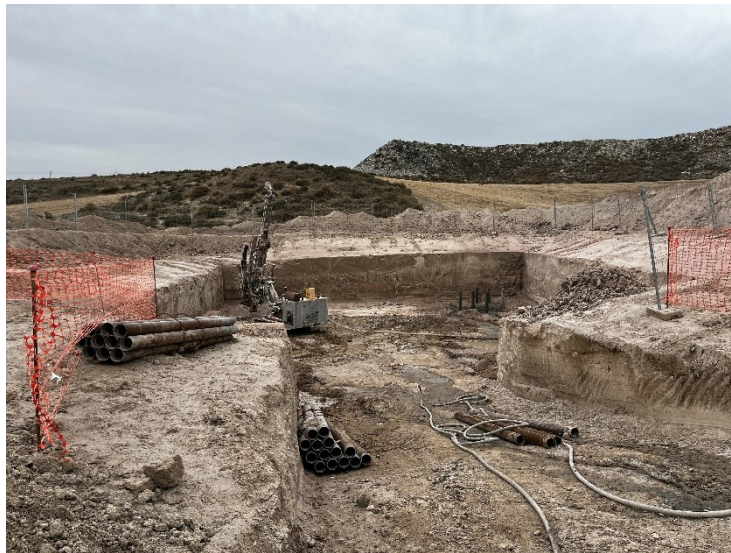
Figura 2 Excavación Ap. 35

Se ha llevado a cabo la excavación del apoyo 35.