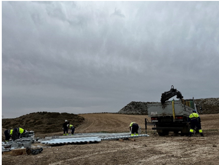
Figura 4 Montaje estructura apoyo 35

Así mismo, continúan los trabajos de montaje (Figura 4), todos estos trabajos han respetado las áreas de ocupación y no se han detectado afecciones. También se han continuado con la colocación del cable de alta tensión y de los protectores para aves.