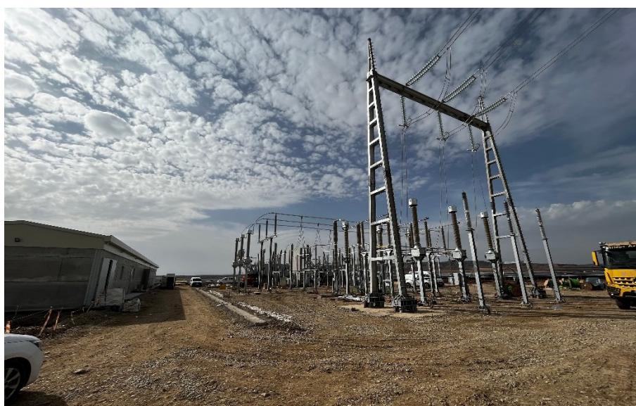
Figura 6 SET Valdompere