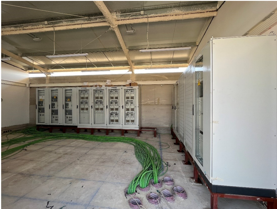
Figura 9 Cableado Set Valdompere