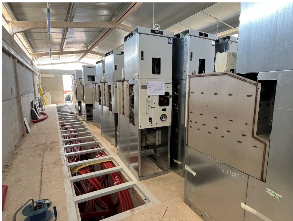
Figura 8 Cableado Set Valdompere