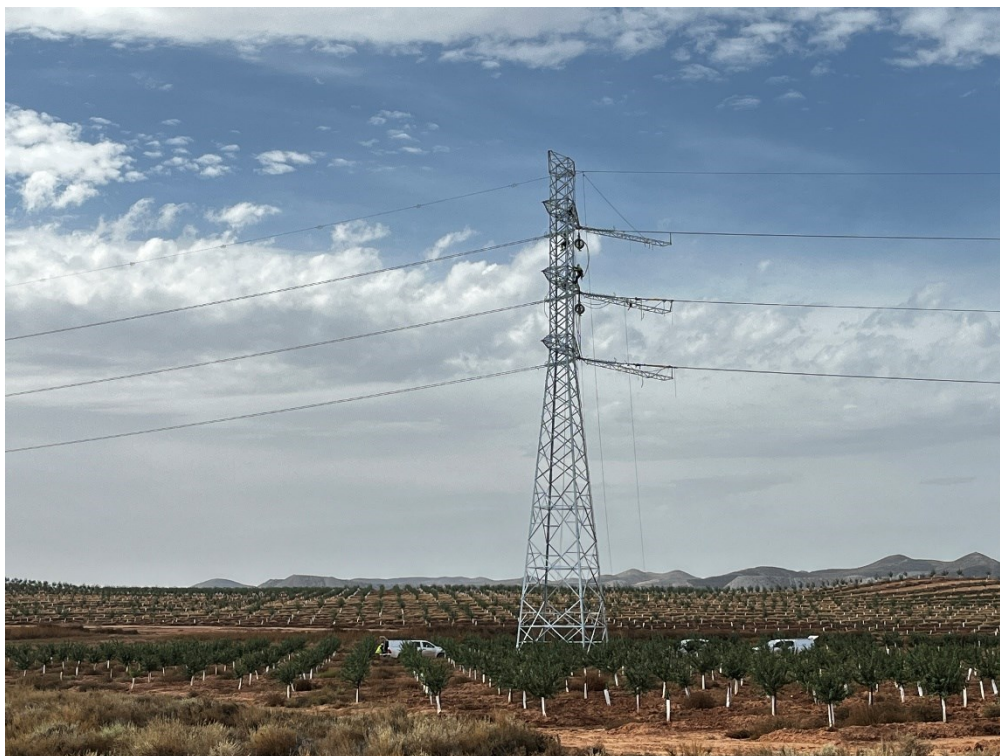
Figura 7 Fijación cable de alta tensión Ap. 15