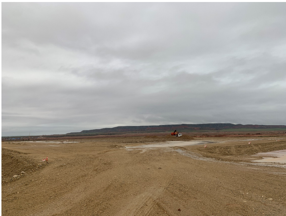
Figura 9 SET Valdompere