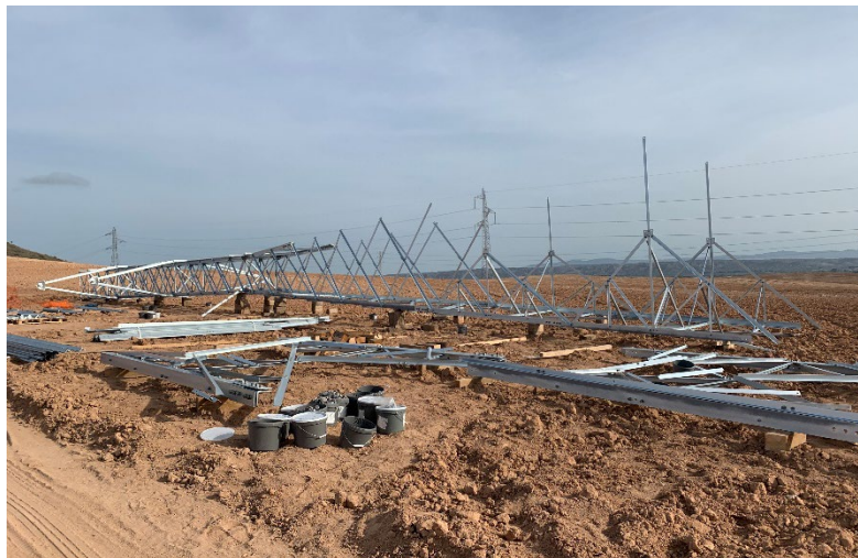
Figura 6 Montaje de la estructura del apoyo

Se mantiene un nivel de orden y limpieza óptimo, tras el acopio de materiales para la fase de construcción se está realizando dentro de las zonas delimitadas.