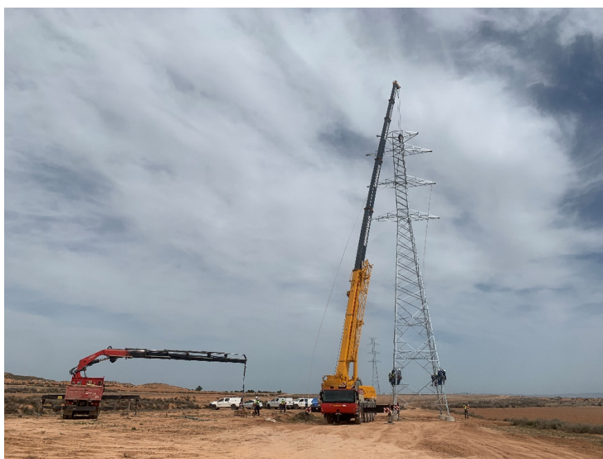
Figura 8 Izado del apoyo