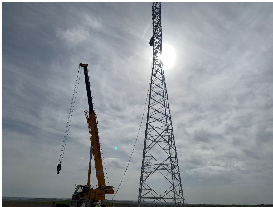
Figura 7 Izado del apoyo

El presente anexo se compone de un número representativo de fotografías del total realizado durante el periodo evaluado, escogidas por su relevancia y/o carácter explicativo para la correcta comprensión del presente informe.