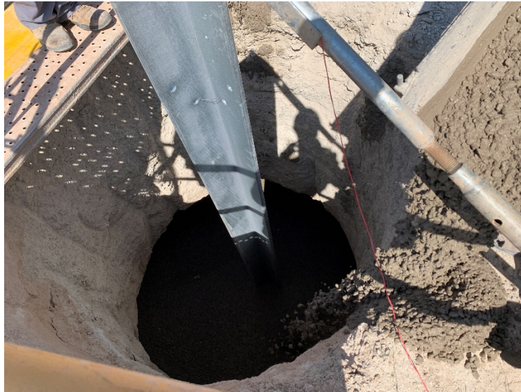
Figura 3 Cimentación de los apoyos

Durante este mes, también se han avanzado con estos trabajos, realizando labores de cimentación de alguno de los apoyos (Figura 3).