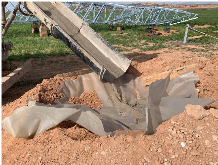
Figura 5 Lavadero de cuba de hormigón

Se ha comprobado que se ha llevado a cabo la separación de tierra vegetal y estériles de forma correcta, acopiándolo en ubicación diferentes. También se ha habilitado en cada uno de los apoyos una zona para la limpieza de cubas de hormigón (Figura 5). Que consiste en la colocación de un geotextil sobre el acopio de áridos.