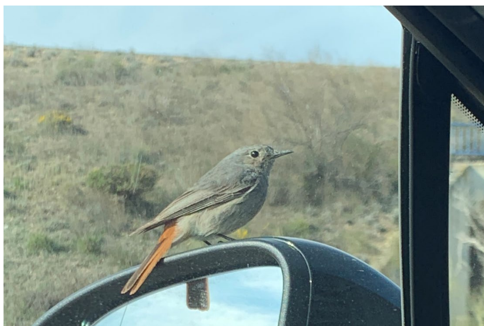
Figura 10 Colirrojo Tizón (Phoenicurus ochruros)