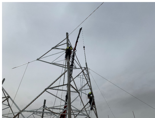
Figura 4 Montaje de la estructura

Así mismo, se han iniciado los trabajos de montaje (Figura 4) e izado de los apoyos, todos estos trabajos han respetado las áreas de ocupación y no se han detectado afecciones.