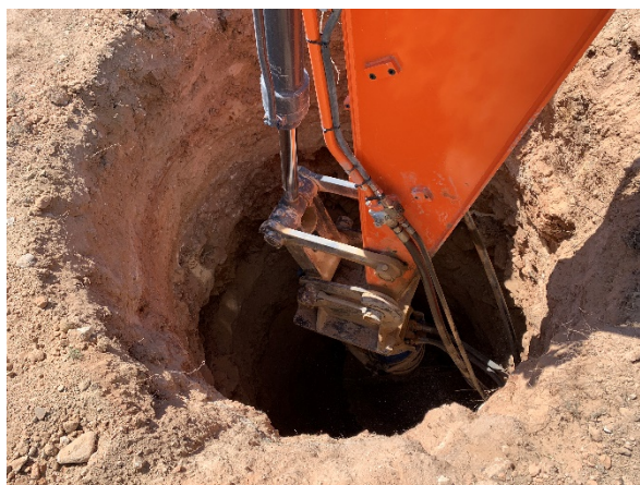
Figura 2 Excavación de los cimientos del apoyo

Esta actividad se ha desarrollado principalmente con la excavación de los cimientos de los apoyos (Figura 2) para su posterior hormigonado y en la apertura de los accesos.