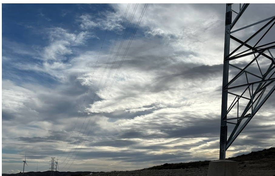
Figura 5 Tirada de cable de alta tensión Ap. 35-Ap.36