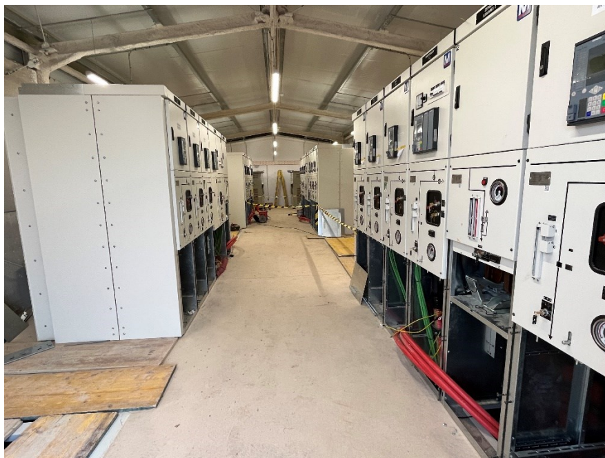
Figura 4 Cableado de los armarios SET Valdompere

El presente anexo se compone de un número representativo de fotografías del total realizado durante el periodo evaluado, escogidas por su relevancia y/o carácter explicativo para la correcta comprensión del presente informe.