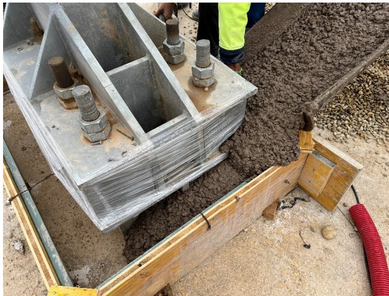
Figura 2 Cimentación SET Valdompere

Durante este mes, también se han avanzado con estos trabajos, realizando labores de cimentación de la Set Valdompere.