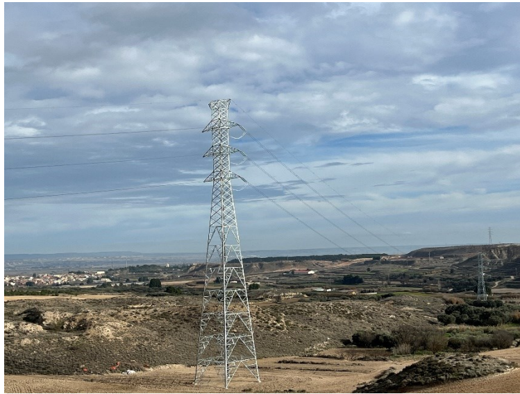
Figura 3 Apoyo 35