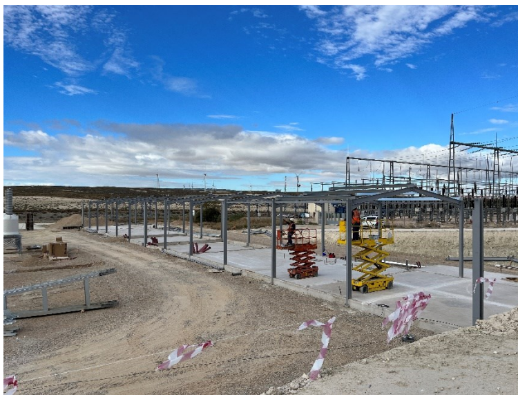
Figura 3 CS Ave

Durante este mes, también se han avanzado con estos trabajos, realizando labores de cimentación en las subestaciones.