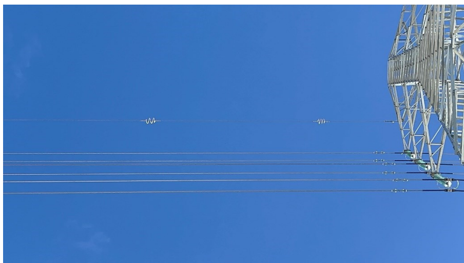
Figura 4 Colocación cable de los protectores para aves

Así mismo, se ha continuado con la tirada del cable de alta tensión y con la colocación de los protectores para aves.