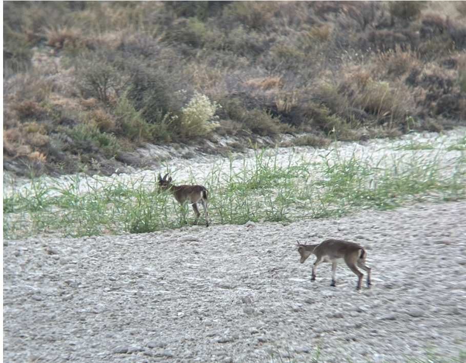
Figura 11 Pareja de cabras