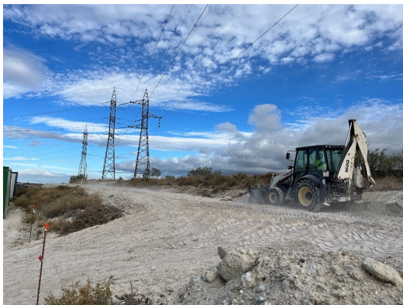
Figura 2 Movimiento de tierras

Se han habilitado accesos para los apoyos restantes.