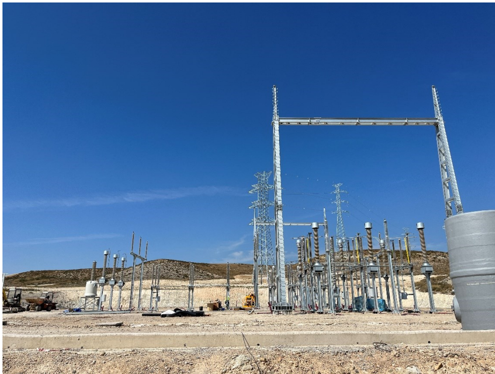
Figura 9 SET Fuentes