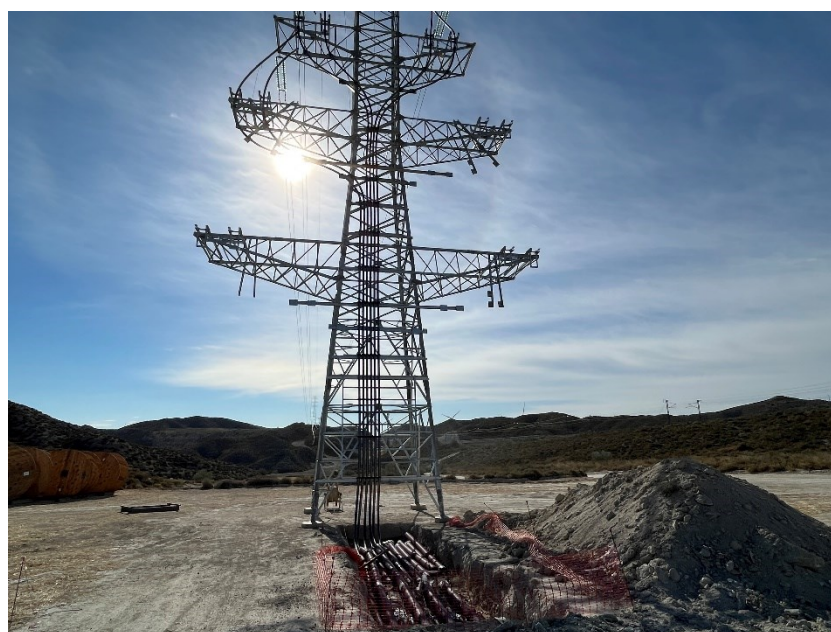
Figura 8 Tendido cable línea soterrada