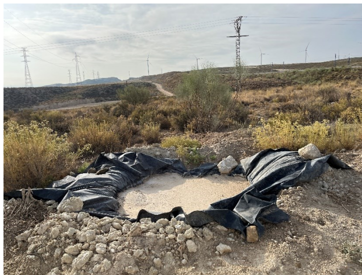
Figura 5 Lavadero de cubas de CS Ave

Se ha comprobado que se ha llevado a cabo la separación de tierra vegetal y estériles de forma correcta, acopiándolo en ubicación diferentes. También se ha habilitado en cada una de las subestaciones una zona para la limpieza de cubas de hormigón. Que consiste en la colocación de un geotextil sobre el acopio de áridos.