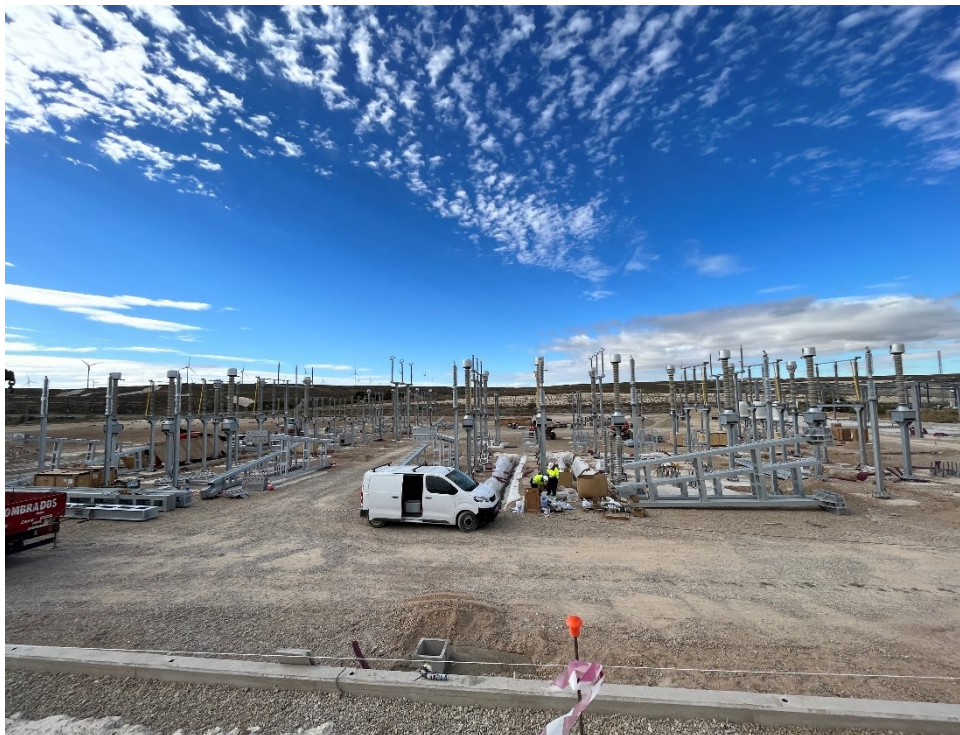
Figura 12 CS Ave