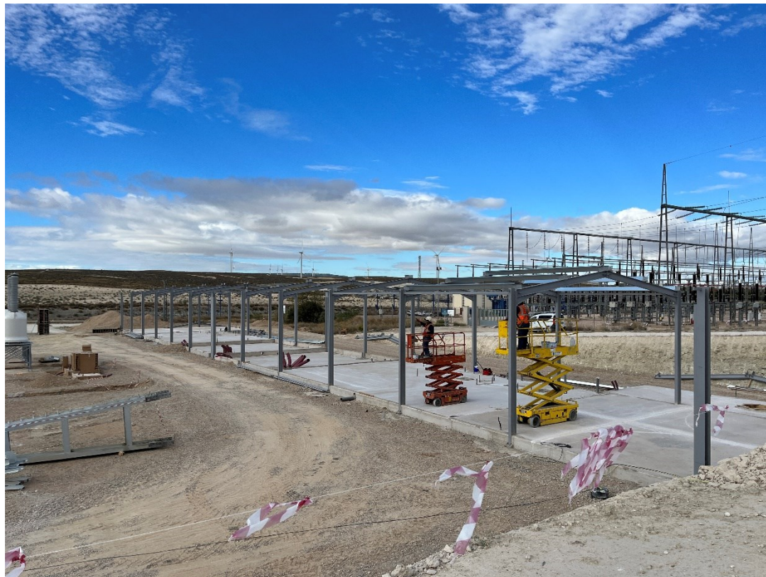
Figura 13 CS Ave