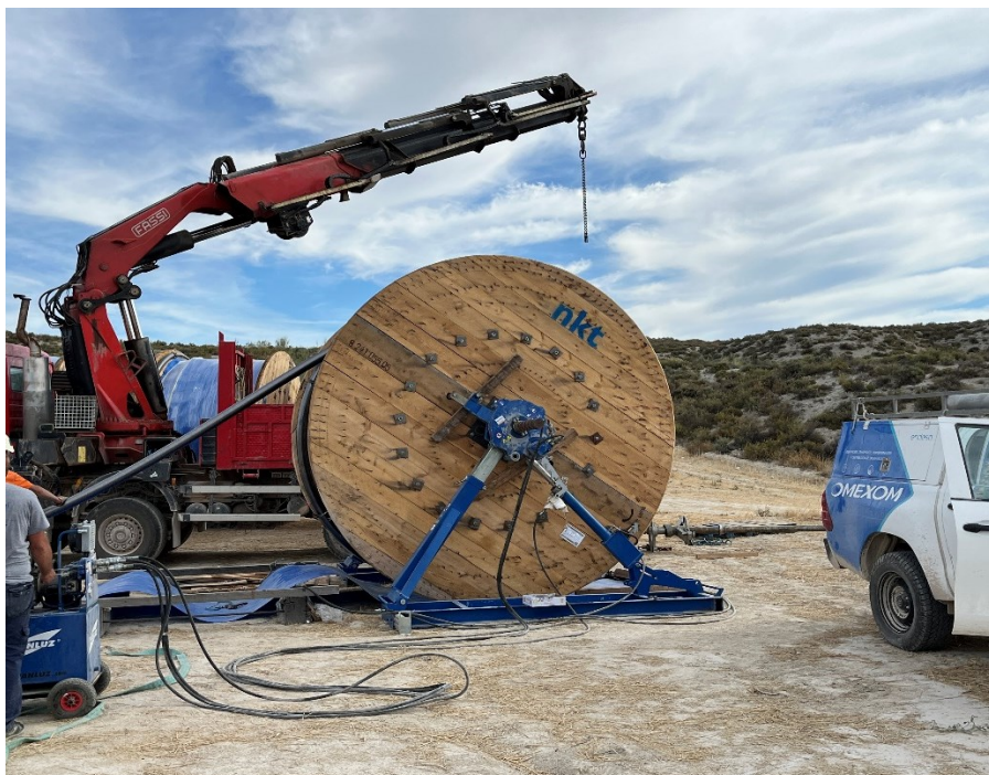
Figura 7 Tendido cable línea soterrada

El presente anexo se compone de un número representativo de fotografías del total realizado durante el periodo evaluado, escogidas por su relevancia y/o carácter explicativo para la correcta comprensión del presente informe.