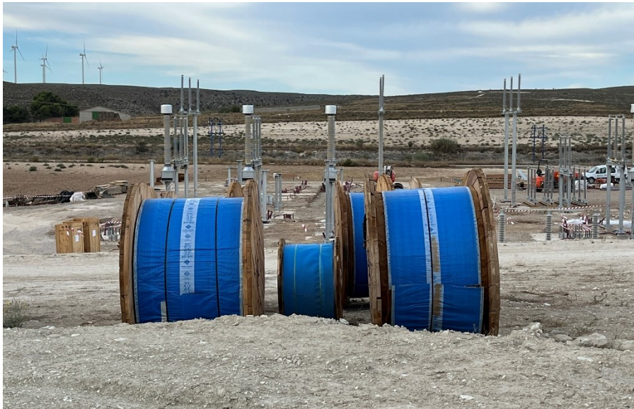
Figura 6 Acopio del cable de alta tensión

Se mantiene un nivel de orden y limpieza óptimo, tras el acopio de materiales para la fase de construcción se está realizando dentro de las zonas delimitadas.