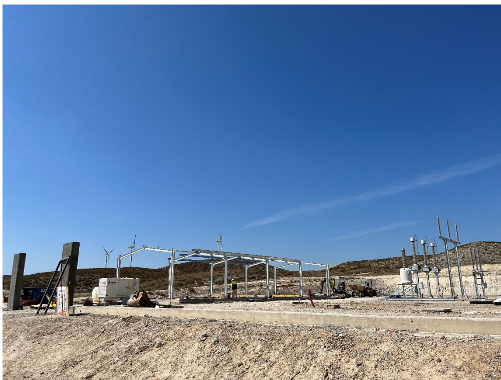
Figura 10 SET Fuentes