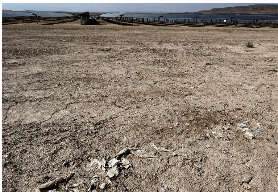
Figura 4 Restos de plásticos