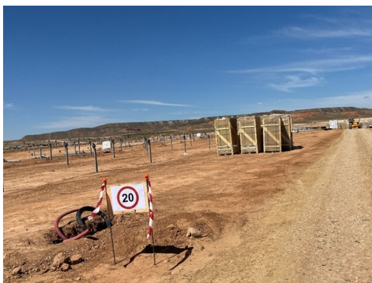
Figura 2 Señalización en obra

La obra dispone de cuba de agua y se realizan riesgos con regularidad. Además, la obra cuenta con un límite de velocidad establecido de 20km/h para reducir de esta forma las emisiones de polvo.