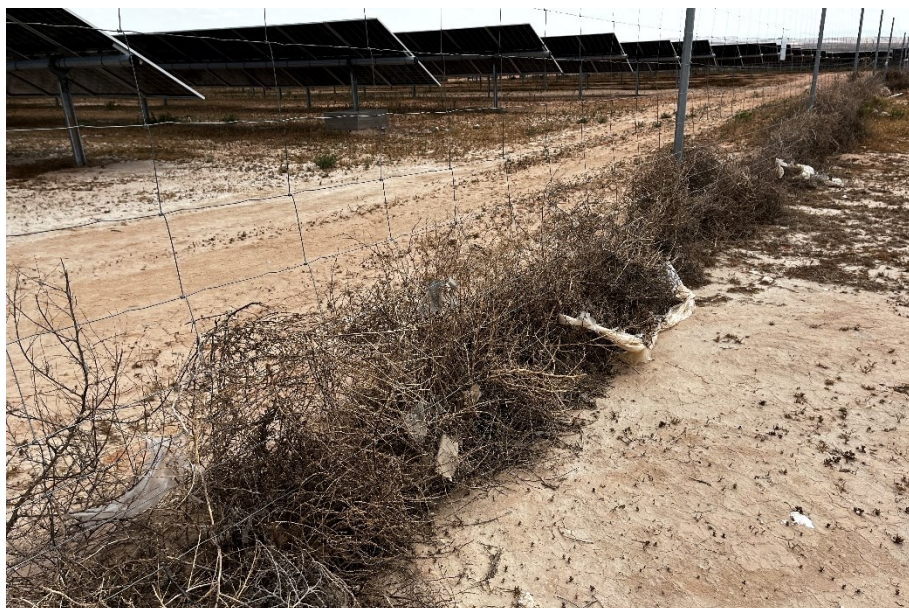
Figura 3 Restos de plásticos

El presente anexo se compone de un número representativo de fotografías del total realizado durante el periodo evaluado, escogidas por su relevancia y/o carácter explicativo para la correcta comprensión del presente informe.