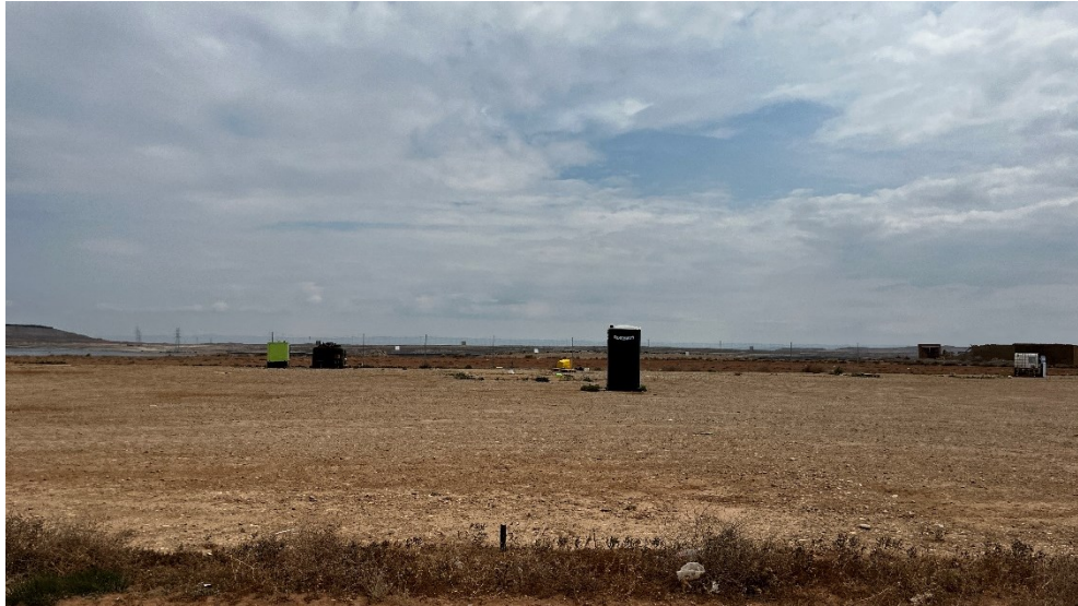
Figura 5 Desmantelamiento de la zona de casetas