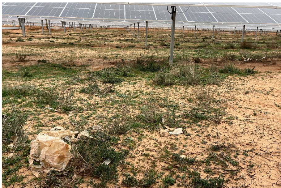
Figura 3 Restos de plásticos

El presente anexo se compone de un número representativo de fotografías del total realizado durante el periodo evaluado, escogidas por su relevancia y/o carácter explicativo para la correcta comprensión del presente informe.