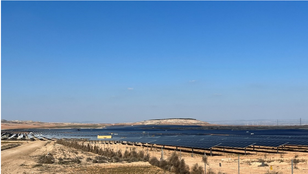
Figura 5 Valdompere 3