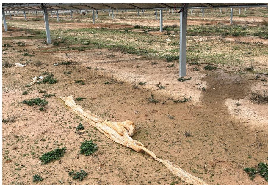
Figura 4 Restos de plásticos