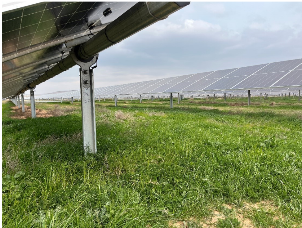
Figura 6 Crecimiento de la vegetación