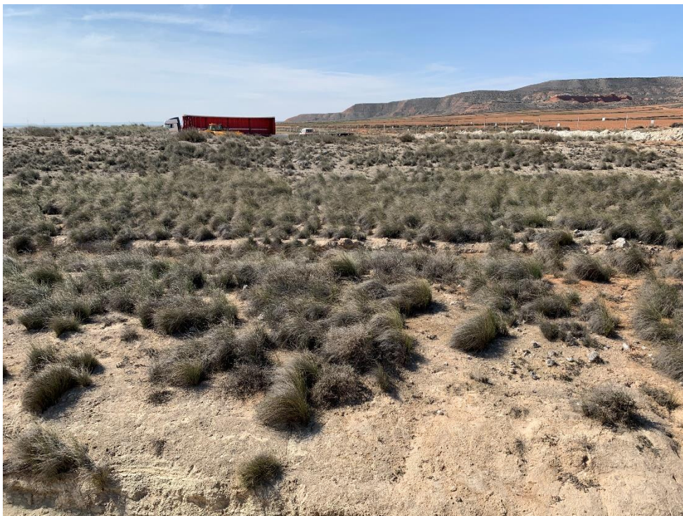
Figura 8 Zona de vegetación natural