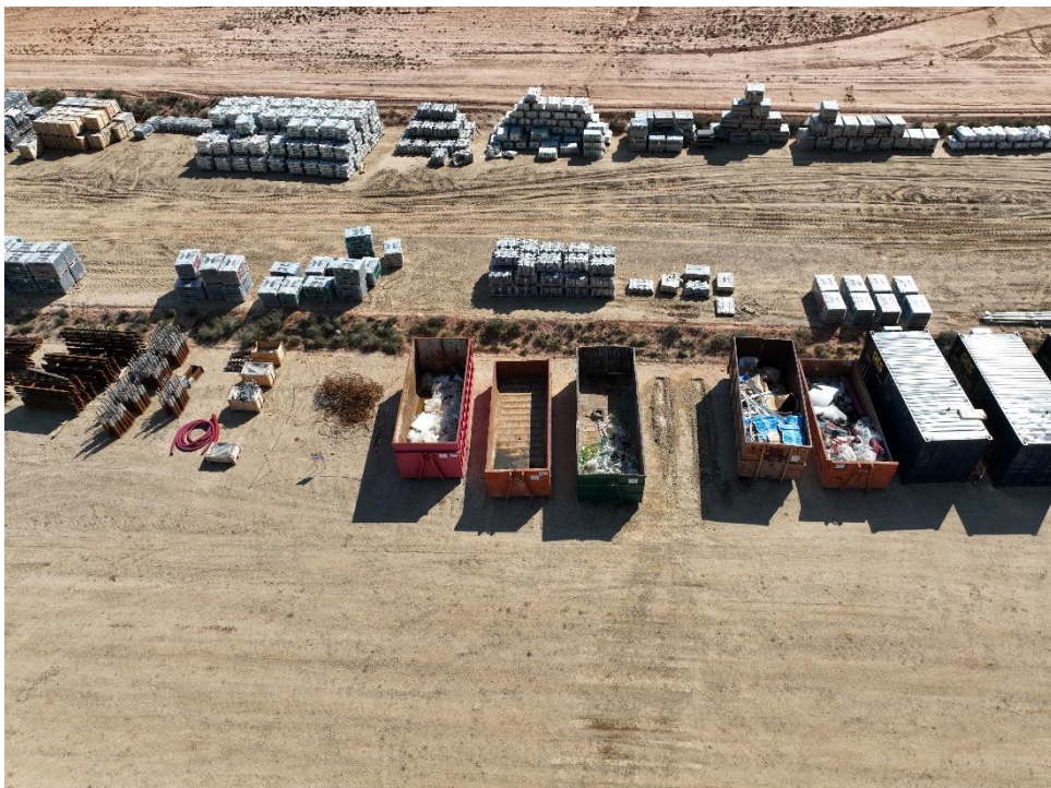
Figura 12 Punto limpio de residuos no peligrosos