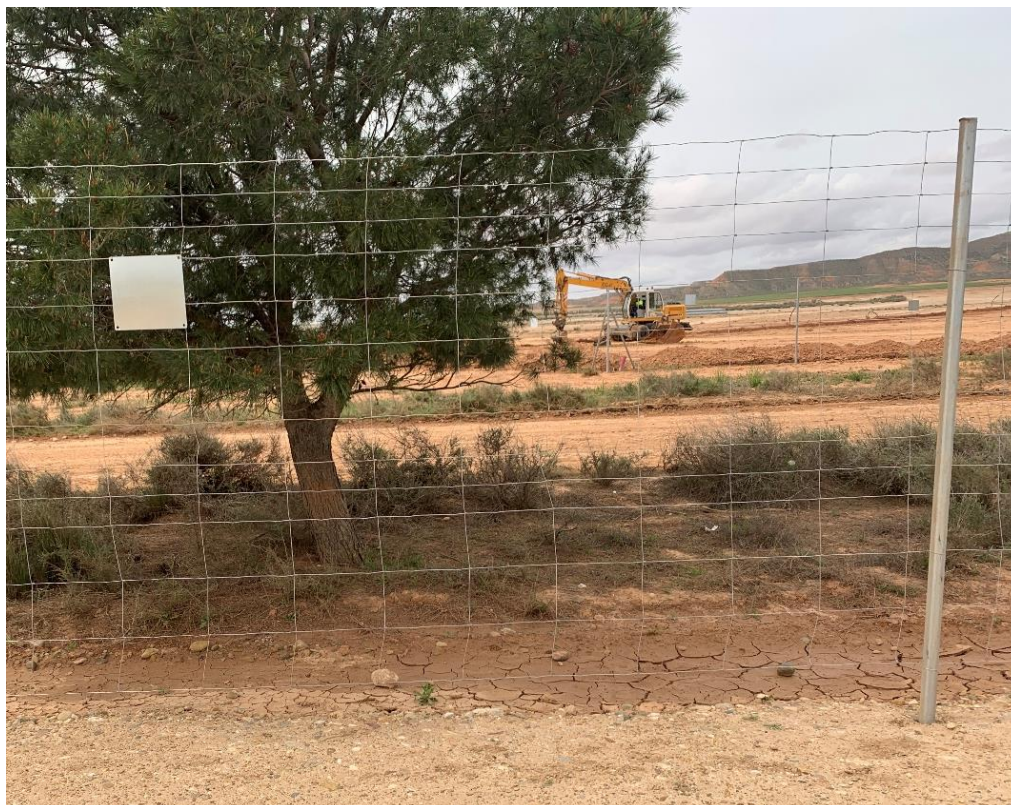
Figura 13 Vallado perimetral de la zona de casetas subsanado