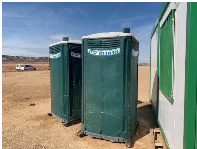
Figura 4 Baños químicos

La ejecución de los trabajos no afecta a cauces ni cursos de agua, tanto temporales como permanentes y la gestión de aguas residuales (baños químicos) se realiza correctamente.