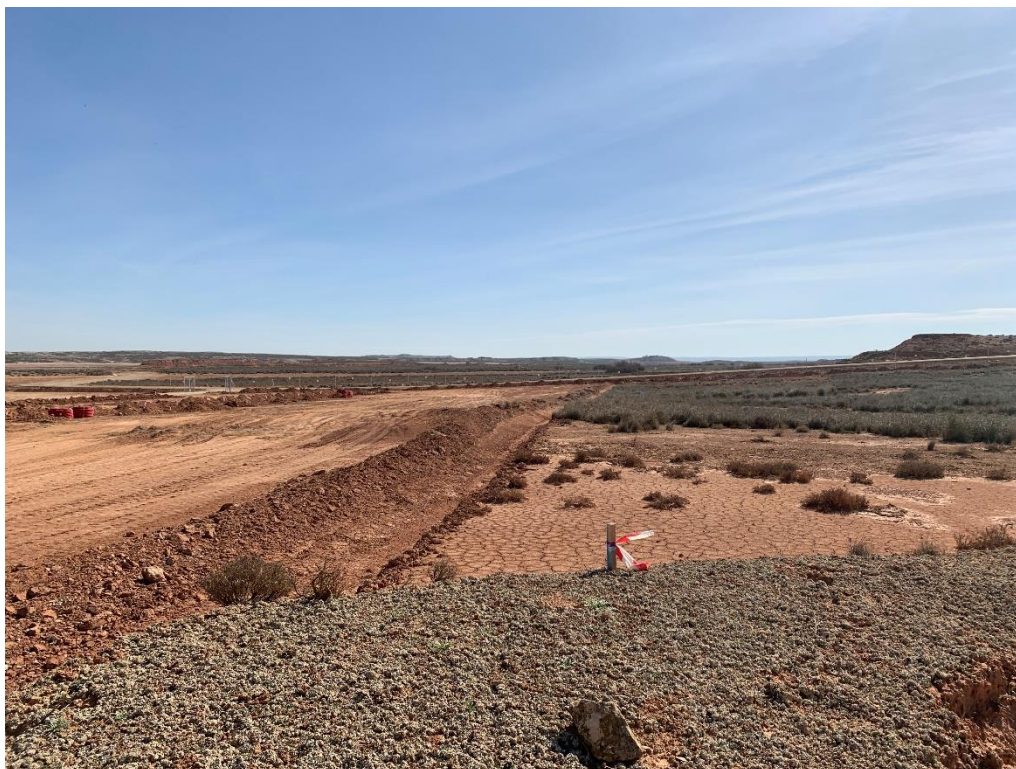
Figura 9 Zona de vegetación natural