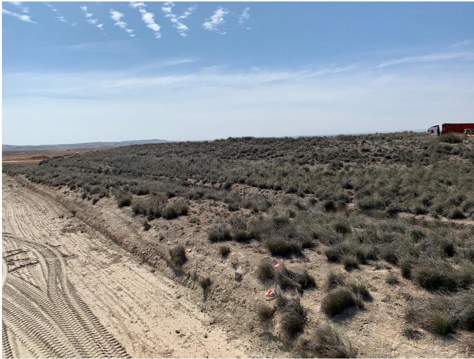
Figura 7 Zona de vegetación natural