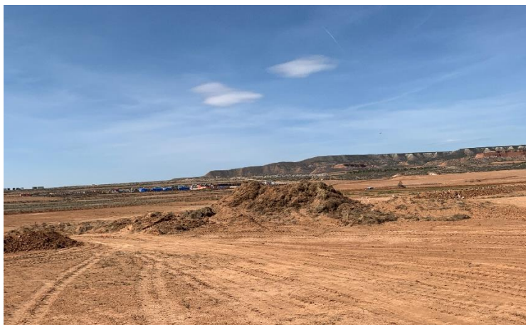
Figura 3 Acopio de tierra vegetal

Se ha comprobado y evaluado que se ha llevado a cabo la separación de tierra vegetal y estériles de forma correcta, acopiándolo en diferentes ubicaciones.