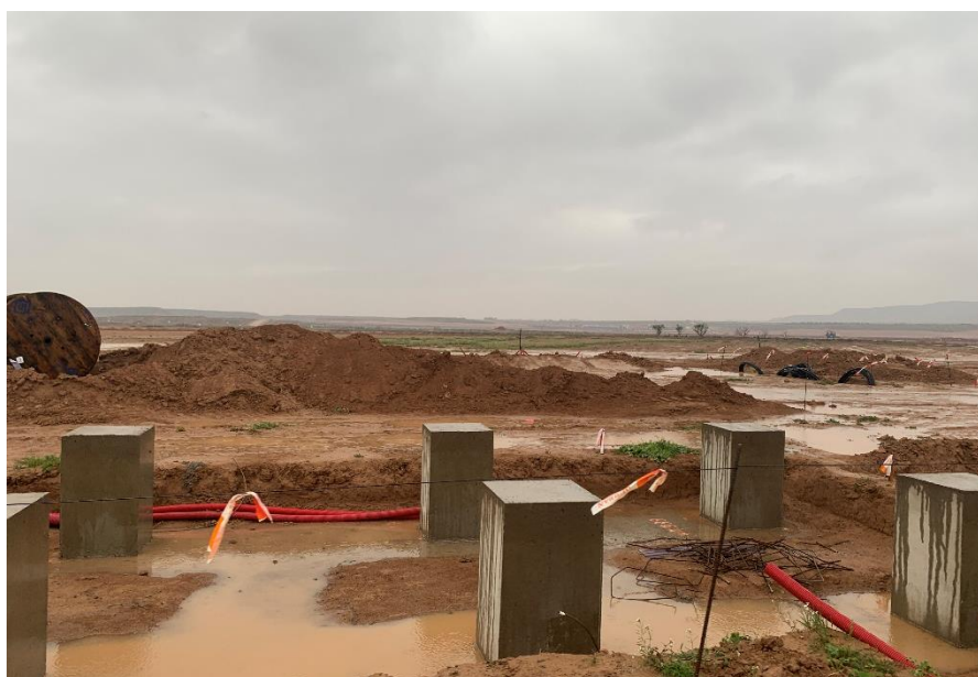
Figura 6 Hormigonado de los pilares del CT