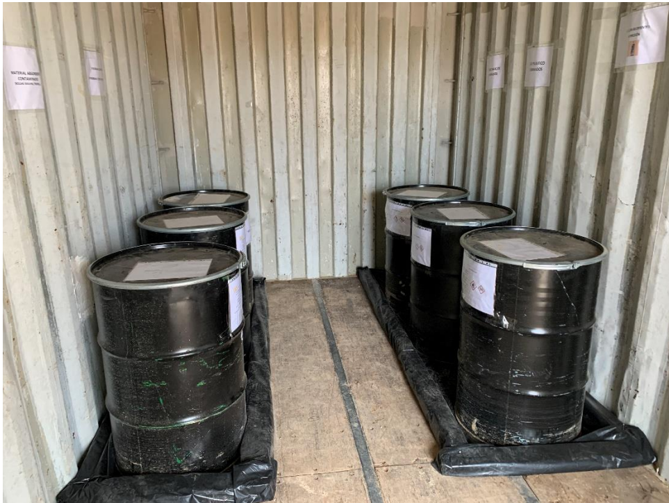
Figura 11 Punto limpio de residuos peligrosos