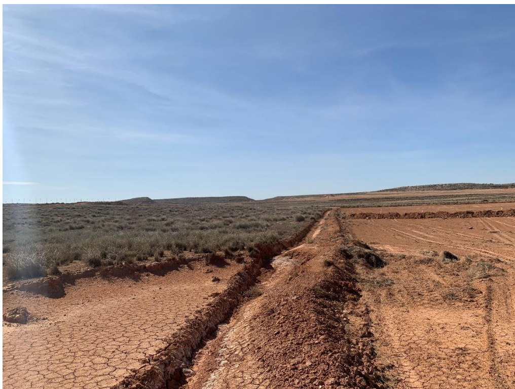
Figura 10 Zona de vegetación natural