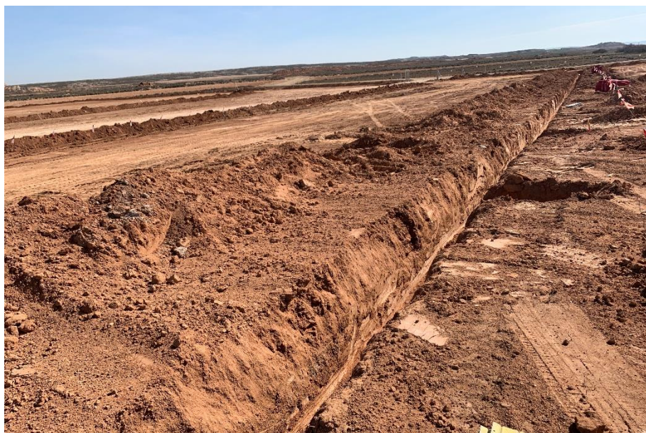
Figura 5 Zanjas para la RMT

El presente anexo se compone de un número representativo de fotografías del total realizado durante el periodo evaluado, escogidas por su relevancia y/o carácter explicativo para la correcta comprensión del presente informe.