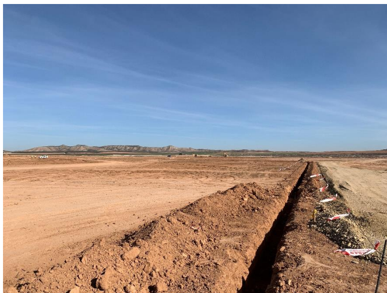
Figura 2 Apertura de zanjas

Esta actividad se ha desarrollado principalmente con los movimientos de tierras y acondicionamiento del terreno, apertura de viales, zanjas de red de media tensión (Figura 2) y desbroces.