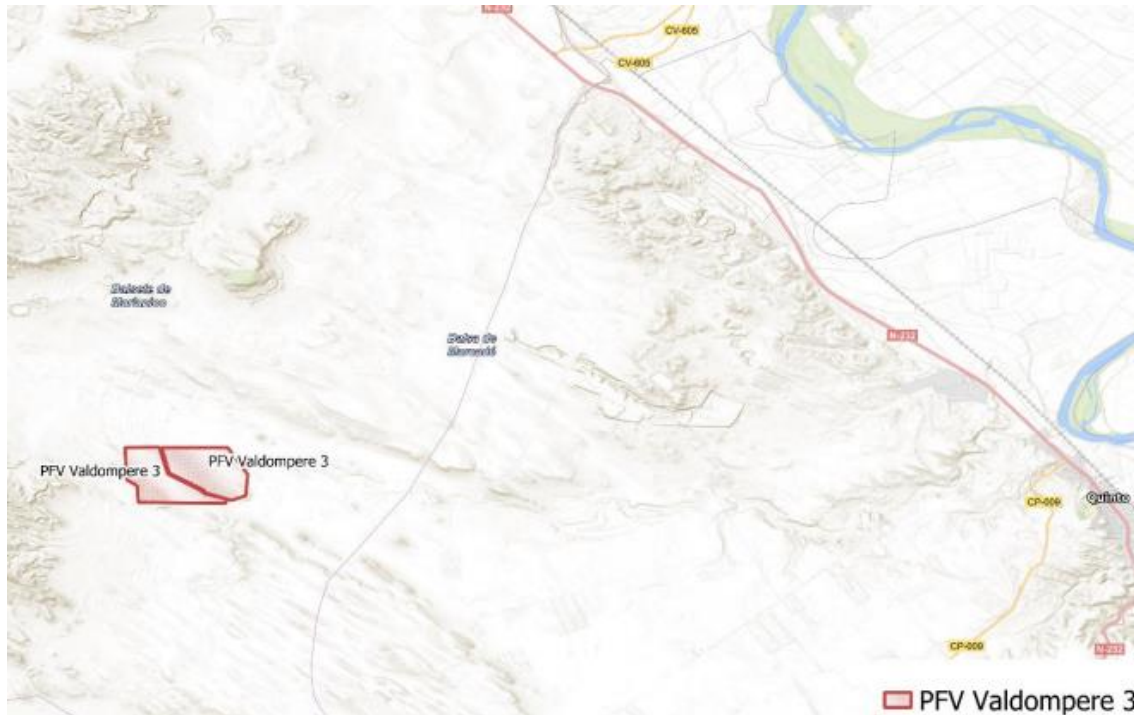
Figura 1 Localización del proyecto