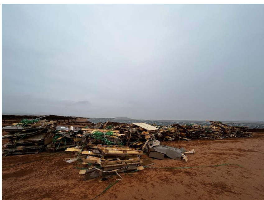
Figura 3 Acopio temporal de residuos

El punto limpio de residuos no peligrosos de la zona de acopio logístico y el dispuesto dentro de la planta, consta de cinco contenedores, uno para restos plásticos (bolsa de basura, botellas, tubos corrugados...), cartón, flejes, madera y plástico blando. También hay una zona para los restos de ferralla.