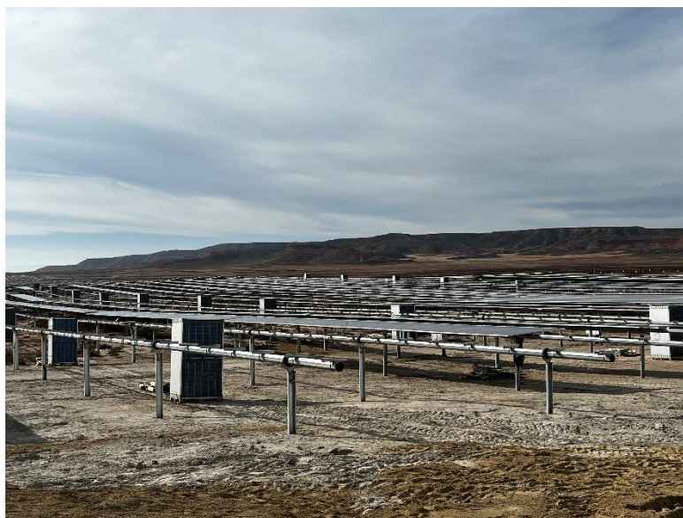
Figura 2 Montaje de los módulos fotovoltaicos

Se ha continuado con el montaje de los módulos fotovoltaicos.