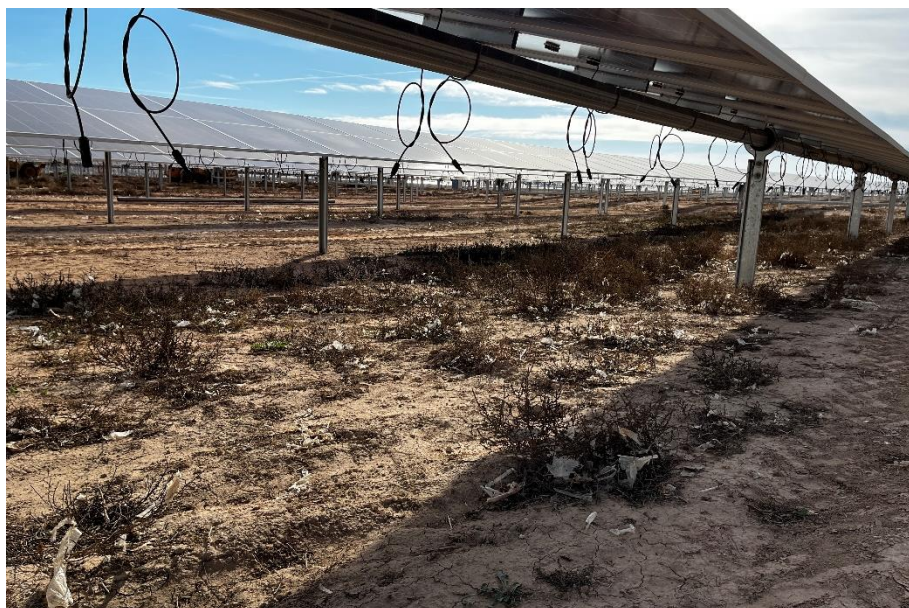
Figura 5 Red de drenaje

El presente anexo se compone de un número representativo de fotografías del total realizado durante el periodo evaluado, escogidas por su relevancia y/o carácter explicativo para la correcta comprensión del presente informe.