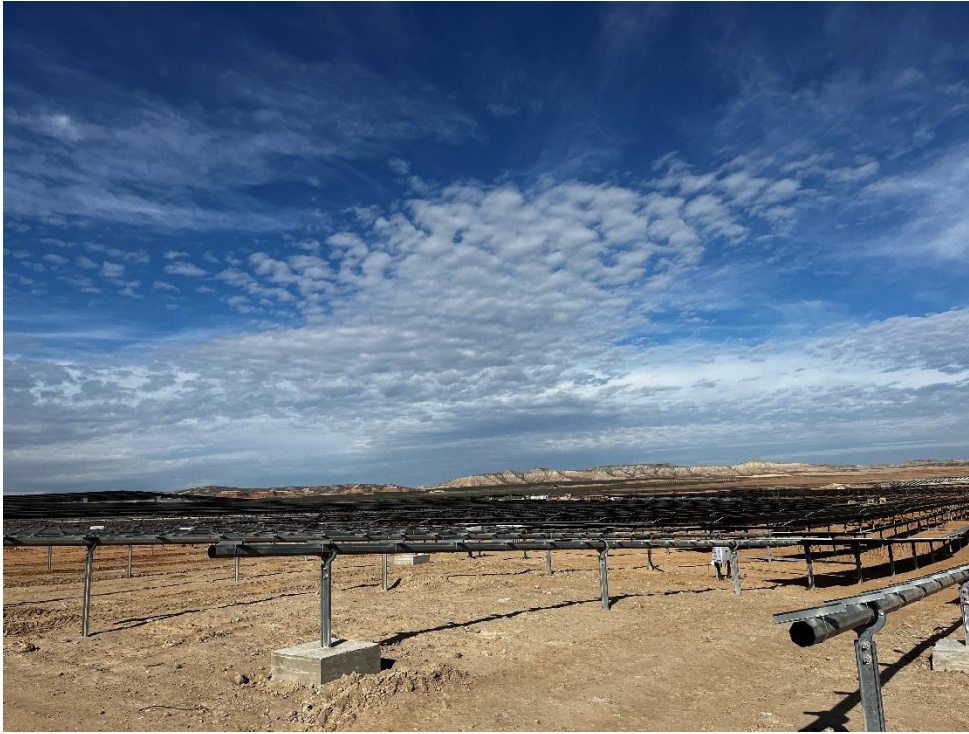
Figura 7 Montaje de los torques