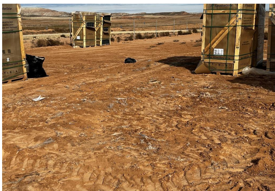
Figura 6 Restos de plásticos