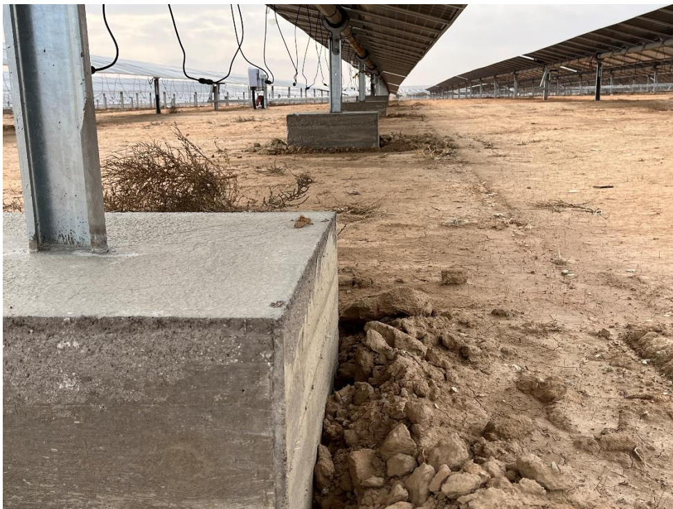
Figura 8 Cimentación de las hincas