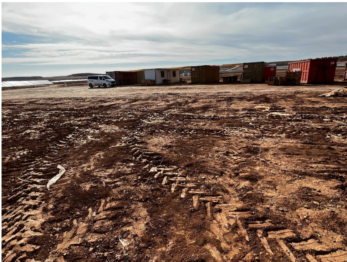
Figura 9 Restos de plásticos