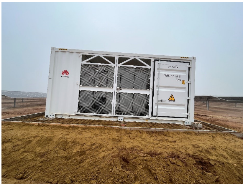
Figura 2 Encofrado para la cimentación de la base del CT

Se ha preparado para cimentar diferentes puntos del vial interno con mayor probabilidad erosiva y la base de los CT.