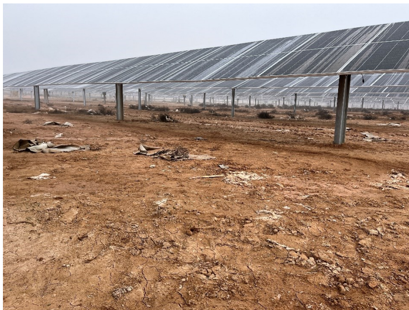
Figura 4 Restos de plásticos

Durante las últimas visitas se han observado abundantes trozos de plástico procedentes de el embalaje de las cajas de los módulos fotovoltaicos.