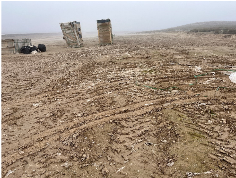
Figura 8 Restos de plásticos