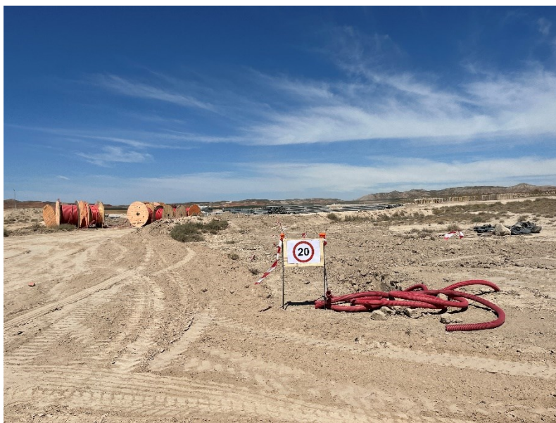
Figura 5 Señalización en obra

La obra dispone de cuba de agua y se realizan riesgos con regularidad. Además, la obra cuenta con un límite de velocidad establecido de 20km/h para reducir de esta forma las emisiones de polvo.