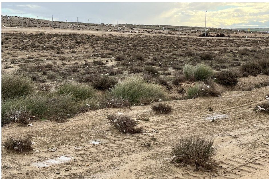
Figura 6 Restos de plásticos

El presente anexo se compone de un número representativo de fotografías del total realizado durante el periodo evaluado, escogidas por su relevancia y/o carácter explicativo para la correcta comprensión del presente informe.