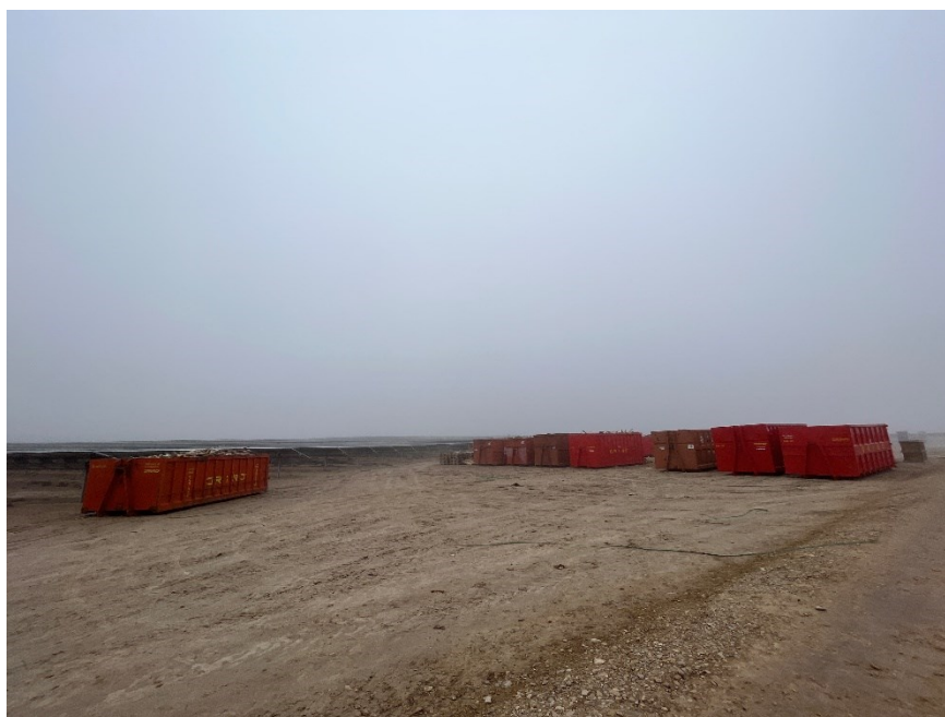
Figura 3 Punto limpio de RNP dispuesto dentro de la planta

El punto limpio de residuos no peligrosos consta de cinco contenedores, uno para restos plásticos (bolsa de basura, botellas, tubos corrugados...), cartón, flejes, madera y plástico blando. También hay una zona para los restos de ferralla.