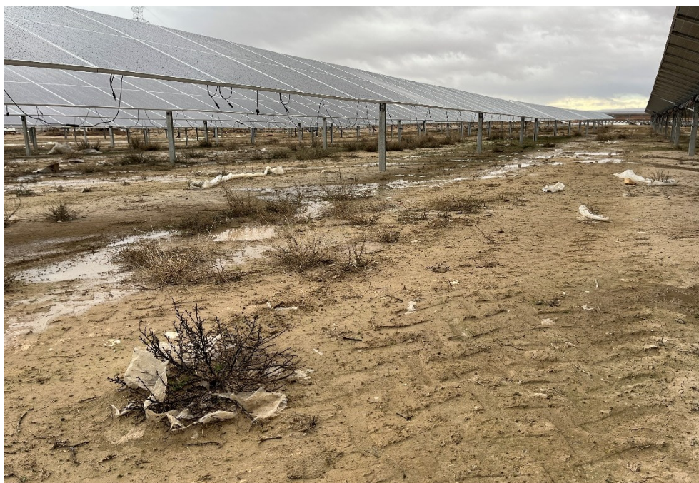
Figura 7 Restos de plásticos