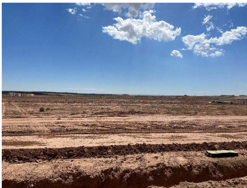
Figura 2 Apertura de zanjas para la RMT

Durante este mes se ha finalizado con las labores de movimientos de tierras, apertura de zanjas de la red de media, y continúan la apertura de zanjas de la red de baja tensión (Figura 2).