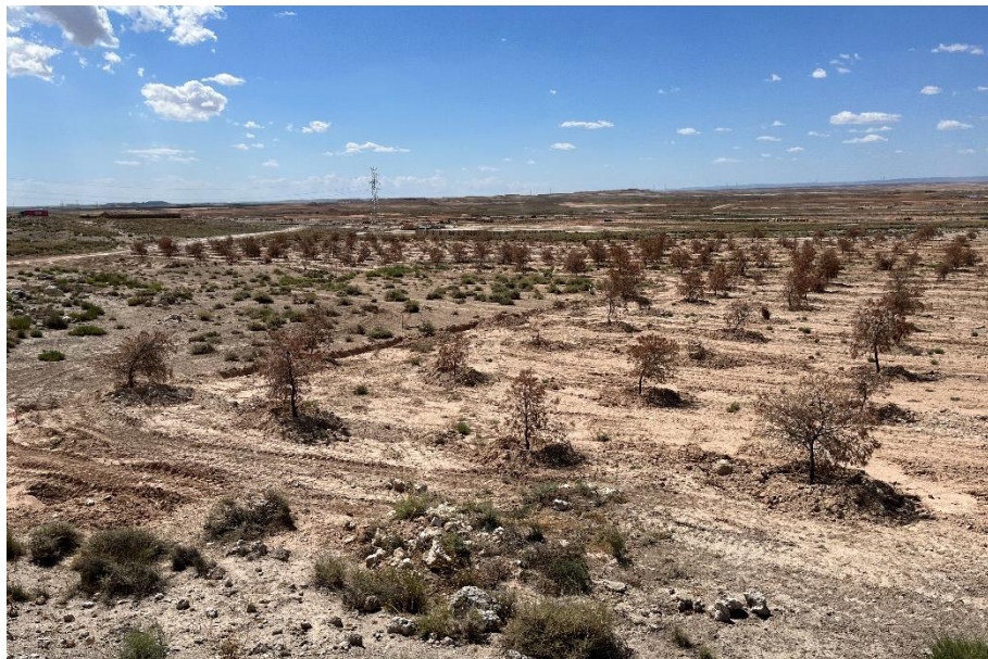
Figura 4 Masa de pinar trasplantada

El presente anexo se compone de un número representativo de fotografías del total realizado durante el periodo evaluado, escogidas por su relevancia y/o carácter explicativo para la correcta comprensión del presente informe.