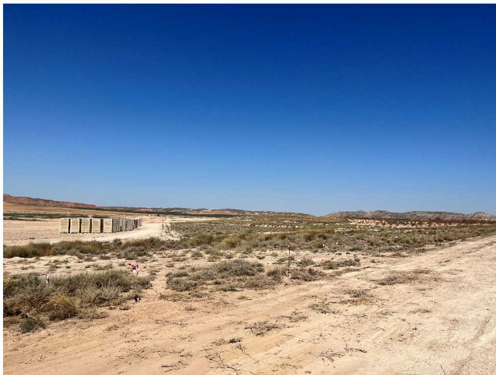
Figura 6 Balizado de la vegetación natural