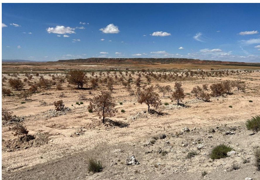
Figura 5 Masa de pinar trasplantada