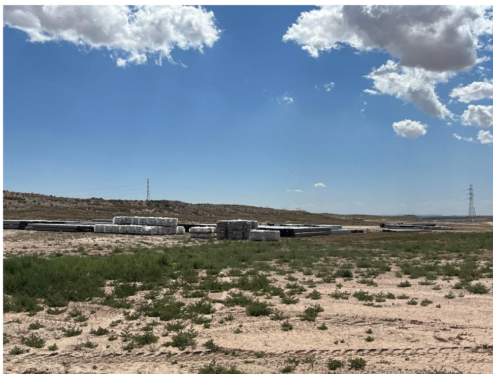
Figura 7 Zona de acopio de material de construcción