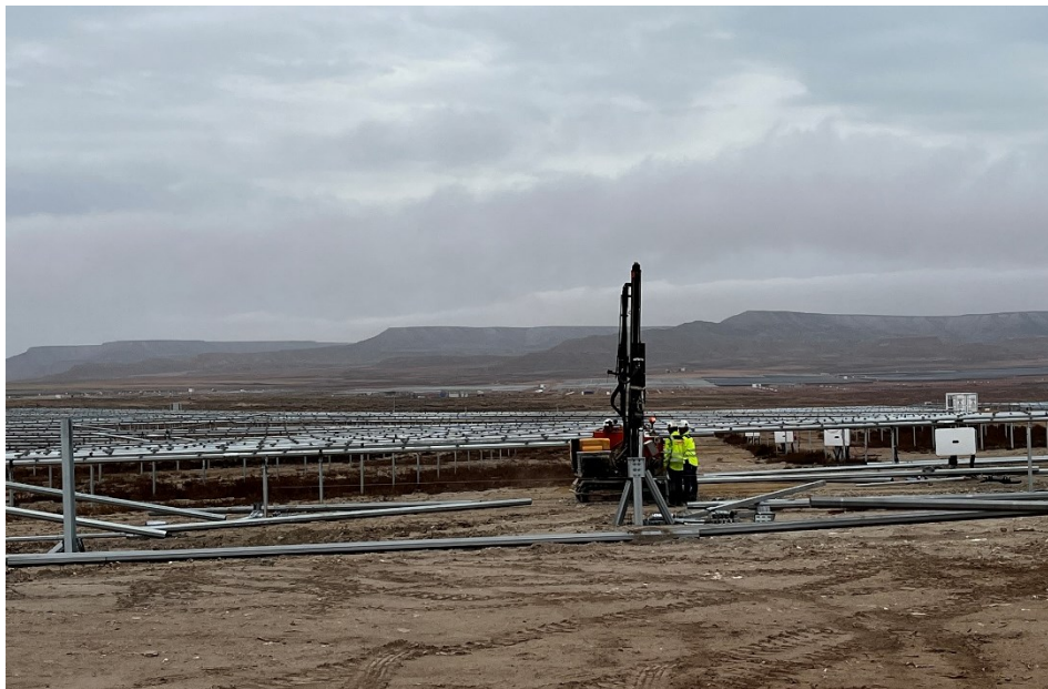
Figura 4 Hincado

El presente anexo se compone de un número representativo de fotografías del total realizado durante el periodo evaluado, escogidas por su relevancia y/o carácter explicativo para la correcta comprensión del presente informe.