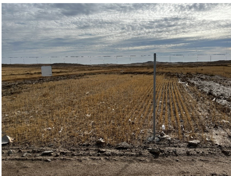
Figura 3 Trozos de plásticos

Durante las últimas visitas se observaron abundantes trozos de plástico procedentes del embalaje de los módulos fotovoltaicos.