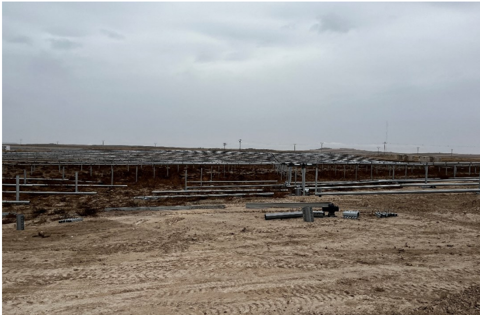
Figura 6 Montaje de los trackers