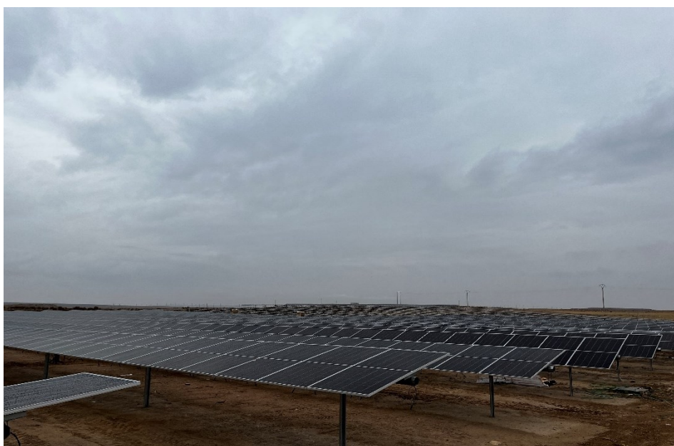
Figura 5 Montaje de los módulos fotovoltaicos