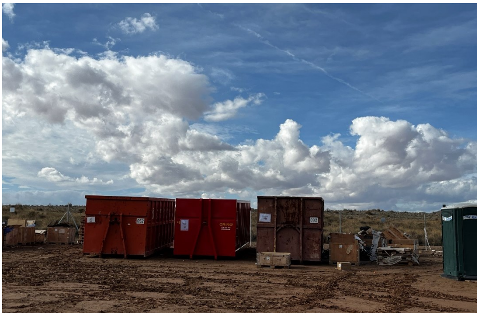
Figura 7 Punto limpio de RNP dispuesto dentro de la planta