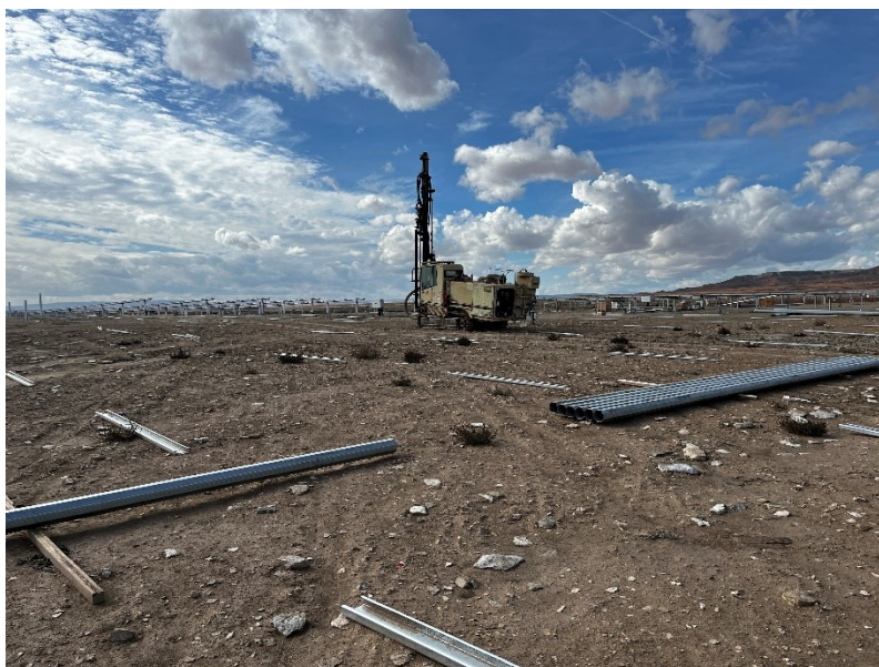
Figura 2 Hincado

Durante este mes, se ha continuado con el hincado de la estructura, montaje de los trackers y de los módulos fotovoltaicos.