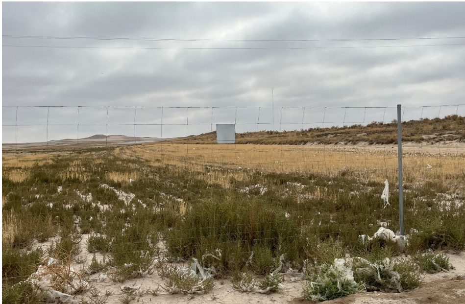
Figura 8 Restos de plástico