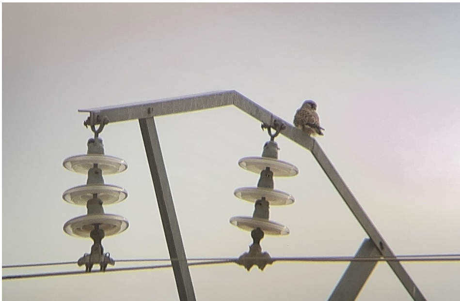
Figura 9 Cernícalo común (Falco tinnunculus)