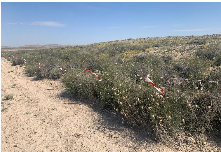
Figura 4 Balizado de la vegetación natural

A día de hoy, se encuentran balizados los yacimientos arqueológicos y las zonas de vegetación natural presentes en el ámbito de la FVs, y se consta que se ha realizado de forma correcta.