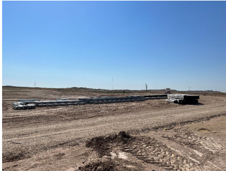
Figura 3 Acopio de material de construcción

En la planta se mantiene un nivel de orden y limpieza óptimo. Las zonas de acopio de materiales para la fase de construcción se han realizado de manera correcta en las zonas destinadas para esta labor.