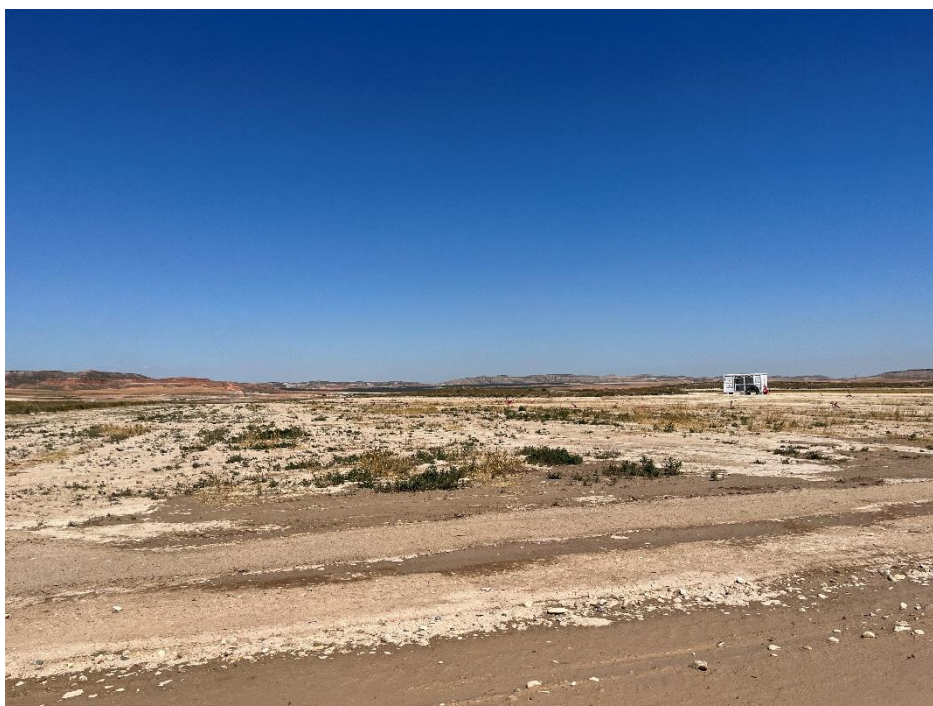
Figura 2 Apertura de viales

A lo largo de este mes se ha finalizado con el movimiento de tierras, la apertura de zanjas de la red de media y baja tensión y con las cimentaciones. También se ha continuado con la apertura de viales (Figura 2).