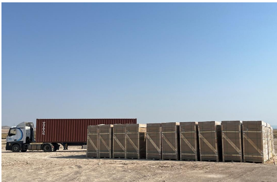
Figura 5 Zona de acopio

El presente anexo se compone de un número representativo de fotografías del total realizado durante el periodo evaluado, escogidas por su relevancia y/o carácter explicativo para la correcta comprensión del presente informe.