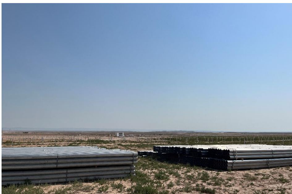
Figura 6 Zona de acopio