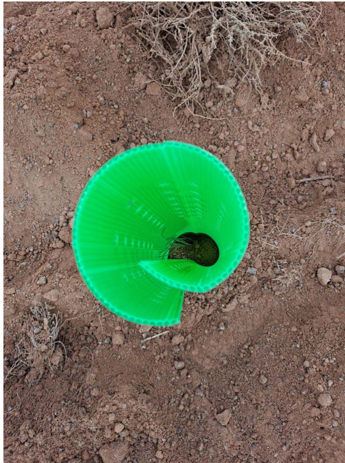
Foto 14. Vallado PITARCO C plantado con pantalla vegetal