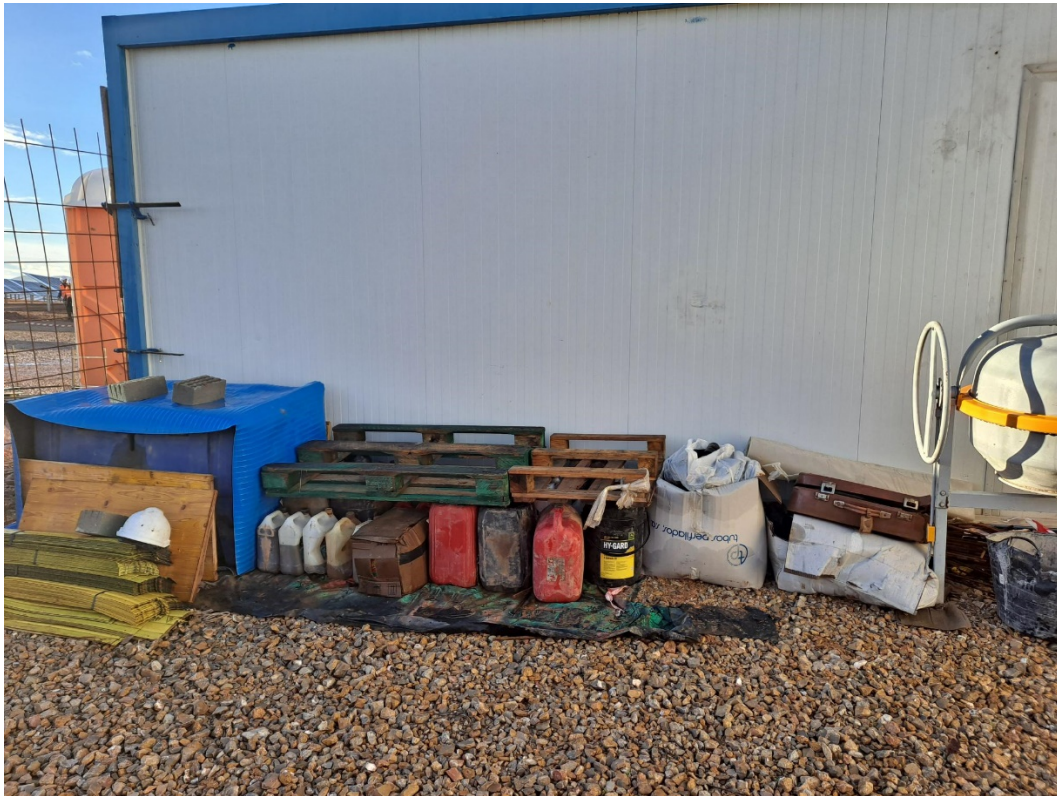
Foto 6. No conformidad abierta a subcontrata por desorden y falta de limpieza