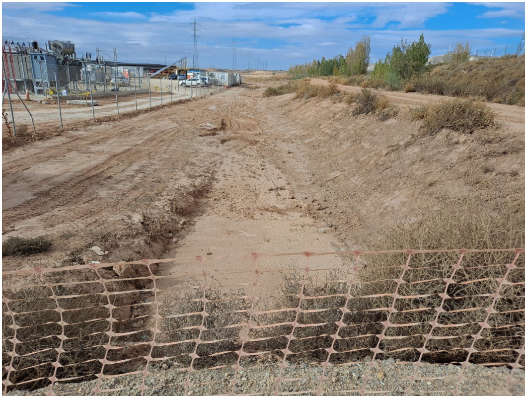
Foto 2. Zona de paso línea subterránea de evacuación