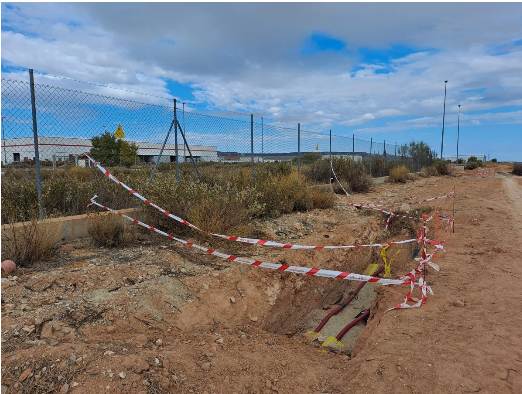
Foto 4. Zanjas para entubado línea de evacuación SET