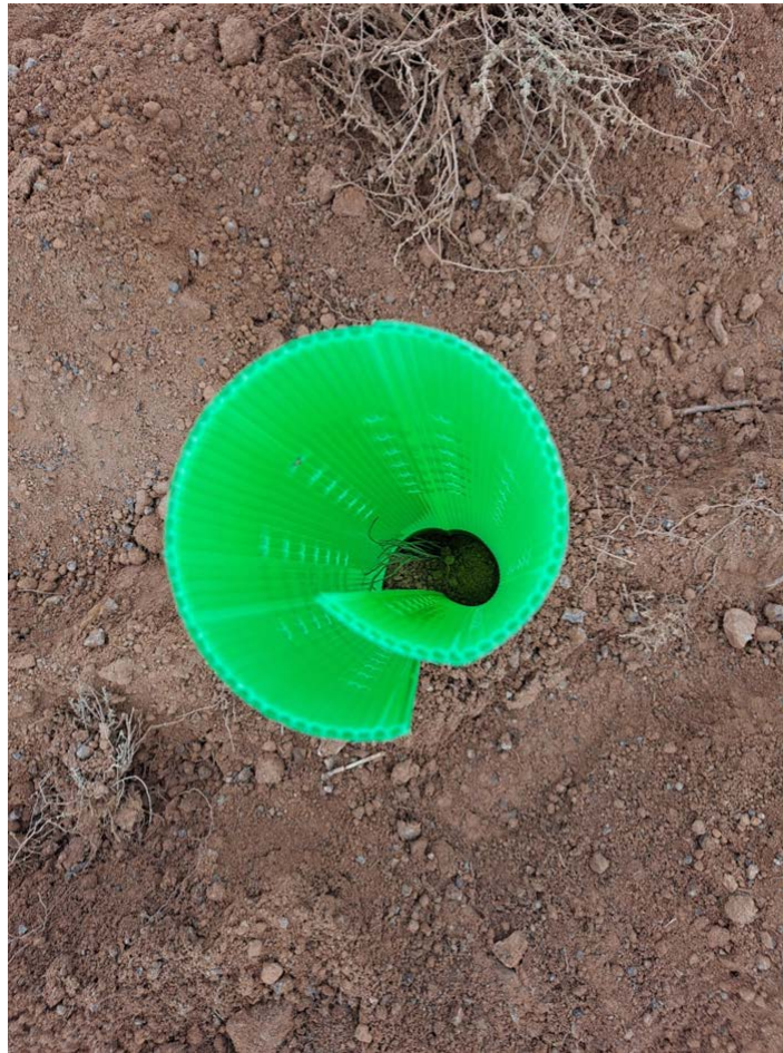
Foto 14. Vallado PITARCO C plantado con pantalla vegetal