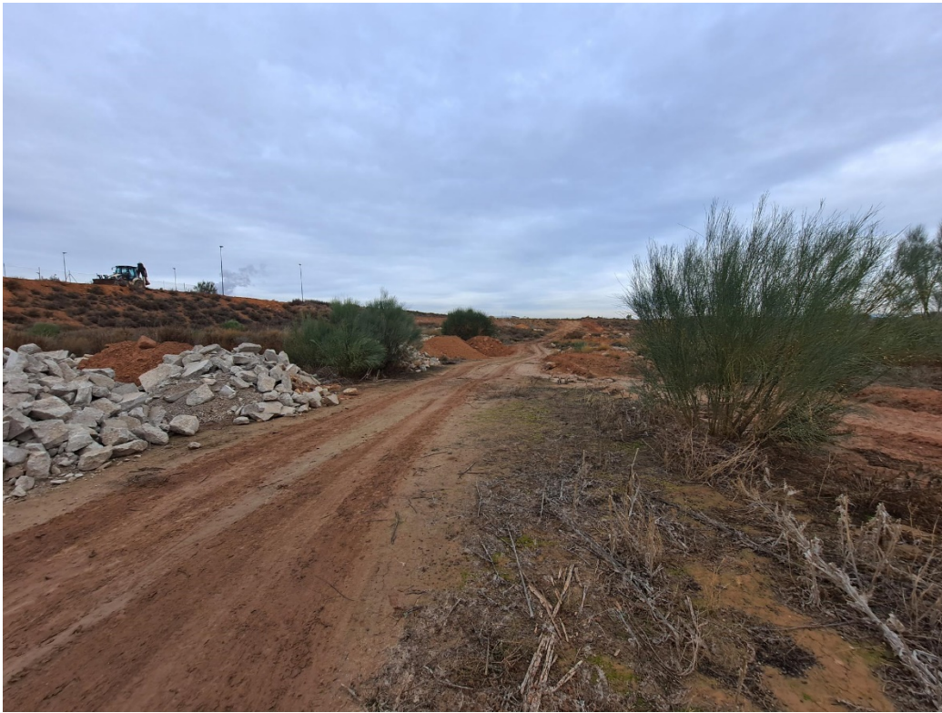
Foto 10. Restos de Escombros de los tajos de la Subestación pendientes de balizar y señalizar