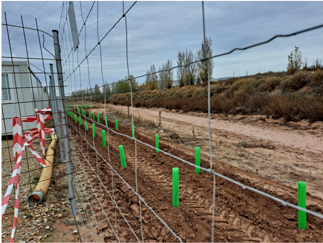
Foto 12. Vallado PITARCO B plantado con pantalla vegetal