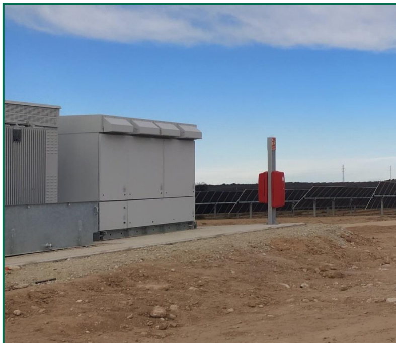
Fotografía 15. Extintor junto a inversores.

Se dispone de extintores en la zona de la subestación y en cada uno de los inversores.