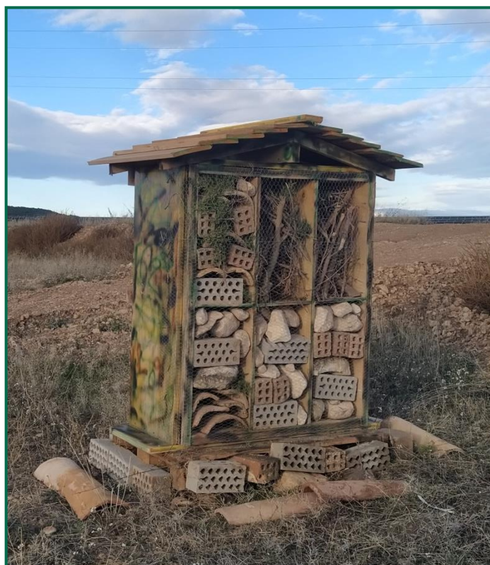
Fotografía 12. Hotel de insectos.