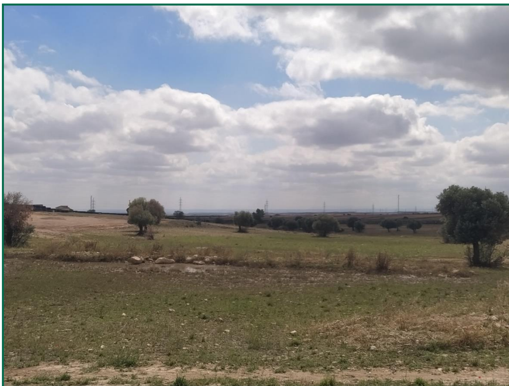
Fotografía 3. Zonas internas con vegetación original.

En las zonas interiores del vallado, donde no se han colocado seguidores ni otros elementos de la planta solar, la vegetación se ha mantenido en su estado original, en varias zonas había olivos, que se han mantenido.