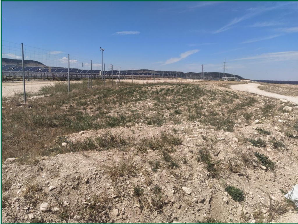
Fotografía 2. Zonas descompactadas antes de realizar plantaciones.