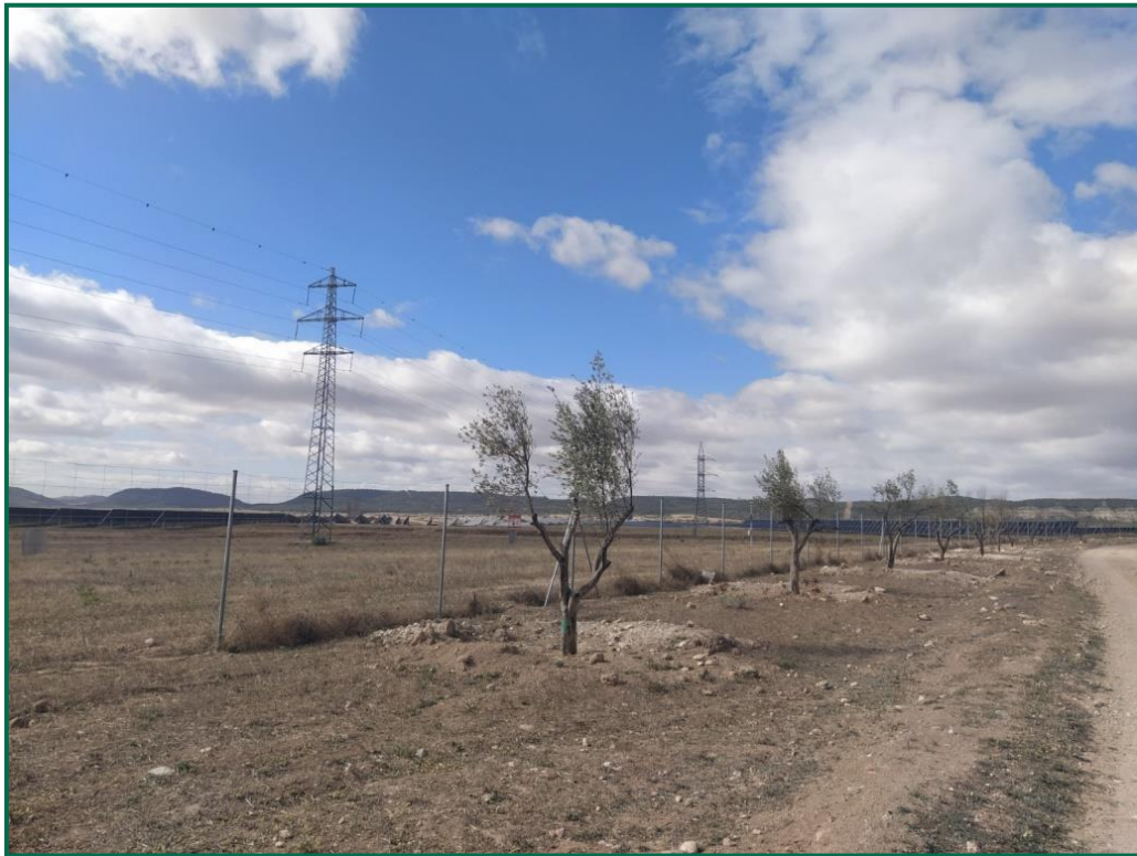
Fotografía 4. Olivos trasplantados.