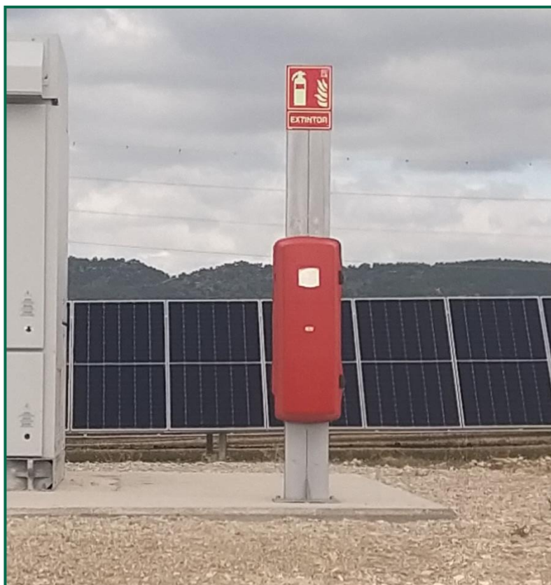
Fotografía 16. Extintor junto a inversores.