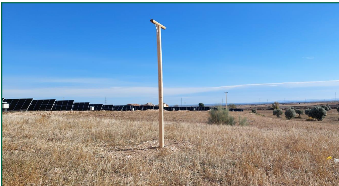
Fotografía 13. Posaderos.