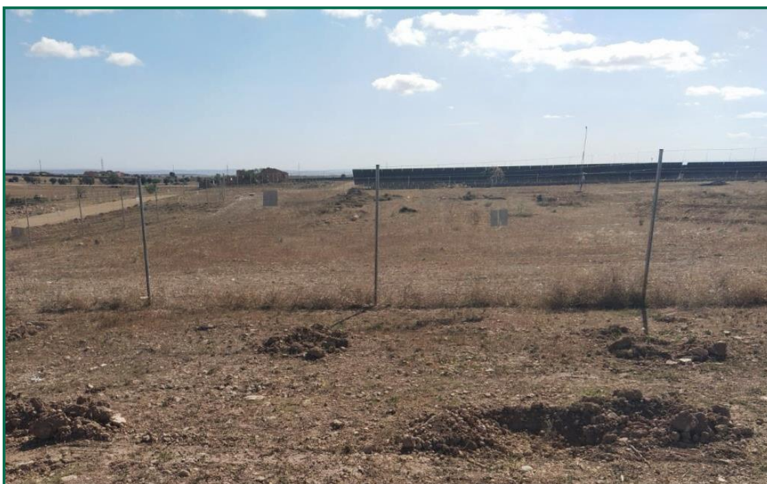
Fotografía 14. Vallado perimetral con placas anticollisión.