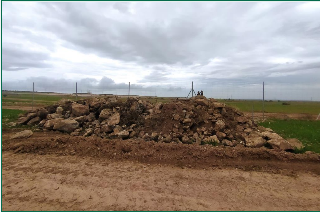
Fotografía 10. Majano para reptiles.

También se ha instalado un hotel de insectos, en la zona norte.