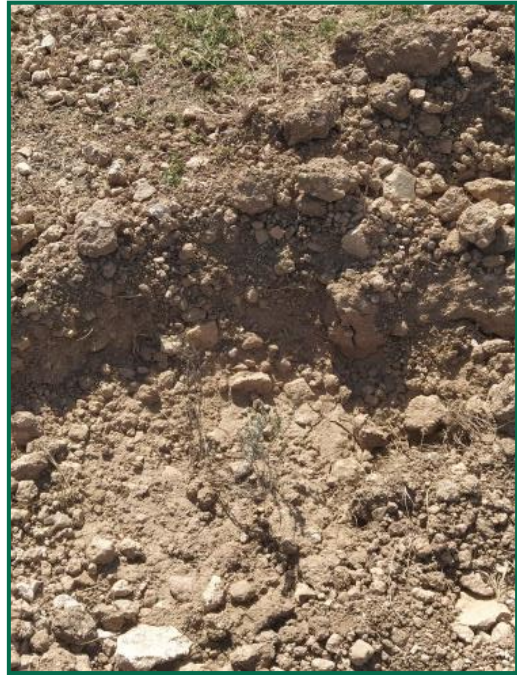
Fotografías 6, 7, 8 Y 9 . Plantones.