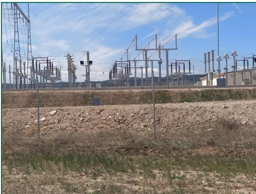
Fotografía 1. Tierra vegetal sobre talud de la SET, ya con vegetación.

Las zonas de acopio que han sido compactadas en obra, se han descompactado mediante su arado.