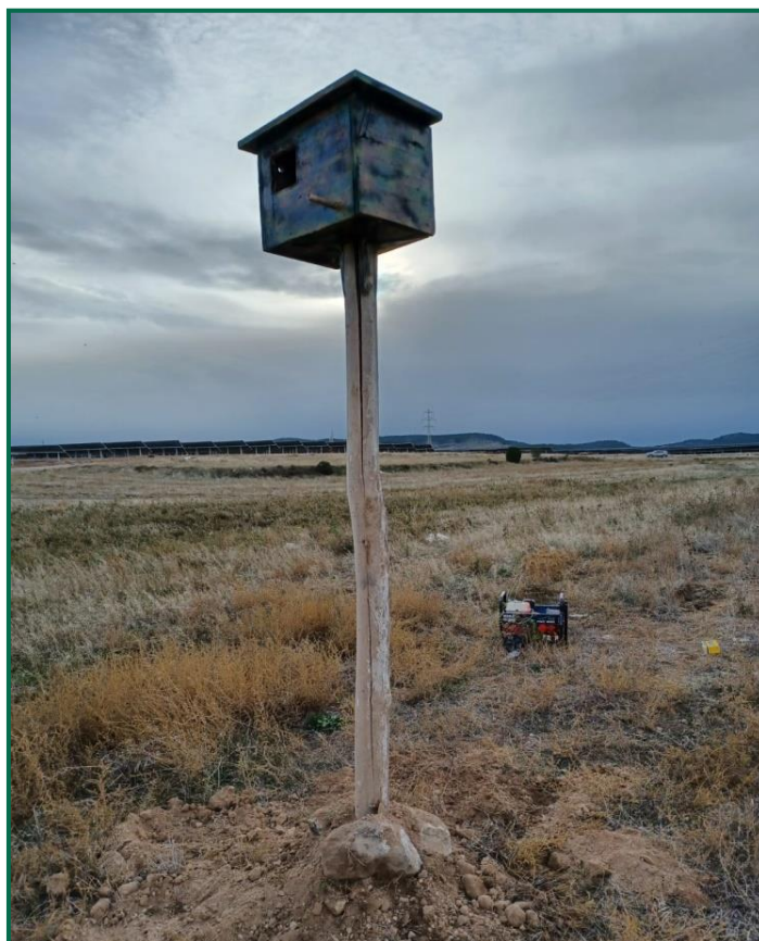
Fotografía 11. Nidal.