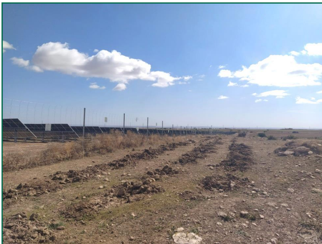
Fotografía 5. Zonas del vallado con plantaciones.