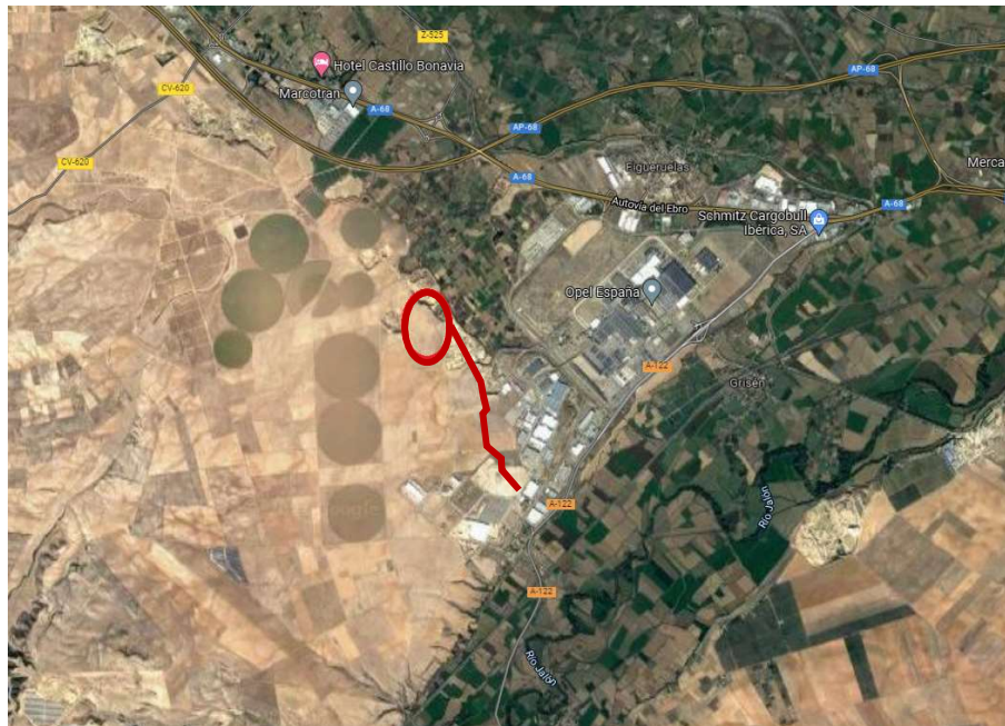
Ilustración 1.1. Ubicación de la instalación solar proyectada y la LMT